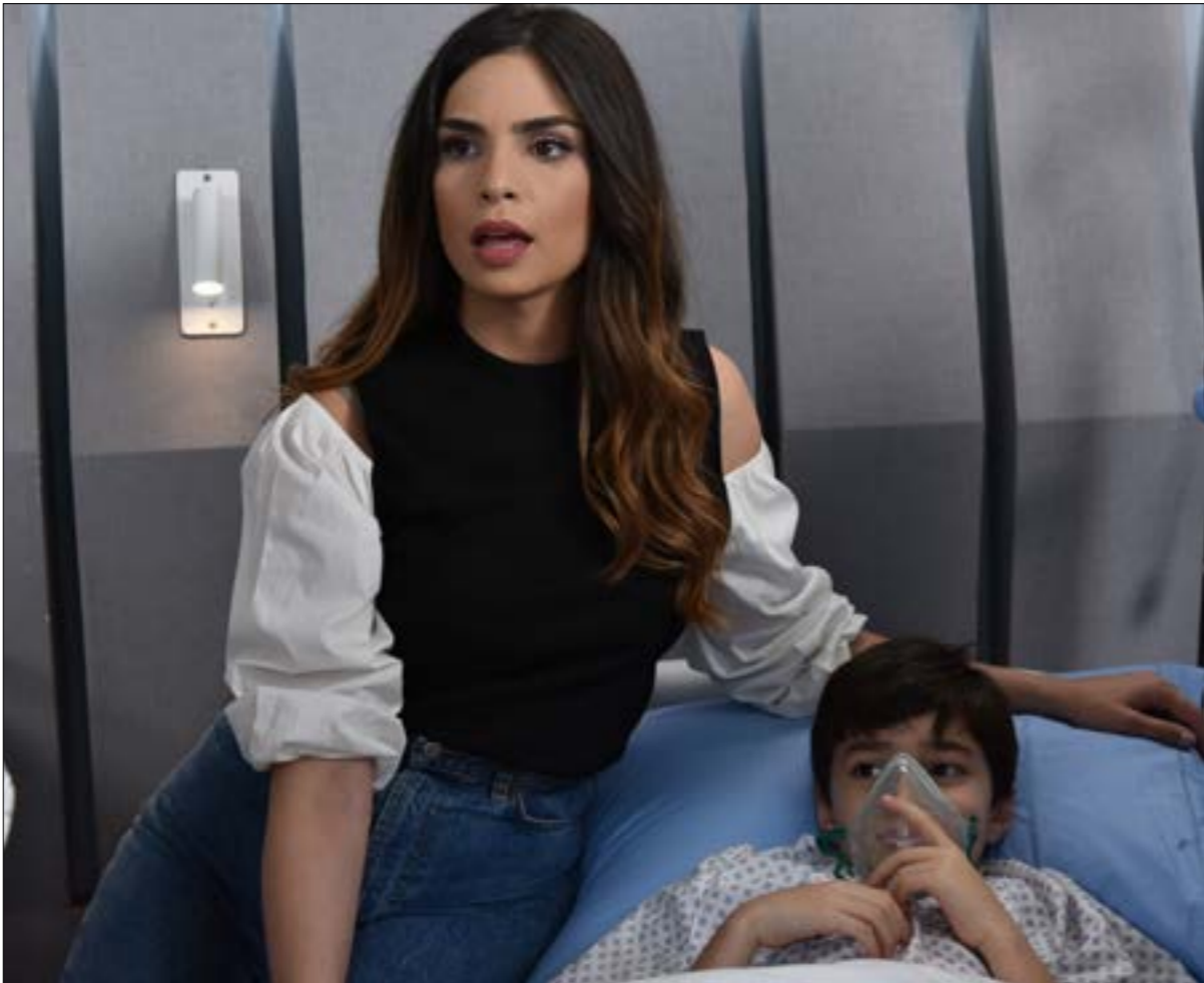
يرتها ريتا حايك في كل مرة عند أداء ناضج

«من الآخر» يومياً 20:30 على mtv ما عدا الخميس والسبت