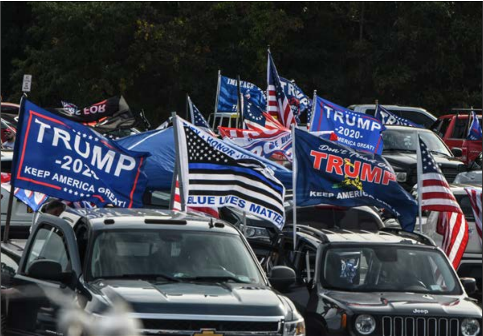
رُجحت مجموعة «ترافلغر، في عام 2016 فوز ترامب، (ف ب)

لا يمكن الاجابة عن هذا السؤال من دون ذكر ما يسمى بولايات «حزام الواقع»، يشرح كهيلي ان شركته تعتمد اسلوباً بسيطاً جداً لجهة عدد الاسئلة وطبيعتها، ولا تأخذ وقتاً طويلاً، والأهم بالنسبة إليه «ثغرة» تُغفل عنها شركات الاستطلاع الأخرى، عنوانها ناخب يلزم «الصامت»، ويدّعي ان عدد العادي يعمل طليعة النهار، ولا يريد ان يمضي وقته على الهاتف ليأل متحدثاً إلى شركة استطلاع، وهذا الأمر، على رغم بساطته، يمنع شركات الاستطلاع من إدراك