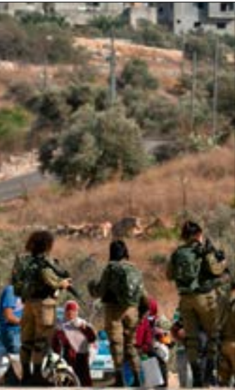
تتعرض الأذرع الطلابية في الضفة من جميع الفصائل للانتقادات (أ.ب.ب)

لا يمكن باتّ حال فصل هذا الإعلان عن الهجمة المستمرة على «الشعبية» منذ «عملية عين بوبين» (أ.ب.ب) اغسطس 2019)، واتهام أعضاء في جامعة بيرزيت، ولا سيما أنها ترفع شعار المقاومة في برامجها كترسيخ للتعلم المقاوم في الضفة، التي سعت فيها السلطة، عبر التنسيق الأمني».