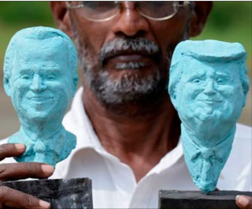
يرمع بايدن شعار إعادة الاعتراف بقيادة الأميركية، على الصعيد العالمي

بايدن التي عبّر عنها في خطابات ومقالات، ومنها مقالته الشهيرة في «فورين أفيرز»، في خلال العام الجاري، تظهر نوعاً من الاستمرارية مع سياسات ترامب حيال هذه الملفات، على رغم اختلاف اللغة المستخدمة والأسلوب، والحقيقة هي ان ترامب نفسه لم يقطع، في السياسات التي اعتمدها تجاه الملفات المذكورة، مع تلك التي أرساها باراك اوباما، إلا على مستوى اللغة والأسلوب. مراجعة تجربة العقود الماضية توضح أن عناصر الاستمرارية في السياسة عبر تمتدّين سياساتها بحلفائها الدولي الليبرالي، والتحصدي بحزّم لـ«عادتها»، وبطبيعة الحال، فإن النقطلة الأخيرة في الأهم، لأنها تغلّف بلغة ايديولوجية غاية حيوية للإمبراطورية الأميركية: التصدي لصعود منافسها غير الغربيين، وفي مقدمتهم الصين وروسيا. حول الصين بالذات، يدعو بايدن في مقاله المذكور أعلاه إلى «التشدّد معها»، ويلوح