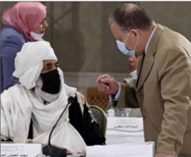
التحذ الفيلك علم طرچ الإسلام محررا وحيدا للتشريع مطباعة بإضافة، الفرض، (أ ب ف هـ)