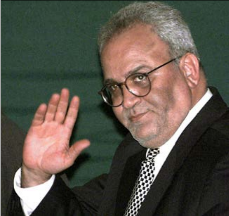
صورة لعريقات تعود إلى عام 1999 حين كان ممثماً للقائه إيهود باراك

عرفات أو ما بعده، إذ تغيب تقريباً أي اتهامات أو