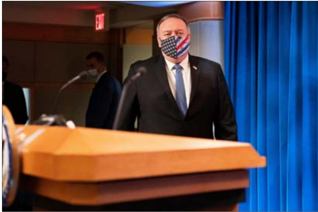
بومبيو ينصب نفسه ناطقاً باسم اللبنانيين، العقوبات لمصلحة الشعب