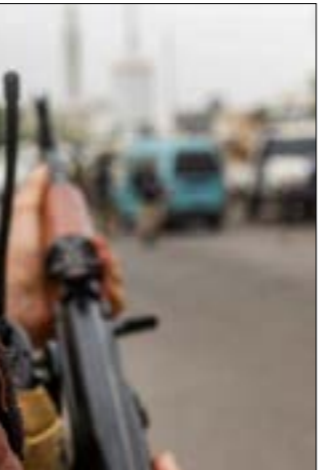
بصر «المجلس الانتقالي»، على نيل سنّت وزارات في الحكومة الجديدة (من اليمين)

البدء بحفر الخنادق وزراعة الألغام في مناطق عديدة من مدينة مارب. وبحسب مصادر محلية، فإن تلك الخطوات التي كان من شأنها تازيم الوضعين السياسي والمديني، ودُكرت مصادر إعلامية أن وفد الانتقاليّ، أبلغ الجانب السعودي نيّته مغادرة الرياض والانسحاب من المفاوضات، وقامت هذا إعلانه بحفر الخنادق وزراعة الألغام في محيط المعسكر الحكومي ومعسكر تداوين ومعسكر الشرطة العسكرية. ووفق مراقبين، فإن سيطرة قوات صنعاء على مناطق شعفان والديره والغيت وجبل الصفراء والحنايا الواقعة في نطاق التماس في الجبهة الغربية، ستمكّنها من الانتحام بالقوات الموجودة في الجبهتين الشمالية والشمالية الغربية الواصلة بين مديرتيّ رعوان ومجزر شمالاً، ومرورا بحرب ماس، وبالتفان من الخطّ الرئيسي، مدغل وصوراح في الشمال الغربي، لتتوخد الجبهات باتجاه مركز المحافظة.