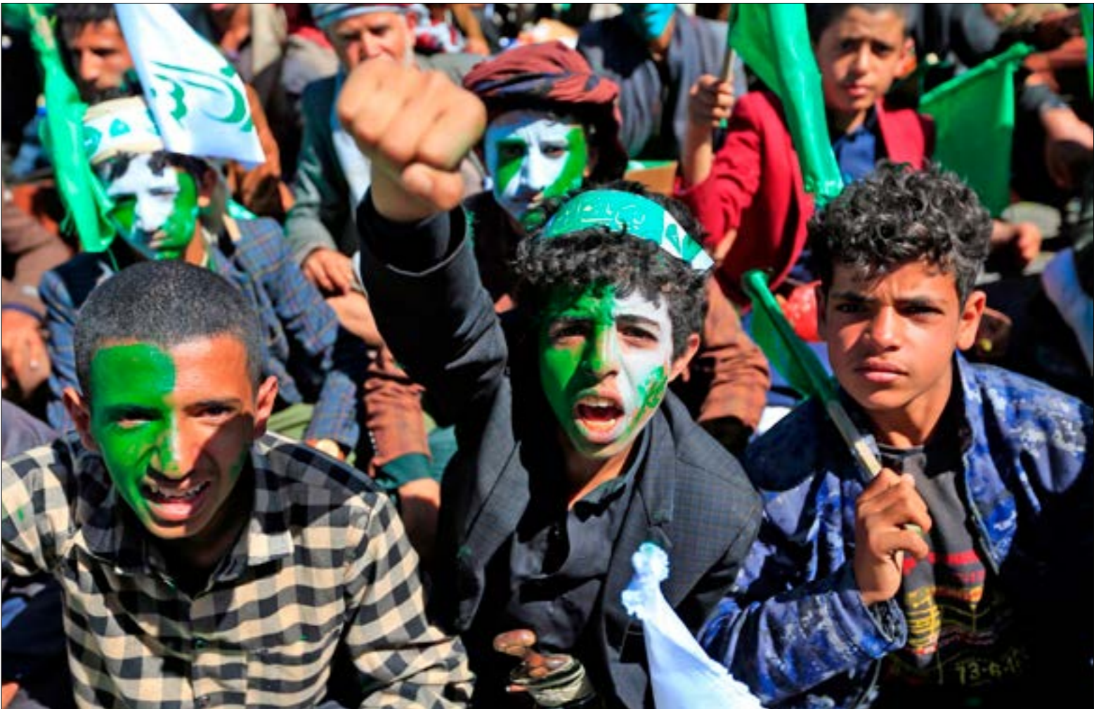
لا ترى صنعاء في استنزاف السياسة الخدام والمراوغة (الف ب)

السعودي، إذا ما تمّ، لن يكون إلا مُكثّلاً لمسوّدة «الإعلان المشترك» المُقدّمة من قبّل المبعوث الأممي،