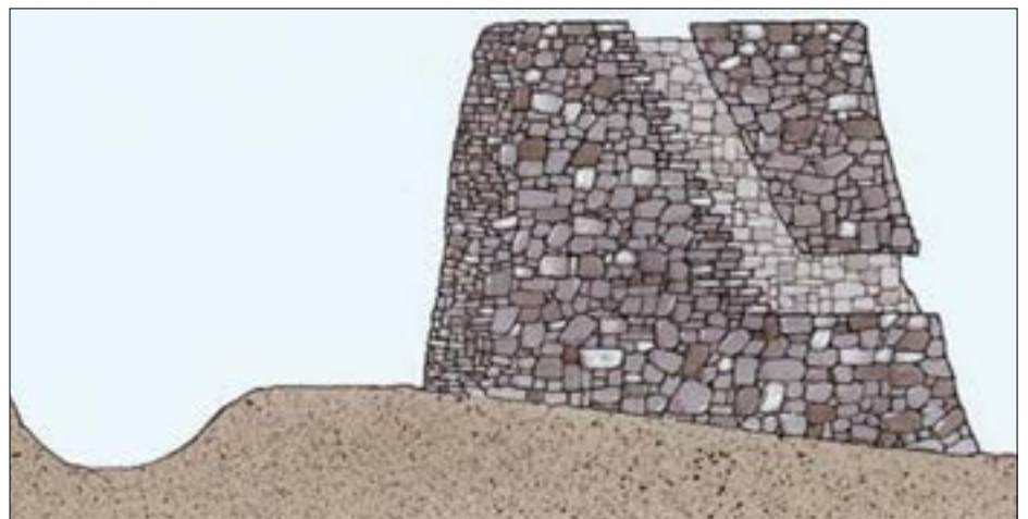
تصميم البرج والدرج

لكن هذه الفرضية يدحضها التصميم الغريب لدرج البرج. فهو يصعد بزواوية تكاد تكون قائمة، وبحيث يبدو أقرب إلى حبل منه إلى درج. وهذا تصميم لا يلائم إطلاقاً فكرة نقل جثث الموتى عبره. فالصاعد فيه لن يستطيع إلا بصعوبة هائلة حمل جثة على ظهره أو سحبها بيديه.