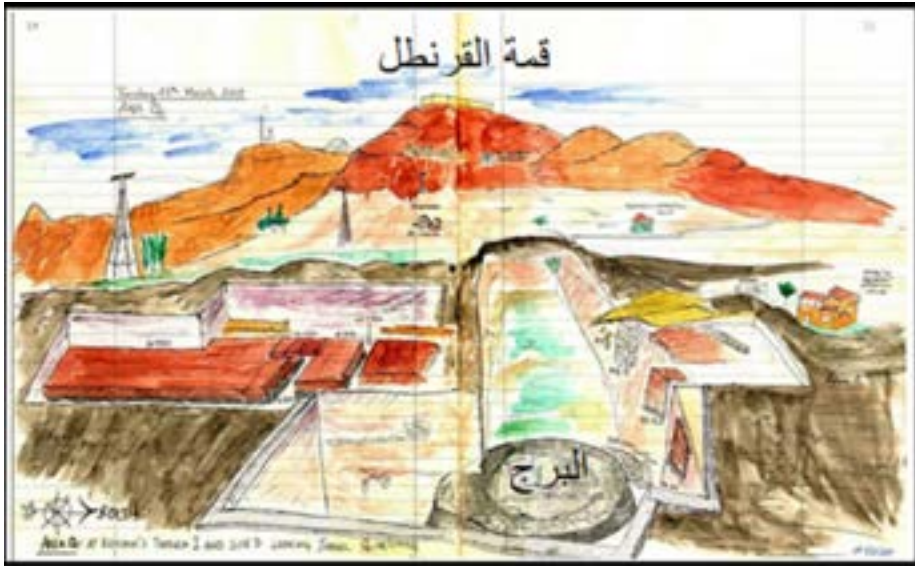
رسم ملون لتلك السلطان في أريحا. وفيه تظهر قمة جبل القرنطل. وقمة برج العصر الحجري. والرسم من: (Drawing by L. Nigro; copyright of Rome «La Sapienza» Expedition to Palestine and Jordan).

وعلى أي حال، فقد نسي باريك نفسه قصة التوقيت الشمسي حين غاص في فرضيته، ولم تُعد الشمس هي المسألة بل الظلال. فقد قدم لنا تمثيلاً كمبيوترياً، تنحدر فيه الظلال عند غروب الشمس من قمة الجبل نحو تل السلطان، مثل عفريت هائل، ضاربة البرج كأول هدف في طريقها، قبل أن تلتهم أريحا العصر الحجري كلها من ثم. وبناء على هذا فقد دخلنا في السحر لا في التفسيرات المنطقية. فالبرج مانعة ظلال، أو مانعة خطر الظلال والليل. وقد بُني البرج في طرف تل السلطان الغربي، وتحت أقدام الجبل، وفي مواجهة، كي يحمي مستوطنة العصر الحجري من ظل الجبل! لكن كيف يمنع البرج خطر الظلال الدايم؟