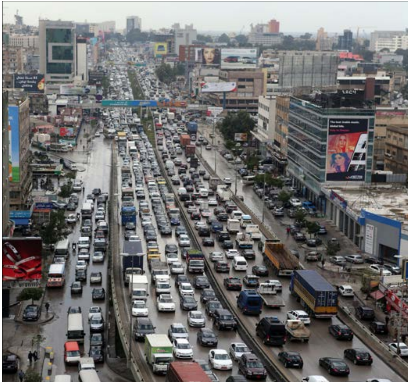
البلدان التي لديها أنظمة استيراد ضيقة نسجته معدلات عالية من وفيات حوادث السير (الأخبار)

البلدان التي لديها أنظمة «ضعيفة» أو «ضعيفة للغاية»، سجّلت معدلات عالية جداً من الوفيات الناجمة عن هذه الحوادث. المديرية التنفيذية لبرنامج الأمم المتحدة للبيئة، إنغر أندرسن، سمّت تصدير البلدان المتقدمة سياراتها المستعملة إلى البلدان النامية بـ«تصدير المركبات الملوثة... وعلى البلدان المتقدمة أن تتوقف عن تصدير المركبات التي لا تستوفي معايير التفتيش الخاصة بالبيئة والسلامة والتي أصبحت غير