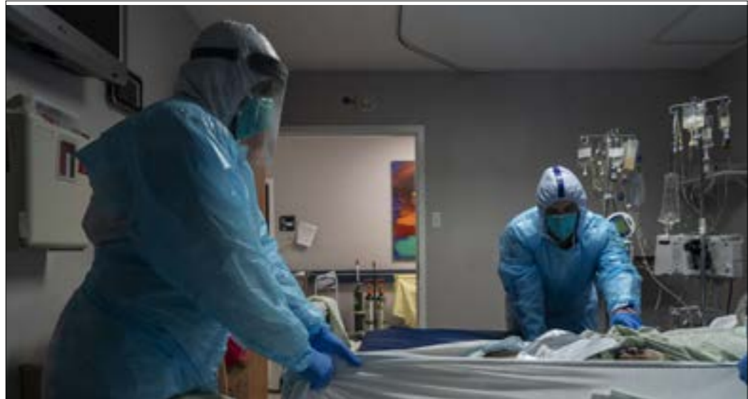
عقار «رهديسفير» للمصابين

1500 جرعة من «رهديسفير»، وصلت إلى لبنان دون معرفة كيفية تصرفها وتوزيعها