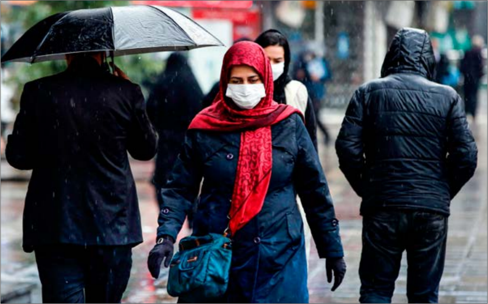
إن لم يكن هناك تعبير ملموس، فإن الرغبة في المشاركة في الانتخابات ستترجم (أ ف ب)

جدلة حوله مشاركة العسكريين إلى جانب دهقان، ثمة آخرون ذوو