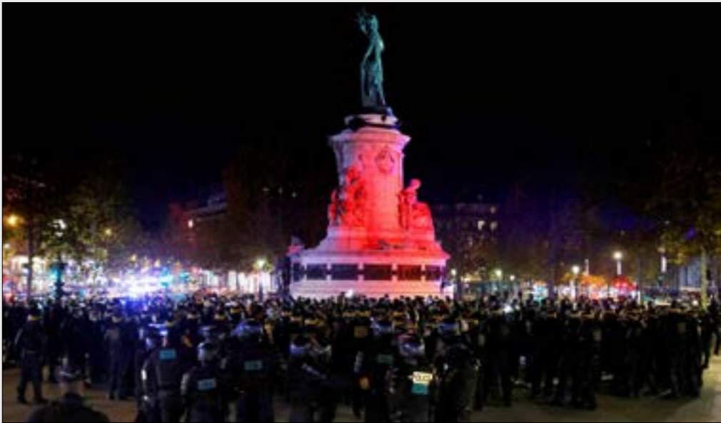
تسعى الشرطة إلى التصدي للتحالف القانوني والسياسية الناجمة عن هذه الليرة التقنية