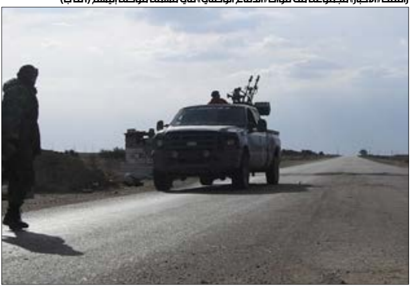
رافقت «الأخبار» مجموعة من قوات الدفاع الوطني، في مهمّة موكلة اليوم

بعد الهجمات الأخيرة التي شهّما تنظيم "داعش" على الطرقات المؤدية إلى محافظة دير الزور ضد الأشهر الماضية، والتي هدّدت بقطع الطريق إلى مدينة دير الزور ومحيطها، توجهت «الأخبار» على متن حافلة من العاصمة دمشق، نحو المدينة التي تقع في شمال شرق البلاد. وعلى طول الطريق، سجّلت «الأخبار» عدداً من المشاهدات والملاحظات، كما تحدّثت إلى عدد من المسافرين، والعسكريين الذين يحرسون الطريق، والقادة الذين يعملون على تنفيذ عمليات تسهم في توسيم طوق الأمان حول المدينة، والطرق المؤدية إليها