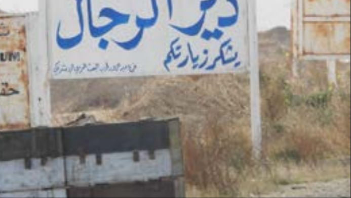
لم تتوقّف حركة السفر رغم الكمان الثلاثة التي تعرضت لها حافلة وشاحنات

تتوقّف الحافلة عند نقطة تفتيش عسكرية في منطقة الشولا، بناءً