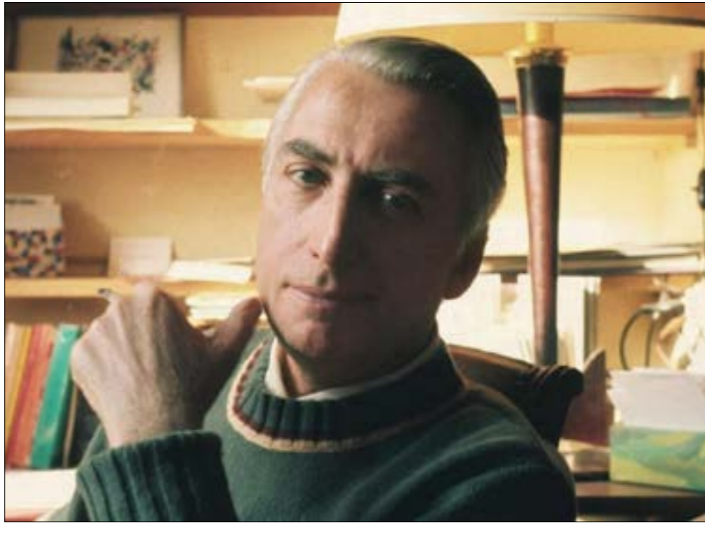
خاض رولان بارت تجربة الفقد، فكانت يوميات جداله من أعلى النصوص إحساساً بالحرز

الموت: لحظة قهر الملائك وشهقة الرسل وربة السماء، إلهام ثورات ما قبل الرحيل، ويطانة قناع السعادة، مقصلة متعلّقات القلب ومقشّ الأمانتي.