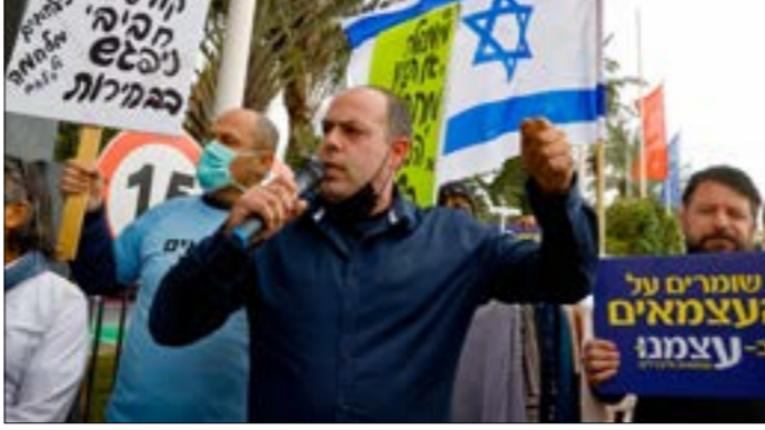
نخار بنظارهون اعتراضاً على الإغلاق الذي فرضته الحكومة الاسرائيلية

وكانت التقديرات والتوصيات التي قدمها الفريق العلمي الذي يترأسه فيرفوسون إيلي فوكسمان، وهو الفيزيائي في معهد «فايسمان»، قد أوضحت أمام جلسة الحكومة