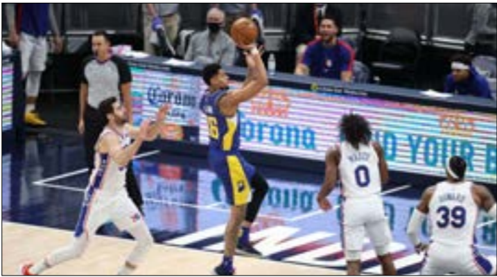
فيل فيلاندنيا تخلف امام دنيا بارف، 16 نقطة إلى مور بارفار 9 نقاط (أف ب)

أوقف دفنر ناغتنس سلسلة من فوزاً توالياً (الأطول هذا الموسم) ليوتا جاز بالفوز عليه (128-117) ضمن دوري كرة السلة الأميركي للمحترفين بفضل 47 نقطة لنجمه الصربي نيكولا يوكيتش، في حين انتزع لوس أنجلوس كليبرز صدارة المنطقة الغربية، وضرب يوكيتش بقوة بتسجيله 47 نقطة بينها 22 في الربع الأول رفعها إلى 33 في نهاية الشوط الأول وأضاف 12 متابعة ليحقق «الدليل دبل» العشرين هذا الموسم. ونوه يوكيتش نجم المباراة بلا منازع بفوز فريقه بقوله: «في الوقت الحالي، يعتبر جاز أفضل فريق في الدوري، يلعبون بشكل مدهش ويستبدون بشكل رائع وحققوا 11 فوزاً توالياً، وبالتالي فالفوز جيد جداً لنا». ومنذ البداية تقدّم ناغتنس بفارق كبير وصل إلى 28 نقطة في الشوط الأول باعتداده بنسبة كبيرة على الرميات الثلاثة ونجح في تسجيل 8 منها في محاولته الـ1 الأولى ثم 15 من أصل 18 في نهاية الشوط الأول. ونجح جاز في تقليص الفارق إلى أقل من 10 نقاط في الربع الثالث، لكن الكلمة الأخيرة كانت لناغتنس بفضل الاحتياطيين جايمباكل غرين وفاكونو كامباتزو اللذين سجلا 9 و6 نقاطاً توالياً في الربع الأخير ليخرج فريقهما فائزاً بفارق 9 نقاط. وتخطى 7 لاعبين من