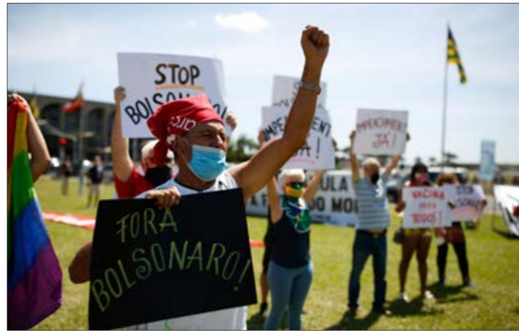
شهدت البرازيل أول من أمس تظاهرات شعبية طالبت باستقالة بولسونارو

الصحة، شهدت البرازيل، الأسبوع الماضي، احتجاجات للمطالبة باستقالته أو عزله، كان آخرها أول من أمس، حيث شارك مئات الأشخاص في جميع أنحاء البلاد. وتجمع نحو 200 شخص في وسط برازيليا حاملين لافتات كتب عليها «بولسونارو ارحل» و«العزل الآن»، في حين سارت عشرات السيارات بنحط مطلقاً أبواقها. وأمام مبنى الكونغرس، وقفت إحدى المجموعات، وقد غطى أفرادها رؤوسهم بأكياس بلاستيكية ترمز إلى موت مرضى «كورونا» في ولاية أمازوناس الشمالية اختناقاً بعد نفاد الأوكسجين في المستشفيات وانهبهار المنظومة الصحية فيها، وهي مشكلة عانت منها أيضاً ولايتا بارا وورايما المجاورتان. تضاف إلى ذلك مشكلة التأخر في عملية التلقيح التي بدأت قبل أسبوعين بـ 12,8 مليون جرعة في بلد يبلغ عدد سكانه 212 مليوناً بالتوازي، وفي حين حدث قد تكون له عواقب محتملة على مستقبل بولسونارو في منصبه، انتخب مجلس الشيوخ والنواب في البرازيل رئيسيهما الجديدين، وسط دفع من الرئيس بانتخاب رجلين يدعمهما لرئاسة غرقتي البرلمان لتجنب إجراءات عزله، وفتح الطريق أمام إعادة انتخابه في 2022. وحتى مساء أمس، لم يعرف إذا ما كان المرشّح الذي يحظى بدعم بولسونارو، أرتور ليرا من الحزب التقدمي (يمين)، قد فاز على منافسه باليا روسي من الحركة الديموقراطية البرازيلية،