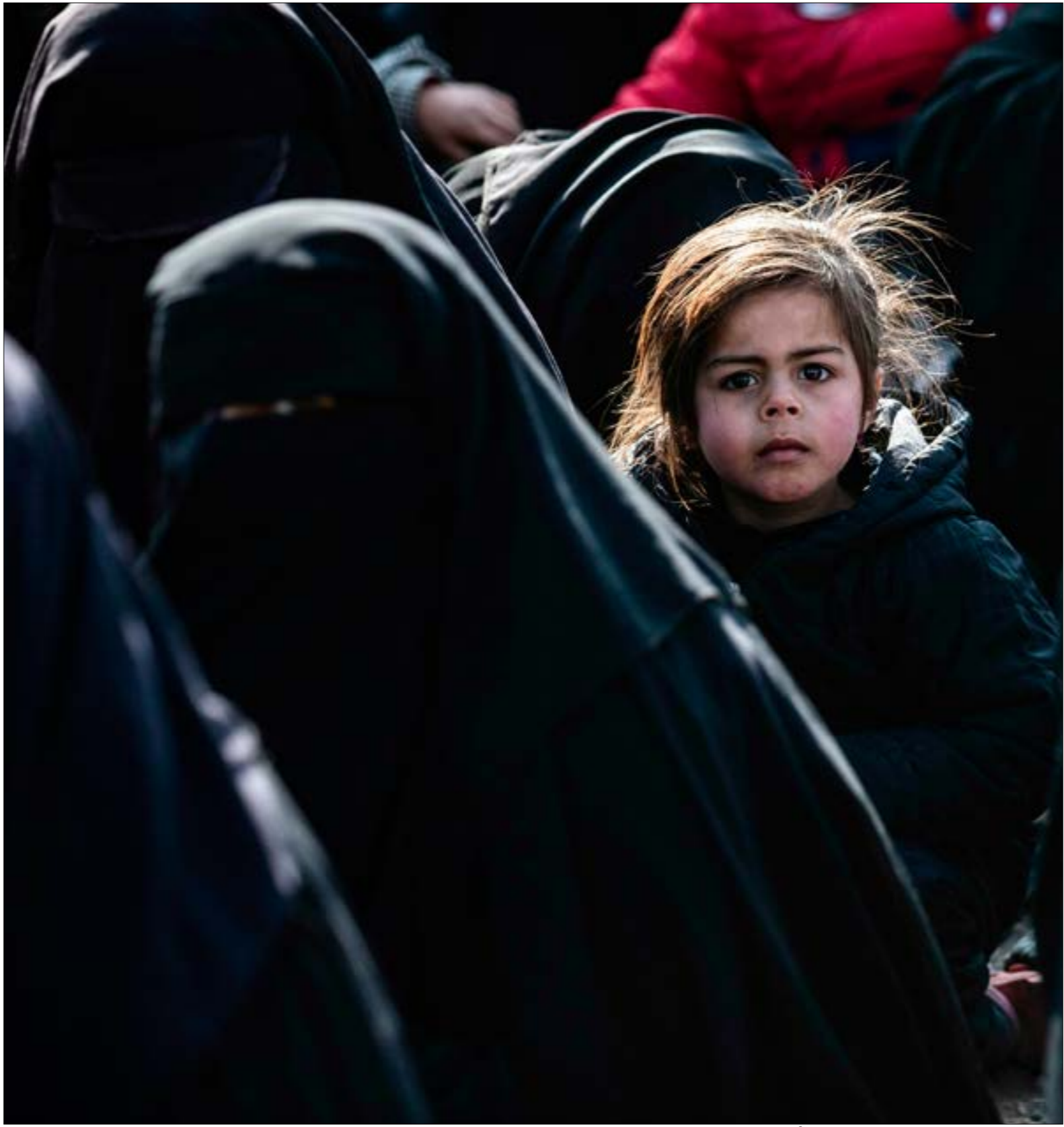
لا يبدو نشاط داعش، في البادية السورية منفصلاً عن نشاطه في الراف

كلم، لشن هجماتهم الأخيرة على طريق دبر الزور -دمشق»، مستتركا: «الجيش السوري قطع الطريق على محاولة إنعاش داعش عبر حملات تشطت متكئة مع ضرب أوكارهم في البادية بهدف القضاء على أي