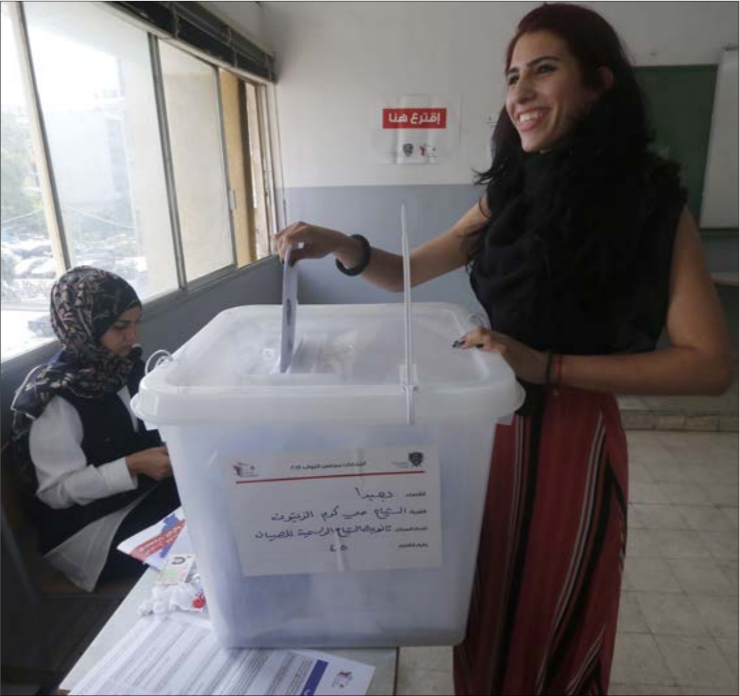
تتوفّق مشاركة المجموعات المدنية على القرار الذي سنخذه بالإجماع، مع ارجحية المشاركة (رأيف)

ننتقّ معها. أما رأي الشخصي فهو بضرورة المشاركة دائماً، لفتح المجال أمام الناس للتعبير عن نبض الثورة داخل الصناديق فدور المعارضة هو الوقوف في وجه السلطة في كل الانتخابات، أكانت نيابية أم نقابية أم بلدية أم طلابية وتقديم مشروع بديل. ينبغي تفعيل دور التصويت العقابي لكسرهم». أما مصادر الكتائب، فتشير إلى أن موضوع المشاركة أو عدمها يناقش في حينه في المكتب السياسي ومع المجموعات المدنية التي تتخالف معها.