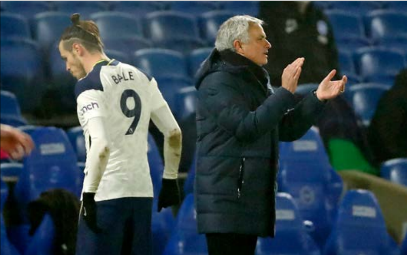
مار توتنهام في مباراتين فقط من آخر 11 مباراة في الدوري (أ ف ب)