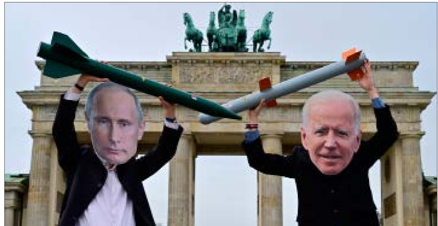
معاهدة «نيو ستارت»، بيت واشنطن وموسكو لخمس سنوات إضافية

تسلك العلاقات بين روسيا والغرب طريقاً وعراً، إذ لا تكاد تاتي المؤشرات الإيجابية لضبطها، حتى تعود سريعاً إلى الانحسار. وفي موازاة الخرق الذي تحقق بين واشنطن وموسكو على خط إعادة تفعيل معاهدة «الحدّ من الأسلحة الاستراتيجية»، «نيو ستارت»، لمدة خمس سنوات إضافية اعتباراً من يوم أمس، عاد الغرب، من البوابة الأوروبية، ليرفع سقف الضغط على روسيا، في قضية المعارض اليكسين نافالني، الذي حكم عليه