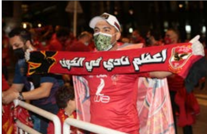
واكب الاملي جهمور كبير بعد وصوله إلى الدوحة