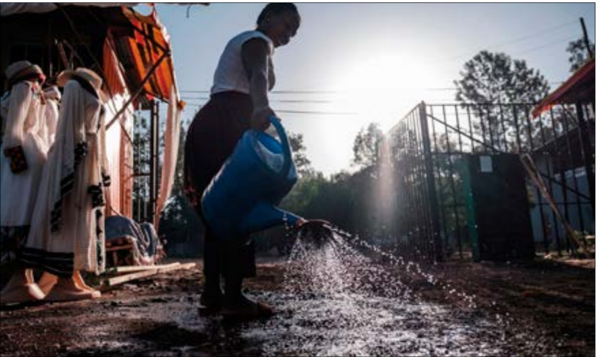
تتمسك اديس ابابا بتخريف العديد من الهياخ خلال الملء المقبل، بغض النظر عن كمية المطار

استبقت مصر الوساطة التي يُفترض أن تقوم بها الكونغو خلال رئاستها الاتحاد الأفريقي، المقرر أن تتسلمها الأسبوع المقبل من جنوب أفريقيا، بمناقشة أزمة «سد النهضة» مع رئيس الكونغو، فليكس تشيسيكدي، خلال زيارته للقاهرة، وذلك ضمن الضغوط الدبلوماسية على أديس أبابا من أجل التوقيع على اتفاق ملزم في الية ملء بحيرة سد النهضة وطريقة عمل السد في مرحلة ما بعد الملء. ويتزامن التحرك المصري مع تحركات إثيوبية لتحييد برزافيل، علماً بأنه رغم انتهاء الوساطة الجنوب أفريقية، سيظل هناك دور لكيب تاون عبر «الشريكة الإفريقية». ولا تزال أروقة القرار المصرية تعول على قرار نهائي من اتحاد القارة قبل تموز/ يوليو المقبل، موعد الملء