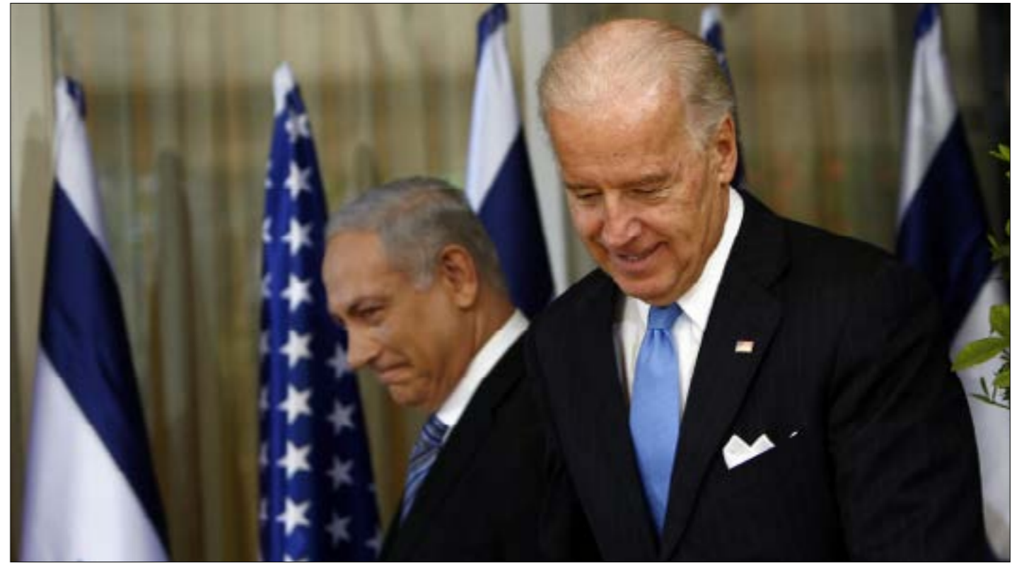
قد لا تقتصر الإشكالية المقبلة على السلبية الشخصية بين تتنياهو وبايدن (من اليمين)

المشوع، وربما إلى حدّه الأقصى، بما لا يضّر بمصلحة التابع ولا يتناقض معها. قد يأتي الاتصال اليوم أو غداً، أو يتأخّر أكثر أو أقل، إلا أن أصل التأخير إلى الآن يعدّ شأنًا ويحمل أكثر من دلالة على «انتفاء الود» بين بايدن وبتنياهو، بما يتعكس سلباً على العلاقات بين الجانبين، وينسحب بشكل أو بآخر على المصالح الإسرائيلية في أكثر من اتجاه. لا يخفي الإسرائيليون خشيتهم من دالات «اللاود» على الآتي، في مرحلة تعدّ حساسة جداً ولايقينية في الحالة الإسرائيلية بعدّ دلالة على سلبية مقبلة في العلاقات بين الجانبين، قد لا تقتصر على السلبية الشخصية بين تتنياهو وبايدن.