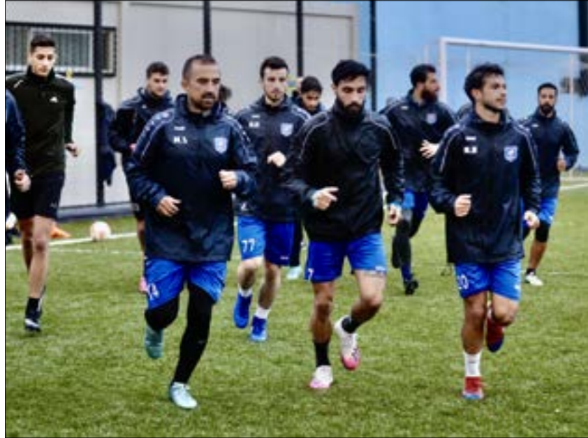
لأعو شباب الساحل خلال التدريب أمس

كما ستقام مباريات المجموعة الثالثة في الأردن أيضا، وهي تضمّ الفيصلي (الأردن)، السيب (عمان)، تشرين (سوريا)، والفاخر من الكويت والكويتي والإمري الفلسطيني.