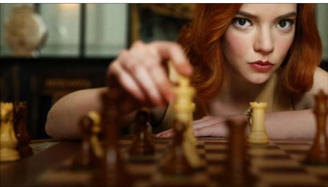
قبة قبي Queens Gambit يساعدهم الميركيون الصبية في مباراتهما ضد مائراس خشي اللامع من زمت المتناورة، المراهنة على الإخفاء، الصبر، الاستسلام، واستغلال الوقت... وصولاً الى ما يجعلها لعبة تتجاوز بابعادها المنطق الكلاسيكي للتنافس بين اللاعبين والدول على حدّ سواء، وقد كتبت الكثير عن تلك اللعبة الساحرة، وأهميتها في تاريخ الأمم، حيث

هذا امر جلل، وتجب معالجته عبر كتابة نصوص، واستنباط بعض القصص، والروايات لتحويلها إلى أفلام تسويقية تناسب حكّام العالم الحر. وهذا ما حصل عندما أنتج فيلم «تضحية البندق» سنة 2014 من بطولة وإنتاج توبي ماغواير، بطل سلسلة «سبايدرمان». جسّد بوبي فيشر وعبارة الشطرنج الأميركي الممثل هنري كيسنجر، مع ما يمثل في سياسة أميركا، محمّساً اللاعب الأميركي، متدخلاً، وموضحاً له أن ما يقوم به يتعدّى اللعب إلى ما