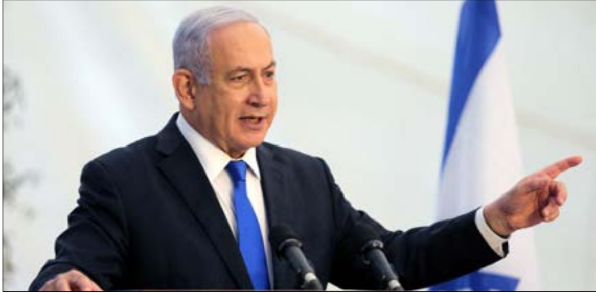
أهم نتائجه، إيران، بالمسؤولية عن حادثة السفينة، وتوعد بالردّ

من شأنه فرملة الاندفاع البحرية الإيرانية، إن كانت إيران - بالفعل - هي التي استهدفت السفينة التجارية الإسرائيلية قبل أيام، في خليج عُمان. كذلك، للردّ في سوريا تبعات سلبية على الجانب الإسرائيلي، سيتمّ تلقّف دلائها في طهران، ليبقى مال الأمور بين الجانبين رهن ما سيكتشفه المستقبل.