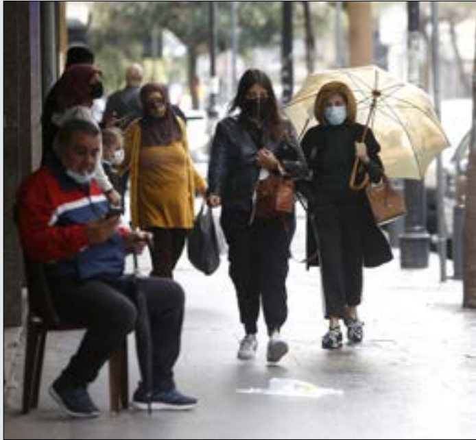
رفضت العرابة عرضاً من إحدى الشركات لبيع اللقاح بعشرة دولارات