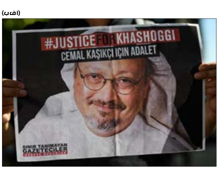
الوطنية المسؤولة عن الانتقال من الإمارة إلى الدولة الوطنية. أمّا اليوم، فما تشهده المملكة هو انتقال الصراع بين المركز – الأطراف إلى المركز – المركز، وهنا تكمن الزعزعة العنيفة المحتملة وخطر التبعثر الكياني الذي يحدث بالدولة.

«نقيم معها علاقات دبلوماسية»، في ضوء ما تقدّم، يصبح التقييم الجاري للعلاقات الأميركية - السعودية بمثابة ملهاة جديدة، ريثما تجلّي أولويات إدارة بايدن في المنطقة. مع ذلك، يتضح أن العلاقات المتحددة انقلاباً، منذ قرار بايدن تحولات في نهج الإدارة السابقة. ولم يكن إعلانه وقف دعم التحالف السعودي - الإماراتي في حربه على اليمن، وفق «انصار الله» من القائمة الأميركية للإرهاب، إلا جزءاً في سياق هذه التحولات، واستناداً إلى موقفها من حرب اليمن، أوقفت واشنطن صفقتي سلاح مع الرياض، على أن يتّقدّم مبيعات السلاح الأميركية إلى المملكة على أساس كلّ حالة على حدة»، وفق (الأخبار)