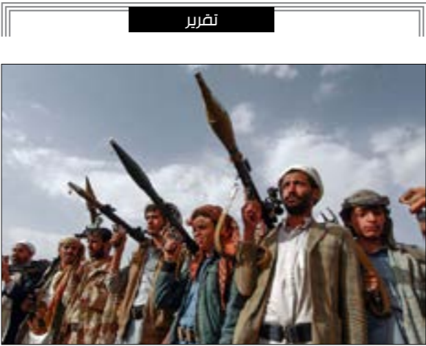
لقه فرار حاسم في صنعاء، بالردّ المولم، على أيّ تعرّض لحقول النفط في صافر

تجاوزت حدّها في الأونة الأخيرة، إلى ما يدفع إيران نحو توسيع نطاق الردود. والحديث عن صعوبة الردّ الإسرائيلي لا يتعلق بالعجز عن استهداف إيران في البحار، إذ إن القدرة على ذلك متوافرة وليست موضع جدال، إنما المسألة ترتبط بإرادة استخدام هذه القدرة، والإرادة مرتبطة بدورها بنتيجة الموازنة ما بين جدوى الفعل ونتيجاته وما يمكن أن يتسبب به لاحقاً، وهو ما أذى، بعد دراسة وبحث في تل أبيب، إلى الامتناع عن الردّ بالمثل على العمل الإبتدائي المنسوب إلى إيران بحسب الاتهامات الإسرائيلية، الأمر الذي يُعدّ شذوذاً عن قواعد الردّ الصارمة التي تتبناها إسرائيل، لناحية التناسب مع النطاق والنوع لضرورات ردع الطرف الآخر. لكن هل انتفاء تل أبيب اليوم يعني انتهاء احتمالات المواجهة البحرية