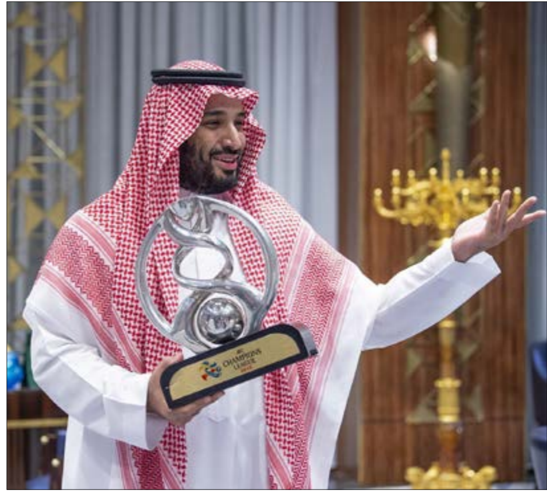
يحاول محمد بن سلمان الاستثمار في الرياضة على خطى ابن زايد والطيربي

تلّفه اللاعب ليونيل ميسي عرضا لكي يصبح وجه ما يُعرف بمجلس السياحة في المملكة العربية السعودية، خطوة يأمل منها ولي العهد محمد بن سلمان تلميم صورتهم وصورة البلاد. مستفيدا من شهرة صحيفة «التلغراف» للاعب الأرجنتيني، وربما إخفاء عدد كبير من القضايا والتجاوزات التي يُتهم بها بحسب المنظمات الحقوقية، لكن ذلك قد لا يتحقّق نظرا إلى مطابطة عائلات سجناء الراه في المملكة نجم برشلونه بعدم قبوله لترحيل لاهداف ليونيل ميسي