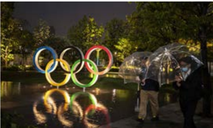
تعام الدورة في الصيف المصعب (أ ف ب)

1- هيفل - بنجاب - 2- نخب - بوريون - 3- ان - ني - 4- بركل - لوح - 5- بال - بر - 6- وهران - هم - 7- رودريغ - غلو - 8- دن - شوايش - 9- دالي - لاب - 10- كال - الخرب