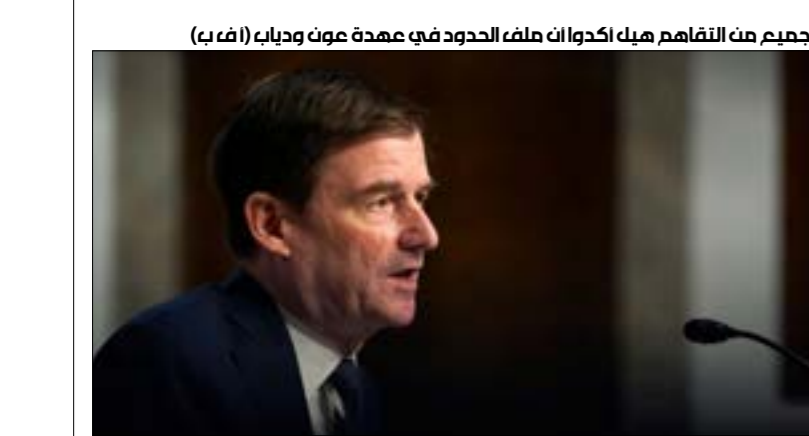
جميع من التقاهم هيك أكدوا أن ملف الحدود في عهدة عون ودياك (ف ر)

ضمن المساحة المتنازع عليها (1430 كيلومتراً)»، إضافة إلى «انتظار ما سيقوله هيل في اللقاء، بصفته يمثل الجهة الوسيطة في المفاوضات». وأكدت مصادر عون أنه «لن يفُط في أي شبر من حقوق لبنان، وسيحدّد القرار المناسب في الوقت المناسب». المتعضون من أداء رئيس الجمهورية يقولون إنه «يريد أن يستعمل الملف لتثبيت نفسه مرجعية في التفاوض. كما أنه سيسنتفر به داخلياً من خلال الدفع في اتجاه عقد جلسة الحكومة من أجل تعويمها في وجه الرئيس الحريري».