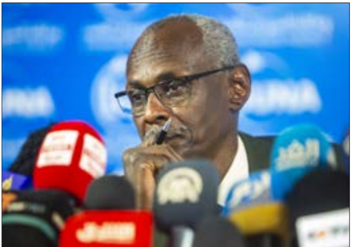
زعيم السودان حاليا ملما فانونيا متكلمًا للبدء في المسارات القضائية (الانطولى)

عهد الرئيس المخلوع، عمر البشير، في آذار/ مارس 2015. وحرص كمدوك على تضمين رسالته تأكيداً لكون الدعوة آتية بموجب مخرجات لقاءات الوساطة الأفريقية واتفاقية المبادئ التي تنص على إحالة الخلاف على رؤساء حكومات الدول في حال تعثر المفاوضات، على أن يكون الاجتماع مغلقاً عبر تقنية «الفيديو كونفرانس» لتجنب أي عراقيل من الجانب الإثيوبي، أو التعلل بانتشغالات داخلية قد تحول دون حضور رئيس الحكومة، أبي أحمد، المناقشات خارج بلاده.