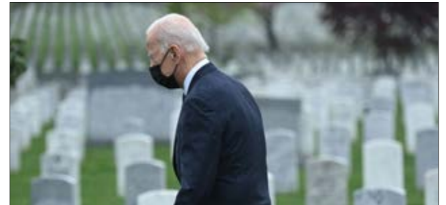
بايدن يتوجّه في مقبرة راينغتون الوطنية للكريم الذين سقطوا في الحرب على أفغانستان

الخروج «قبل الأوان»، إلى أن حسم أمره يوم أمس، حين قال إن «الوقت قد حان لإنهاء أطول حرب خاضتها الولايات المتحدة»، بسحب جميع القوات الأميركية من أفغانستان بحلول الذكرى العشرين لهجمات 11 أيلول، فاتحة توزط الولايات المتحدة في المنطقة. لكن اختلاف رؤى المؤسسات الكبرى في واشنطن بدأ يظهر باكراً وبشكل جلي. وفي هذا السياق، حدّد مدير وكالة الاستخبارات المركزية، وليام بيرنز، من أن القدرة على جمع معلومات عن التهديدات المحتملة والتصرف حيالها، ستتضالع عند سحب القوات الأميركية من أفغانستان، معتبراً أن الخطوة تمثل «خطراً كبيراً»، قبل أن يستدرك قائلاً إن الولايات المتحدة «ستحتفظ بمجموعة من القدرات»، من دون أن يفضل ما يعنيه ذلك.