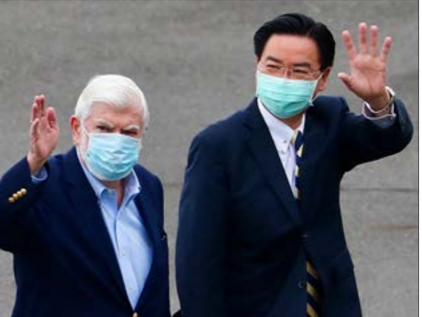
تؤكد بكين ان انشطتها حوله لتايوان تحمف له حماية السيادة الصينية

في خضمّ التوتّر المتصاعد بين الولايات المتحدة والصين، قرّرت إدارة الرئيس الأميركي، جو بايدن، إرسال وفد غير رسمي إلى تايوان، يتألف من مسؤولين أميركيين سابقين. في سياق التأكيد على دعمها لتايبيه في وجه بكين. ورداً على الخطوة الأميركية، أشارت الصين، على لسان الناطق باسم وزارة الخارجية، تشاو لي جيان، إلى «قواعد جديدة للاتصالات بين الولايات المتحدة وتايوان»، الذي أوضح أن ما جرى «يتجهل الالتزام السياسي المهمّ الذي قطعته الولايات المتحدة على نفسها في شأن قضية تايوان» في «البيانات المشتركة الخالفة» بين واشنطن وبكين، وهو مبدأ «صين واحدة»، معتبراً أن الأميركيين يعثون برسائل خاطئة إلى القوى الانفصالية الساعية إلى استقلال تايوان.