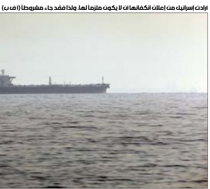
إرادت إسرائيل من إعلات انكفائها أن لا يكون ملزماً لها، ولذا فقد جاء، ملبوطاً

مواجهة أخرى. واضح أن الجانب الأميركي، الذي لمس أيضاً فشل المغاربة التي اشترك فيها مع إسرائيل وإن عبر السماح لها فقط بالاعتداء على «نطنز»، ساهم كذلك في الدفع نحو الإنكفاء الإسرائيلي البحري. اعتقدت واشنطن، كما تل أبيب، أن الضغط الأمني والعمليات التخريبية كفيلاً بإضعاف الموقف الإيراني التفاوضي، إلا أن ما لاح لهما كفرصة، تحول إلى تهديد، وهو ما جعل التهينة أكثر من ضرورية، أملاً بتقليص الخسارة الغلظضية، وتلافي مزيد من «الخروق» النووية الإيرانية. ومن هنا، اتخذت علامات التهينة الحربية إشارة إلى التهينة الأكبر، وإن لم تكن المواجهة في البحر، في ذاتها، جزءاً من «الحرب النووية»، نفسها، التي تصغر أمامها كثيراً أي تداعيات للاستهداف