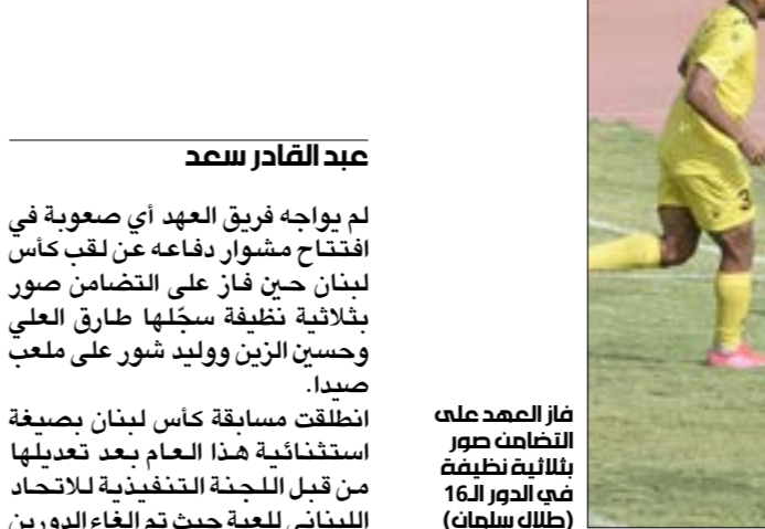
فاز العهد على التضامن صور بلعبة نظيفة

انطلقت المسابقة الثانية المحلية في كرة القدم، كأس لبنان، افتتحها العهد برسالة قوية مفادها الميت على الألب، حيث فاز بسهولة على التضامن صور 3-0، لتسكلم مباريات الدور ال16 اليوم وغداً