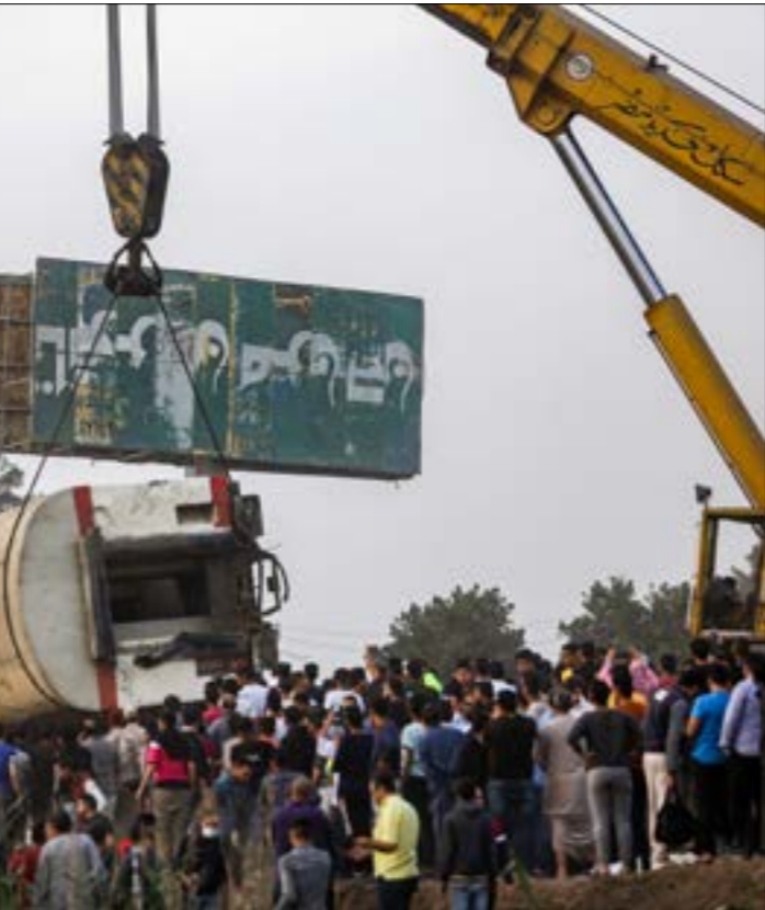
تقدّر حوادث القطارات في مصر بنحو ألف سنوا ما يبت صفر وكبير

بإظهار الأحدات التي تلت عزل الرئيس الراحل، محمد مرسي، من وجهة نظر الأمن. في المقابل، لم يطرح وزير النقل أيّ حلول، على رغم كثرة التعليمات الشفهية التي تُبلّغ للساقيين ولا تُقرّ في أوراق رسمية تجنّباً للمساءلة، ولا سيما في ما يتعلق بتشغيل القوات الأي للقطار، والذي يتسبّب في تاخير القطارات بالساعات نتيجة إجراءات السلامة الزائدة التي يتّبعها، ثمّ يُطلب من الساقيين إيقافه حتى تصل القطارات في مواعيدها، وهو الإجراء