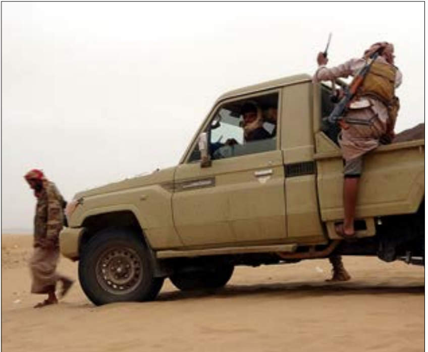
تحرّض القوات والفصائل الموالية لهادي على استمرار في القتال للحيولة دون سقوط مارب

وشهدت الأيام والساعات الماضية العديد من الإطلاات الإعلامية