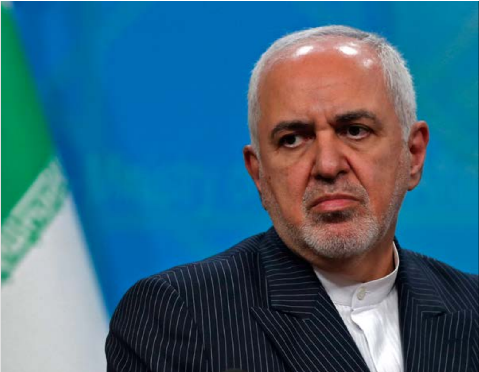
«ألي وزير الخارجية الإيراني أثناء الدبلوماسية (راحت ضحية، الميدان العسكري)

وكان الجزء الذي أثار الانتقادات، من ضمن تصريحاته، هو إقاؤه بالوم على دور الحرس الثوري، وعلى وجه التحديد الشهيد قاسم سليمانبي، القائد السابق لـ«فيلق القدس»، في طهران، موضحاً أن «روسيا وجَّهت