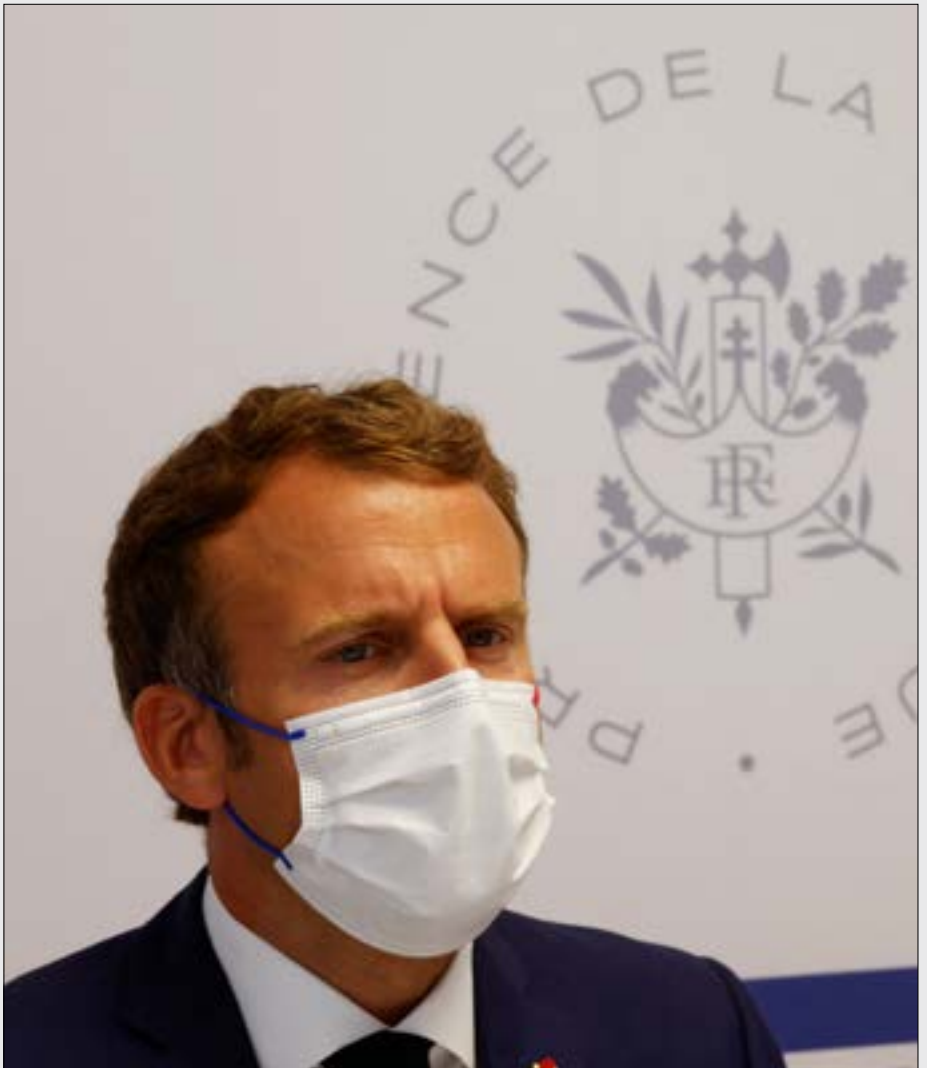
تتوالد حلقات مسلسل العنف الاجتماعي المتصاعد الذي رافق عهد ماكرون منذ عام 2017

لإتقاد «الجمهورية». إلا أن الرئيس الذي أعيد انتخابه في «Haut de France» كزافييه برتراند، انتقل إلى المرتبة الثالثة قبل أقل من تسعة أشهر على الانتخابات، بعد حصوله على 18% من نوايا التصويت. وبحسب الدراسة، فإن لوين ستخسر في جولة الإعادة أمام ماكرون وبرتراند. وفي حالة التقاء الرجلين في الجولة الثانية، سيتقلب برتراند على ماكرون (52% مقابل 48%). من ناحية أخرى، يعكس استطلاع المعهد الفرنسي ضعف اليسار؛ إذ إن حظوظ مرشحيه في أي من الترشحات التي تمّ اختيارها، لم تتجاوز الـ10% من نوايا التصويت. ومع ذلك، تُسجّل نقطة تحول مع تراجع زعيم حزب «فرنسا الأبيّة» جان لوك ميلانشون (7%-، 4 نقاط). يمكن أن تعود بالنفع جزئيًا على اليمين العام لـ«الحزب الشيوعي» الفرنسي، فابيان روسيل. ومن الآن فصاعدًا، أصبح ميلانشون، أن هيدالغو، ويانك جادو، على مستوى مماثل من نوايا التصويت. ويكشف المرشح يانك جادو، في مقالة له في «لوموند» نُشرت في نيسان الماضي، عن مواقفه العدائية في السياسة الخارجية، واليمينية أكثر من مواقف ماكرون، إذ تعتبر أن «العدوانية المتزايدة» من جانب «الأنظمة الاستبدادية» في الصين وروسيا وتركيا «يجب أن تصبح أحد المواضيع الرئيسية للانتخابات الرئاسية لعام 2022»، داعيًا أوروبا إلى تشكيل «جبهة موحدة» للعمل ضدّ هذه «الأنظمة الاستفزازية» التي يحفلها بمسؤولية «نشر الأخبار الكاذبة»، و«زعزعة استقرار» الجوار الأوروبي، والهجمات الإلكترونية.