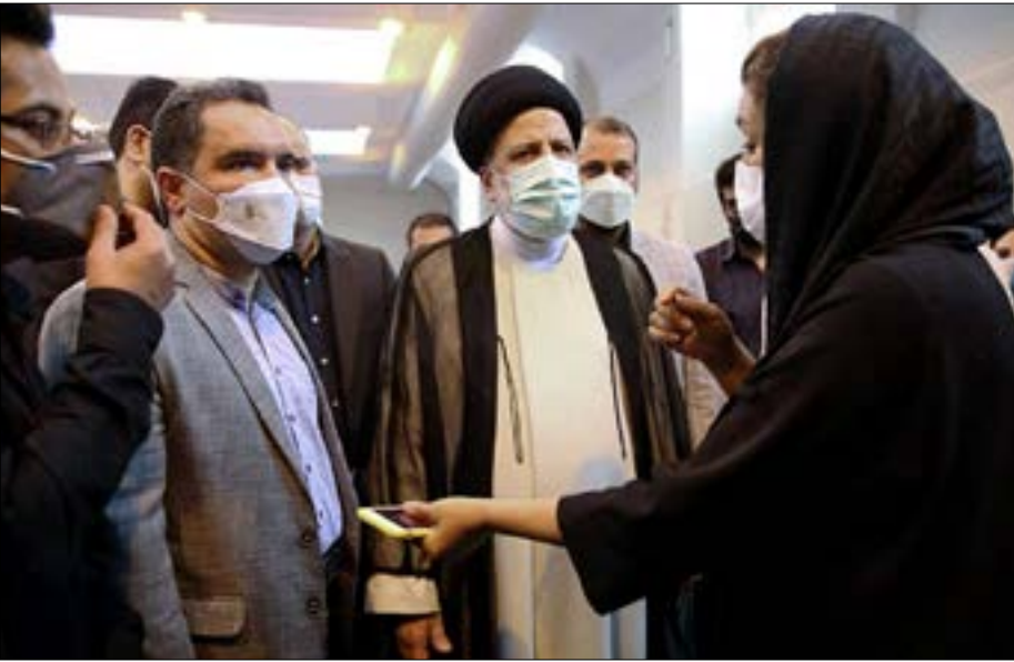
بدأ لافتاً اختيار رئيسي عددا من الوزراء وكبار مدراء حكومة أحمددي نجاد

قَدَمَ الرئيس الإيراني، إبراهيم رئيسي، أوّل من أمس، مرشحيه الـ19 لشغل المقائب الوزارية إلى البرلمان لنيل الثقة. وبدأ لافتاً في هذه التشكيلة الوزارية المُقترحة حضور عدد من الوزراء وكبار مدراء حكومة الرئيس الإيراني الأسبق، محمود أحمددي نجاد، إلى جانب شخصيات تابعة لهـالحرس الثوري». وأعلن الناطق باسم الهيئة الرئاسية للبرلمان، نظام الدين موسوي، أنه سيتمّ البثّ في أهليّة الوزراء المرشحين في اللجان التخصّصية النيابية. وذلك بعد الإعلان رسمياً عن تسلّم البرلمان قائمة أسماء الوزراء المقترحين يوم غد السبت (14 آب). على أنّ تبدأ جلسات منح الثقة اعتباراً من هذا التاريخ. وأفاد موسوي بأن في إمكان رئيس الجمهورية إدخال تغييرات على هذه القائمة في حال أراد ذلك. حتى قبل الإعلان عن تسلمها من قِبَل البرلمان. وبدأ رئيسي،