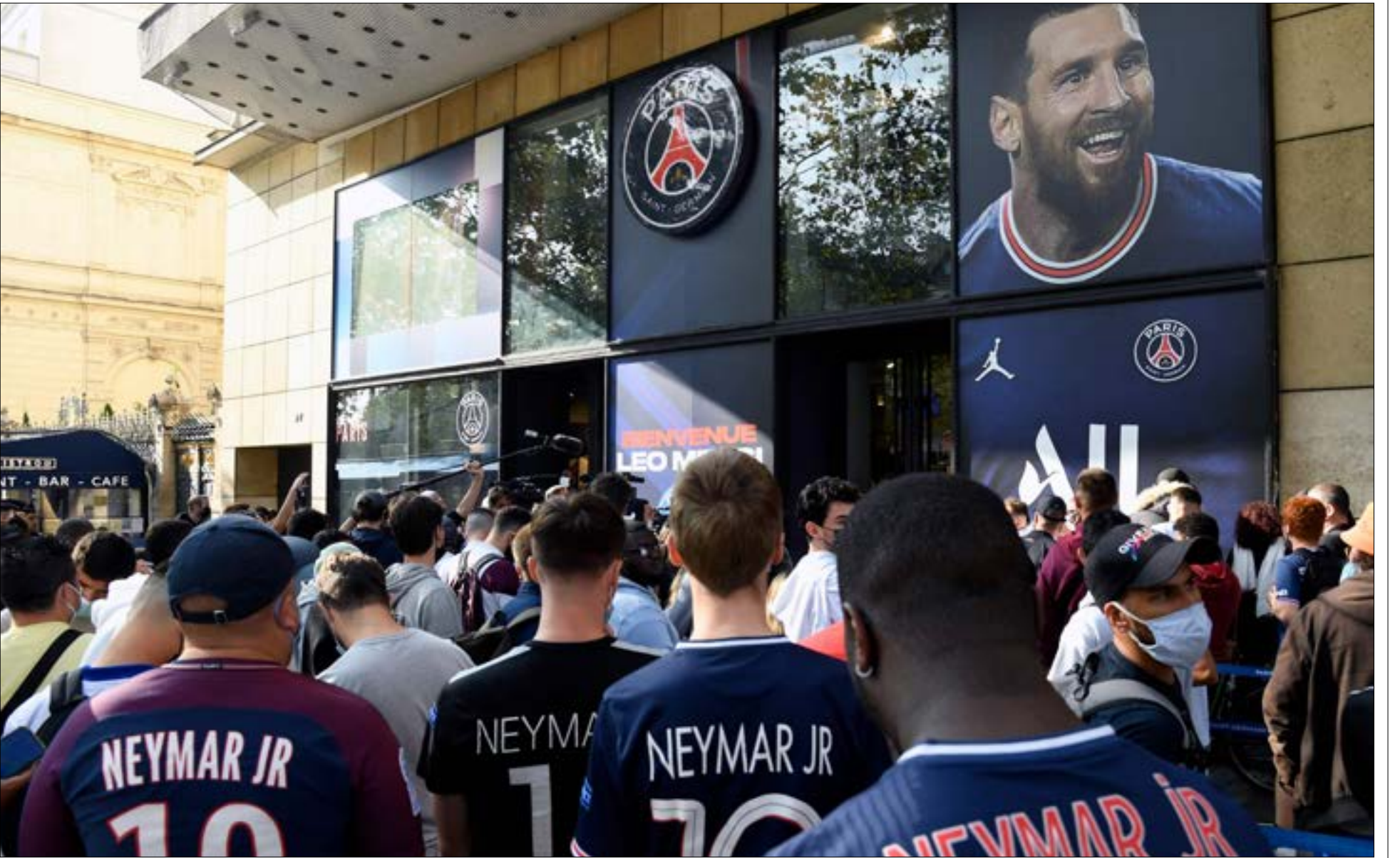
20 دقيقة كانت كافية لكي يمتد الطوابير امام متاجر نادي باريس سان جيرمان إلى مسافة كيلومترات عدة

ببساطة إذا كان شعار برشلونة الأزلي «أكثر من مجرد ناو»، فقد تاكد المؤكد بأن ميسي أكثر من مجرد لاعب كرة قدم، وأرقام الحدث الضخم تختصر القصة كلها.