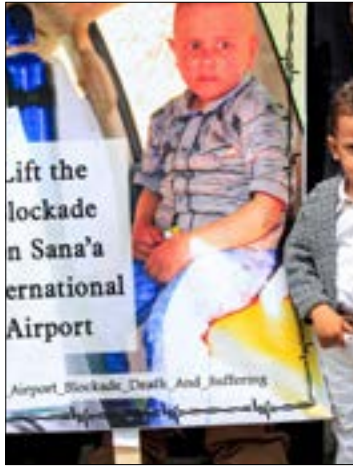
نموه بريطانيا حقيقة انخرطها في العدوان بالأساليب المضلّة نفسها التي أعادت استخدامها