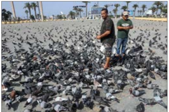
برض حفتر الصلح تحت لواء المجلس الرئاسي، مفضلاً التطار الانتخابات الرئاسية (أب ب)

استمرار الخلاف حول تفاصيل بعض القواعد، التي سيُعقد الاجتماع المقبل في شأنها في طرابلس أو جنيف، بحضور جميع الأعضاء. وأشار مصدر شارك في الاجتماع، في حديث إلى «الخبير» إلى أنّ الهيئة الاممية جازّة في الخروج بقاعدة دستورية من جانب أعضاء «ملتقى الحوار»، وهو ما يجعلها تستعجل عقد الاجتماع المباشر المقبل، مع إمكانية إجراء بعض التعديلات، استناداً إلى المناقشات التي أجريت الأربعاء، في محاولة لتقليل هوة الاختلافات بين مختلف الأطراف،