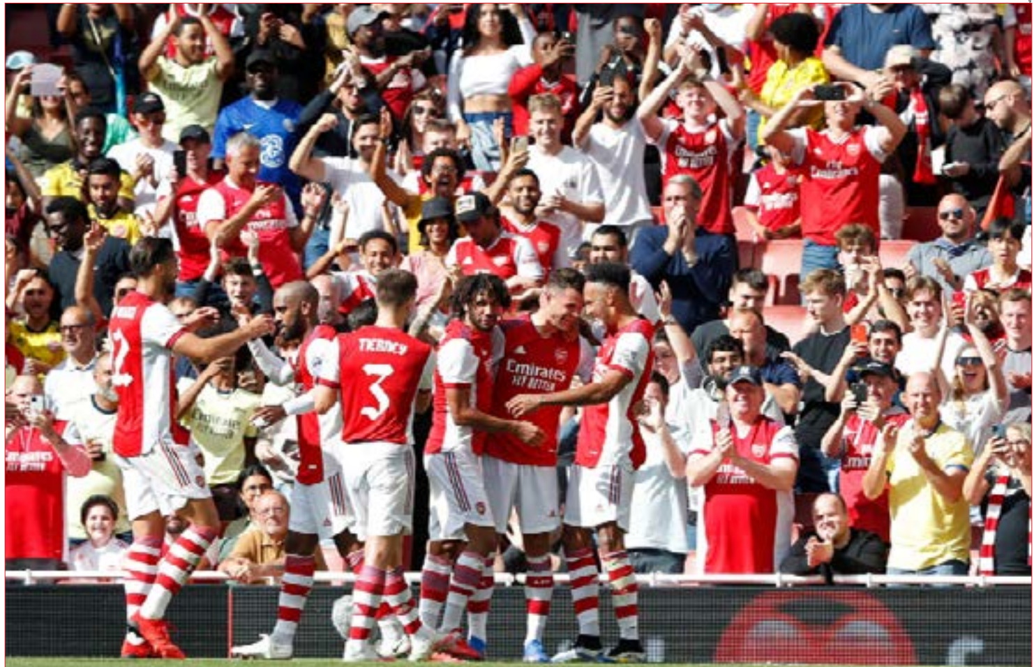
يُفتتح الدوري الإنكليزي اليوم بلقاء برينتفورد وضييفه أرسنال

وقعهم في العائدات التي عادت بارياح كبيرة على النادي، أمثال الإنكليزي ديفيد بيكام والسويدي زلاتان إبراهيموفيتش وبعدهما البرازيلي نيمار. لكن رغم ارتفاع سعر القميص والطلب الهائل على النسخة الأساسية (الزرقاء) منه، فقد أيضاً القميص الأبيض في ظرف 20 دقيقة بعد طرحه في كل متاجر النادي في باريس، ليعود إلى الأذهان مشهد الأرياح السريعة التي حققها يوفنتوس الإيطالي عند تعاقد مع النجم الآخر البرتغالي كريستيانو رونالدو قبل 3 أعوام حيث باع قمصانه بقيمة 60 مليون دولار أميركي خلال 24 ساعة فقط.