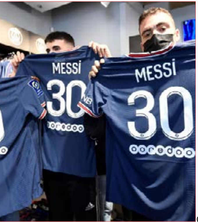
(أ ف ب)

كعنوان للحدث. هنا في لبنان «طوابير الذك» تنقل كامل المواطنين الذين يبحثون عن رخيغ خبز ودواء ومحروقات وغيرها. بينما هناك في باريس يقف الفرنسيون في «طوابير الفرخ» القادم من العاصمة بهدف الحصول على القميص الذي يحمل اسمه في مشهد يعكس مدى الأرباح التي سيحققها النادي الباريسي ويكشف أيضاً عن مدى الخسائر المالية التي سيعمرها برشلونة