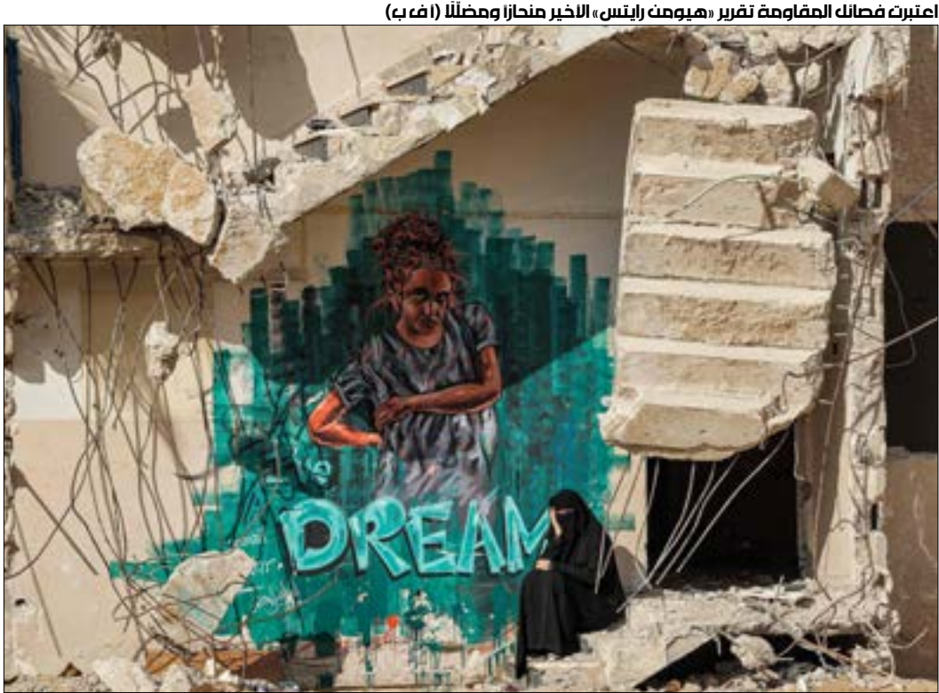
اعتبرت فصائل المقاومة تقرير «هيومن رايتس» الأخير منازراً ومضلاً

خاض قبل ذلك حالة كفاحية كبيرة كان أحد أهدافها كسر الحصار». وكانت المقاومة أبلغت الوسيط المصري، وفق ما علمته «الأخبار» من مصادر فصائلية عقب انتهاء