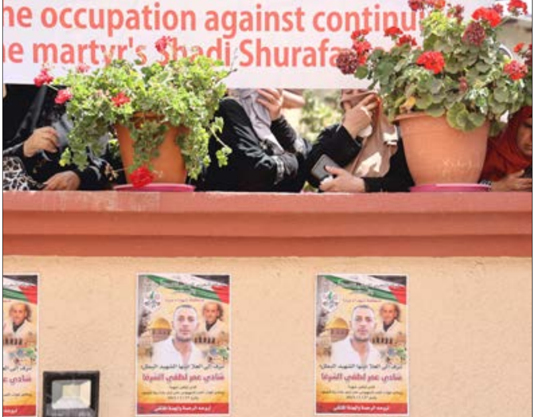
تعتقد واشنتن ان صرف اموال عوائل الشهداء والأسرى يشجّع الفلسطينيين على الاستمرار في المقاومة

الإموال يشجّع الفلسطينيين على الاستمرار في مقاومة الاحتلال وتنفيذ عمليات فدائية ضدّه. كذلك، تناول اللقاء مستقبل السلطة خلال السنوات المقبلة، وضرورة ترتيب أوضاعها الداخلية بحيث لا تكون المرخرة زيادته لمصلحة الأجهزة الأمنية في الضفة الغربية - بعد إجراء الأخيرة تعديلات على رواتب الأسرى والشهداء، بما يؤذي إلى تقليصها، على اعتبار أن واشنتن وتل ابيب تعتقدان أن صرف هذه