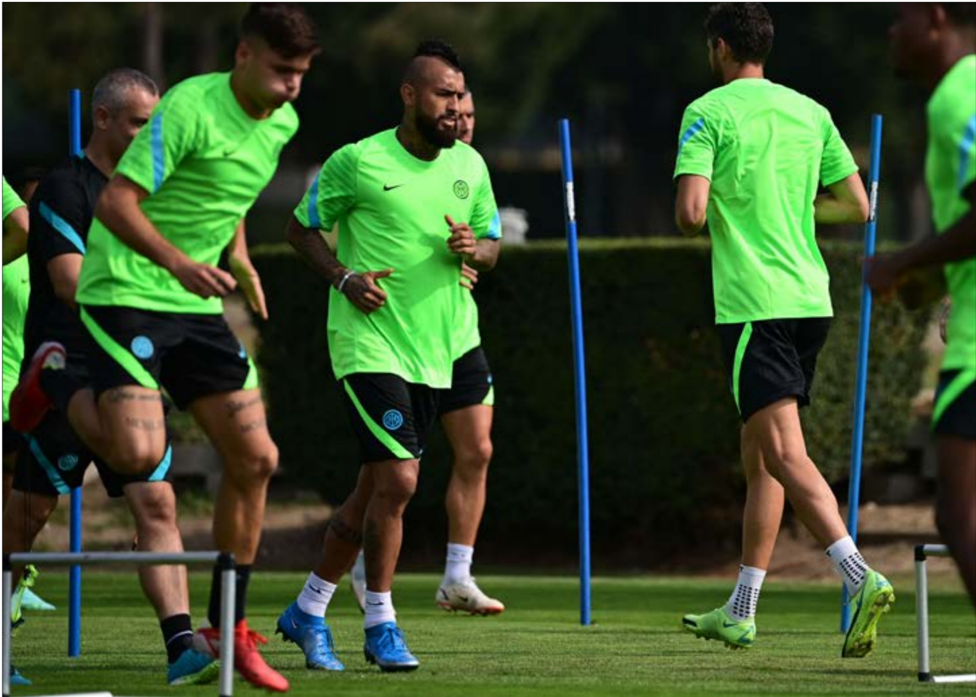
تدريبات إنتر تحضيرا للمباراة (أ ف ب)

أما بالنسبة إلى كالياري، فبعدما بدأ الدوري بالتعاون ضد سيسينا (2-2)، ميلان والتوجه إليه بكلمات تهديد. فيما عاقبته مباراة ثانية لنيله بطاقة حمراء، بعد اعتراضه على قرار الحكم بكلمات لزميله فيديريكو ديماركو الذي غادر مباراة الفريق الأخيرة باكراً بعد معاناته من تقلص عضلي.