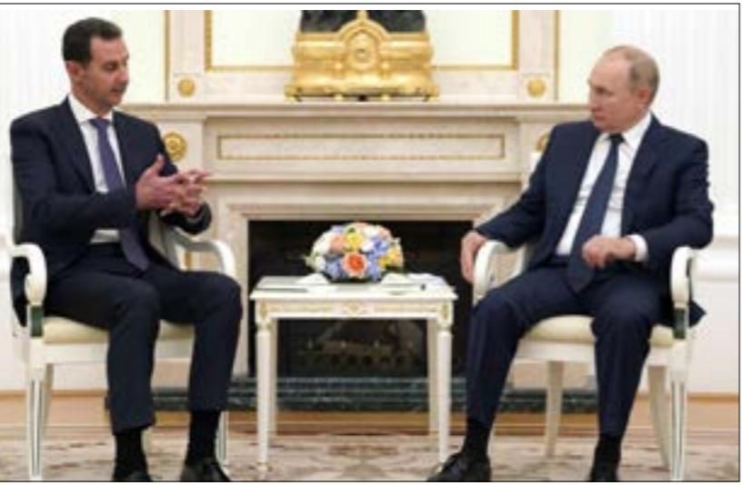
اعبر روبين ان وجود القوات الجوية بضمّ السلطات من بذه اقصد الجمهور لتبرز وحدة سوريا

لم تدكّ تظهر بوادر قرب إقفال ملفّ المنطقة الجنوبية مع بدء تطبيق الاتفاق المتعلّق بمدينة درعا، حتّى توجّهت الأنظار إلى إدلب، التي عاشت خلال الأشهر الماضية حالة سكون عسكري وميداني، مقرون بنشاط سياسي على المستويين الإقليمي والدولي. وتقدّمت طائرات عسكرية سلسلة استهدافات طالت مواقع سيطرة الفصائل المسلّحة في منطقة جبل الزاوية، بالتزامن مع خروقات شهدتها هذه المنطقة من قبل «هيئة تحرير الشام»، حيث أعلن «مركز المصالحة الروسي» في سوريا أن «الهيئة» نفّذت حتى يوم السبت الماضي 29 قرحاً في مواقع «خفض التصعيد». واللافت في التطوّرات الجديدة، التحرك العسكري السوري العبدّي على نخوم طريق «M4»