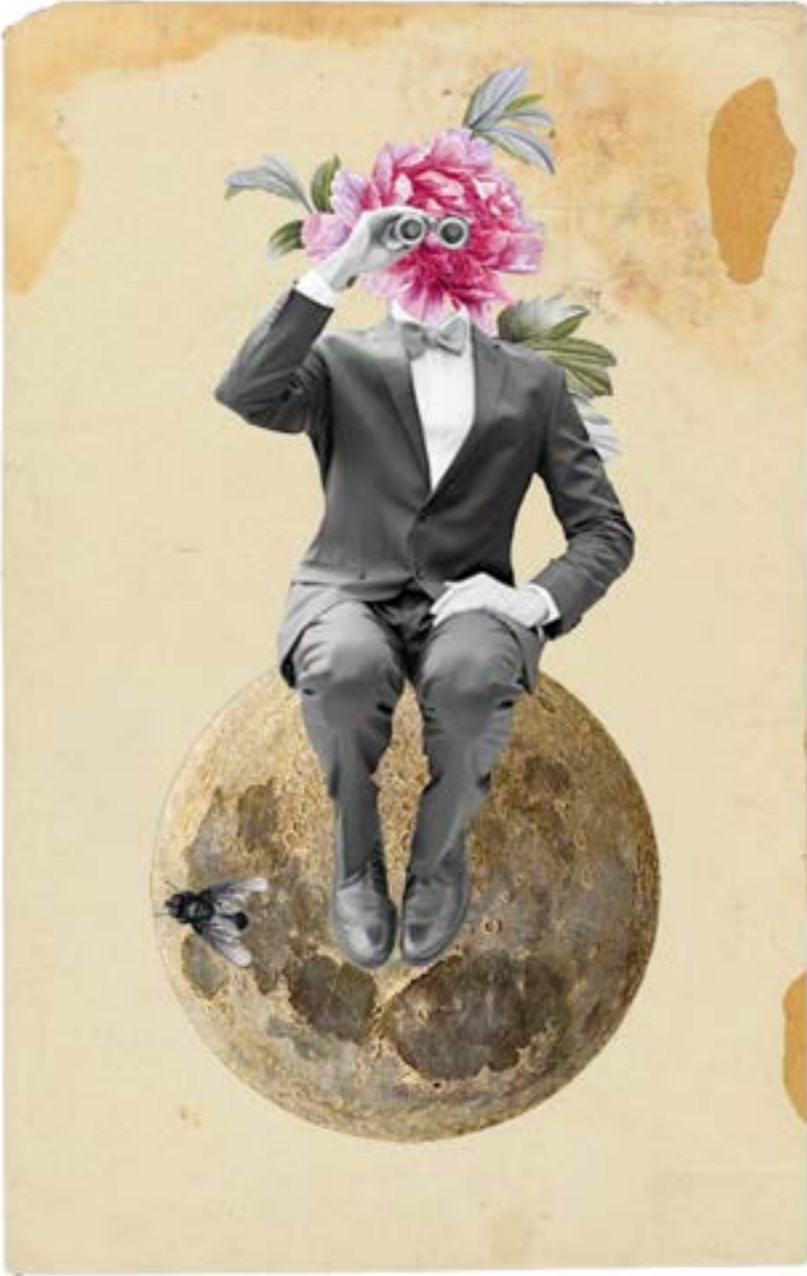
فالحيدار سترمبرلر (ألمانيا)

وإذا كان لنا أن نستخلص هنا، فالخلاصة الأساس التي لا تشوبها شائبة من هذا كانت لها آثار كبرى على مجريات الحرب الباردة في أفغانستان، حتى إذا ما لاحت نباشير «الحصاد» كان القرار الأميركي بتفعيل محور جديد داعم للمواجهة كانت السعودية تمثل فيه أيضاً عموداً فكرياً. في 13 كانون الأول/ ديسمبر من عام 1985 لا بد لها وأن تكشف، في سياق تجربتها