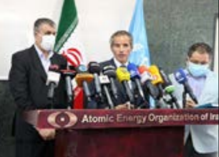
مدير عام الوكالة الدولية للطاقة الذرية، خلال زيارته طهران قبل أيام

أيضاً من القضايا الخلافية المهمة، التي لم يتمّ التوصل إلى الآن إلى آلية لتسويتها. وفي كلمته الافتتاحية في اجتماع مجلس الحكّام، جدّد غروسي الإعراب عن قلقه من وجود مؤادّ نووية في أربعة مواقع إيرانية، وقال إن طهران لم تردّ، إلى الآن، على تساؤلات الوكالة بشأن هذه المواد، لكن بما أن سياسة إيران مبنية على ديمومة التعاون مع الوكالة، والحيولة دون إعادة ملئها النووي إلى مجلس الأمن الدولي، فقد يكون ذلك دافعاً لتوصّل إلى إطار في المحادثات اللاحقة، لتسوية هذا الخلاف. ومن شأن الاتفاق الأخير بين إيران والوكالة، والذي ساهم في الحدّ من التوتر، أن يهيئّ لبدء جولة جديدة من المحادثات النووية، كان مسؤولو الإدارة الجديدة في إيران، أكدوا، مراراً وتكراراً، أنهم لا يعارضون الانخراط فيها، بيد أنهم لا يقبلون بها تحت الضغط، مشددين على ضرورة أن تكفل مصالح الجمهورية الإسلامية، ويبدو أن الإدارة الجديدة تجهّز نفسها للجولة السابعة من المحادثات، وهو ما أوحى به إعلان وزير الخارجية حسين أمير عبد المهيان، في مكالمة هاتفية مع نظيره البريطاني دومينيك راب، «أننا تجري مشاورات داخلية بشأن كيفية مواصلة المحادثات النووية»، مضيفاً «(أننا) نرحّب بأيّ مفاوضات تثرم عن نتائج وتحقّق مصالح الشعب الإيراني»، وتعبيراً على ذلك، رأت صحيفة «جوان» المقريّة من الحرس الثوري، أن الاتفاق الأخير «يُظهر حسن نيات طهران في المحادثات النووية»، معتبرة أن «الإدارة الجديدة، والتي تمصّر على تحقيق نتائج ملموسة في المحادثات، ستترقب، على الأرجح، لتعرف مدى الخطوة الأولى التابعة من حسن نيّتها، ومن ثمّ ستخترط في مفاوضات فيينا».