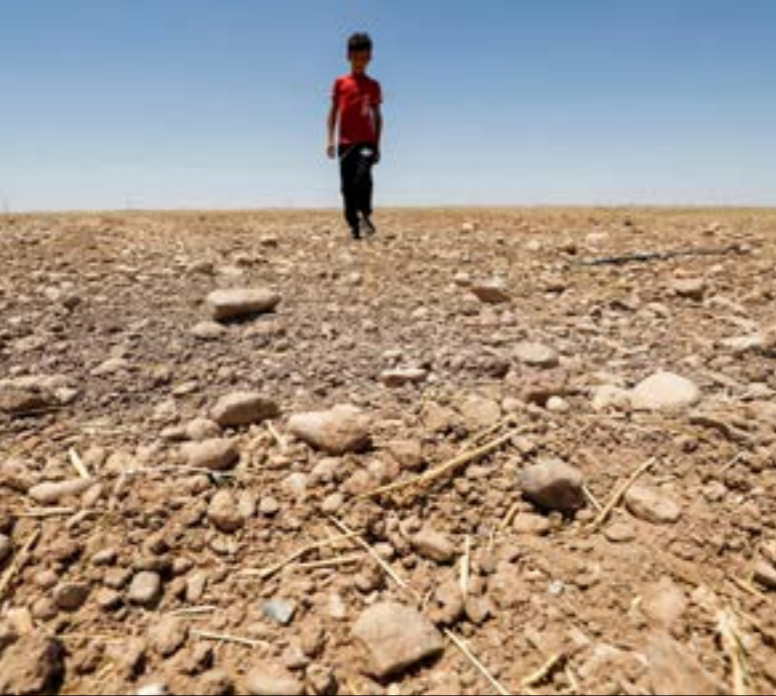
هاكرون يمتدّد ان العراق اصبح بعد عقود من الاضطراب والوهن، جازراً لاستقراء الترسبيات

السياسية العراقية، وإيضاً بين القوى الإقليمية والعالمية، من مثل إيران والسعودية اللتين يجري التفاوض بينهما في العراق بوساطته شخصياً، ولربما يؤهله دوره هذا للحلفاء الإقليميين بعلاقات طيبة مع كل القوى داخل «البيت الشيعي»، بما فيها المرجعيات الدينية، ورئيس الوزراء مصطفى الكاظمي الذي نجح في أن يشكّل نقطة تقاطع بين القوى