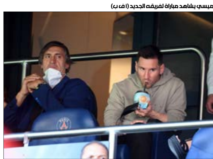
ميسي يشاهد مباراة لفرصة الجديد

تتعلق بانتقال ميسي إلى باريس سان جيرمان، وبعض التفاصيل التي تُكشف للمرة الأولى. وفي هذا الإطار قال أحد المقربين من رئيس نادي برشلونة الجديد خوان لايبورتا، وهو جاسمي روريس لصحيفة «سبورت» الكتالونية إن «الوضع في برشلونة أسوأ مما يتخيله أي شخص. الأمور ليست سهلة على الإطلاق»، وأضاف في