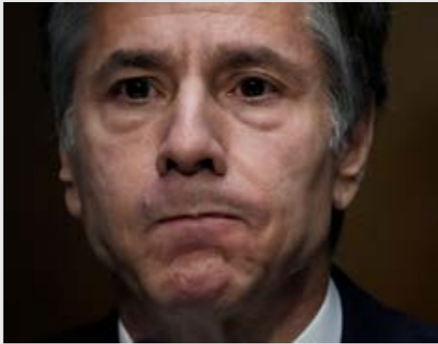
كثف الجمهورون هجماتهم خلال الجلسة التي استمرت خمس ساعات

كشفت الإدارة الأميركية على لسات وزير خارجيتها أنتوني بلينكن، العالم نتجر أي خطة للإنسحاب من أفغانستان، بل ركزت إلى دونالد ترامب قد ضربها مع حركة «طالبان» إياها توقيع الاتفاقيات بينها، وبالتالي مع ذلك، سعه البيت الأبيض إلى غسل يديه من مال الوضع في هذا البلد الذي تركته الولايات المتحدة على الحالة التي كانت عليها يوم دخلته للإطاحة «الحكم الطالباني»