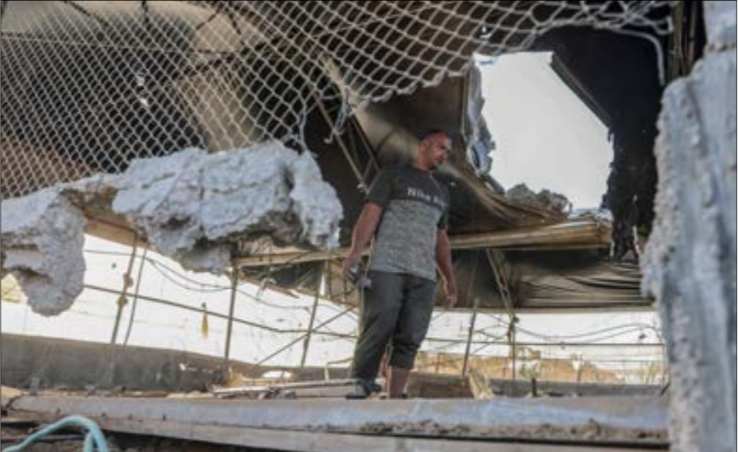
تتمكّن المرحلة الأولى من الخطة الإسرائيلية في إعادة إعمار القطاع وتأهيل البنية التحتية

لغزة وأشار لايبد إلى أن مقترحه يهدف إلى «خلق الاستقرار والهدوء على جانبي الحدود، أمنياً وسياسياً ومدنياً واقتصادياً، غير أن ذلك لا يعني التفاوض مع حركة حماس، لأن إسرائيل لا يمكن أن تمنح جوائز لمنظمة إرهابية، وتساهم في إضعاف السلطة الفلسطينية»، التي أكد أنها «تعمل معنا بانتظام»، متعهداً تسليها الإدارة الاقتصادية والمدنية لغزة، ولغت إلى أن جولات القتال المتكررة في القطاع أدت إلى تآكل قدرة