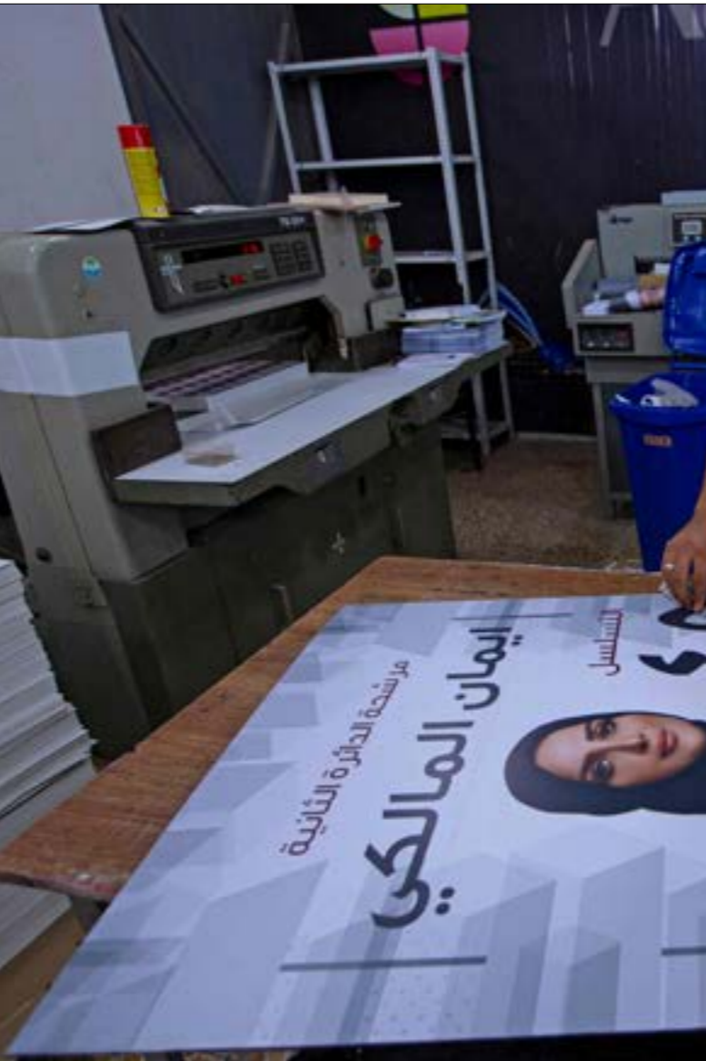
«الحشد الشيعي»، يعاني بعض المشكلات، نتيجة التناقص بين فصائله من جهة، وبين قاداته على منصب رئيس الوزراء من جهة ثانية

طرف دون آخر داخل هذا البيت، من مثل مساعدة أحدهم عبر نقل تجارب الماكينات الانتخابية إليه، ففي ظلّ المناهضة للاحتلال، أقله في ما يتعلق بالسياسات الداخلية العراقية، وعلاقات بغداد بالدول المحيطة بها، ولا سيما إيران والسعودية، ولو ظلّ الصدر على مقاطعته للانتخابات، لكن سيستخدم الشارع بدلاً من المؤسسات الدستورية وسيلة للضغط باتجاه التأثير في سياسات البلاد، وهو ما سيؤذي بدوره إلى إثارة مزيد من المشاتلات التي لا يجد المعنويون بالأوضاع العراقية مبرراً لها، ما دام الاحتلال سينسحب، ونظرًا إلى التناقص الكبير داخل «البيت الشيعي» نفسه، خاصة على موقع رئاسة الوزراء، يحاذر الحلفاء الإقليميون للعراق، ولا سيما «حزب الله» الذي تربطه علاقة جيّدة بمعظم القوى السياسية العراقية، الوقوف مع