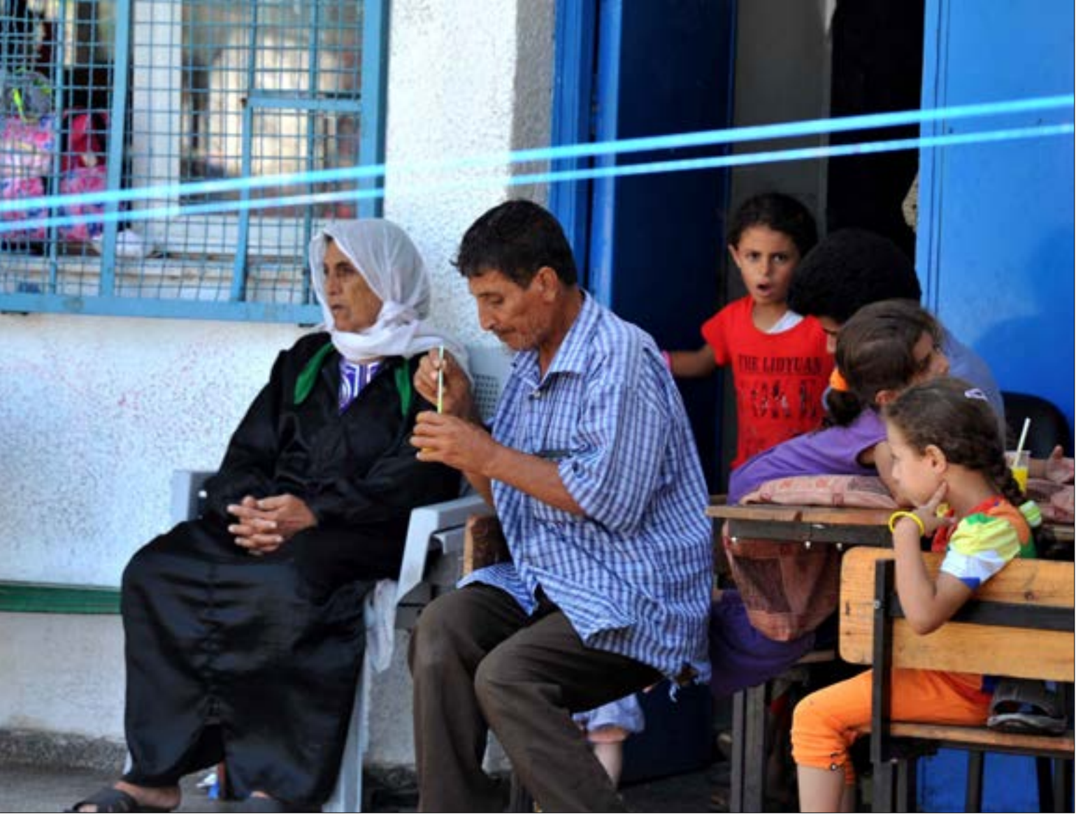
تعاني الوكالة من عجز مالي كبير يزيد عن 755 من إجمالي موازنات الطوارئ، التي تقدّر بـ713 مليون دولار