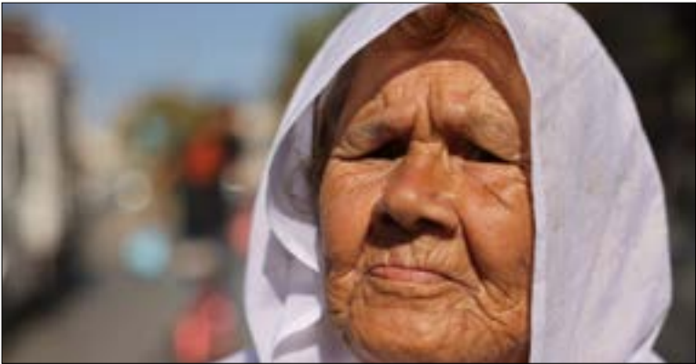
بلغ عدد اللاجئين حوالي 5,7 ملايين في مختلف دول العالم

بعد 73 عاماً من نكبة الشعب الفلسطيني، باتت «وكالة غوث وتشغيل اللاجئين» سنويًا، إضافة إلى تقديم الخدمات الصحية للاجئين في عياداتها ـ التي تُسجّل 9 ملايين والشاهد على واحد من أبرز وجوه الحق الفلسطيني، ولتتمثّل في عودة اللاجئين إلى ديارهم التي هُجّروا منها، علماً أن عدد هؤلاء يقارب 5.7 ملايين في مختلف دول العالم، غزّة أكبر تجمّع للاجئين الفلسطينيين. إن حوالي 64% من مجمل سكّانه لاجئون، ويعيش في القطاع حوالي 1.9 مليون نسمة، منهم 1.4 مليون من فلسطين يقطن 800 ألف من بينهم داخل المخيمات. وتصل نسبة الفقر بين اللاجئين الفلسطينيين في مختلف مناطق وجودهم إلى 41%، لكنها في غزّة فاقت 65% خلال عام 2021، مقارنة بما كانت وقراه التي هُجّر منها عامي 1948 و1967. ومن هنا، باتت راسخًا لدى الفلسطينيين أن أيّ مشروعات تُطرح لإنهاء، عمل «الأونروا» قبل حلّ القضية الفلسطينية، إنما تستهدف توطين اللاجئين في الدول التي يوجدون فيها، وهو ما تسعى إليه دولة الاحتلال للتخلّص من أهمّ ثوابت القضية الفلسطينية، وللمتمثّل في حق العودة.