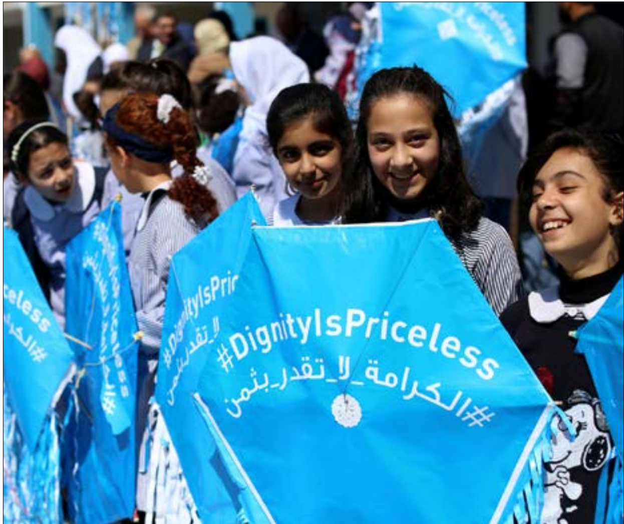
استأنفت الولايات المتحدة تمويل «الأونروا» بشكل جزئي ببلغ قدره 150 مليون دولار

الوكالة بفعل سياسة التضيق التي انتهجها بحقها الرئيس السابق دونالد ترامب، ضمن سياق العمل على تصفيتها وإنهاء عملها، إلا أن الفصائل الفلسطينية تؤكد رفضها الإطار المعمول به حالياً وقّع الطرفان قبل فترة قصيرة، اتفاق إطار يتيح لواشنطن التدخل في إدارة الوكالة وعملها بدعوى ضمان «حيادها»، وهو ما يعني سيطرة أميركية ناعمة على المساعدات والخدمات التي تُقدّم للاجئين، ومعاينة أولئك الذين يعملون لصلة المقاومة أو يُنظر إليهم على أنهم على علاقة بها. وكانت الولايات المتحدة أعلنت، مع نهاية نيسان الماضي، استئناف تمويل «الأونروا» بشكل جزئي ببلغ قدره 150 مليون دولار، وبعد قرابة أربعة أشهر أعلنت عن تبرّع إضافي بقيمة 135 مليون دولار، إلا أن المبلغ الأخير لم يُمرّر إلا بعد اتفاق بين الطرفين يقضي بالترامز الوكالة بـ«المبادئ الإنسانية» لإدامة المندحة وعلى رأسها الحياد، ومراقبة مدى تطبيق هذا الالتزام في الخدمات والمستفيدين والموظفين، بالإضافة إلى بنود أخرى، وأثار الاتفاق المتكور حفيظة الفلسطينيين الذين رأوا أنه سيسمح بتدخل الولايات المتحدة في عمل «الأونروا» التي يُفترض أنها تتمتع بحرية في اختيار أنشطتها وعملها الذي يخدم اللاجئين في مجالات الصحة والتعليم والإغاثة والأعمال. ومع أن الدعم الأميركي خفّ، بالفعل، من حجم الضائقة المالية التي عانتها