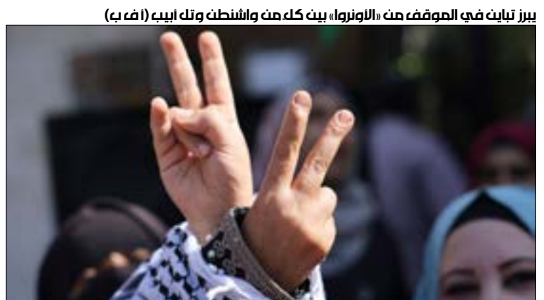
بيرز تباين في الموقف من «الأونروا» بين كل من واشنطن وتل أبيب

انطلاقاً من تلك السردية الإسرائيلية، يبرز تباين في الموقف من «الأونروا» بين كلّ من واشنطن وتل أبيب، من دون أن يعني ذلك إمكانية الإصرار بالأخيرة، إذ تنظر الولايات المتحدة إلى الوكالة من منظور المصلحة المشخّصة في الإقليم بمرتكباته وتعدّياته، وفقاً للسياسات والاهداف الأميركية الكبرى في المنطقة، الأمر الذي يفسّر تمسك الإدارات الأميركية المتعاقبة ببقاء «الأونروا» على رغم التحفظ الإسرائيلي. أمّا قطع التمويل عنها في عهد إدارة دونالد ترامب السابقة، فجاء نتيجة تغليب نظرة طموحة ومتطوّرة في شأن إمكانية إنهاء القضية الفلسطينية، عبر الدفع في اتجاه تطبيع العلاقات مع الدول العبرية بمزعل عن الفلسطينيين أنفسهم، وطالما أنه ثبت فشل هذه الرؤية، فكان لزاماً على الإدارة الجديدة العودة إلى تموضع ما قبل سياسات ترامب، مع التمسك بما يُعدّ إنجازاً حقّقهُ الأخير، كما هو حال الاعتراف بالقدس عاصمةً لإسرائيل، فيما تبقى «الأونروا» أداة تمكين وضغط أميركيّين في الملعب الفلسطيني باختصار، تمثّل الوكالة أداة، سواء من ناحية واشنطن أو تل أبيب، مع تباين في ما يمكن التوصل إليه عبرها، وإذ عمدت الإدارة السابقة إلى استغلالها للضغط على الفلسطينيين وفرض الإرادة الإسرائيلية عليهم وفشلت، فإن الإدارة الحالية لم تجد بداً من استرداد تلك الأداة، ومعاودة العمل على تحقيق الهمة المرسومة لها، وفقاً للسياسات الأميركية الموضوعة للوكالة، وفي ذلك حديث آخر يطول