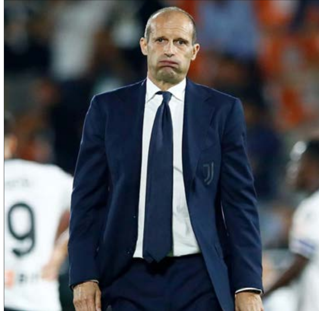
يعاني يوفنتوس الكثير من المشكلات الفنية والادارية

يعاني يوفنتوس المرهبة هذا الموسم. انتصاراً واحداً من خمس مباريات في الدوري المحلي يعكس مدى صعوبة الأمور بالنسبة للمدرب الجديد. القديم ماسيميليانو أليغري، الذي وجد نفسه وسط فوضى عارضة فور عودته لقيادة «البياكونيري». النادي في حالة يرثى لها وهو بحاجة لإعادة الهيكلة إذا ما أراد العودة إلى القمة مجدداً