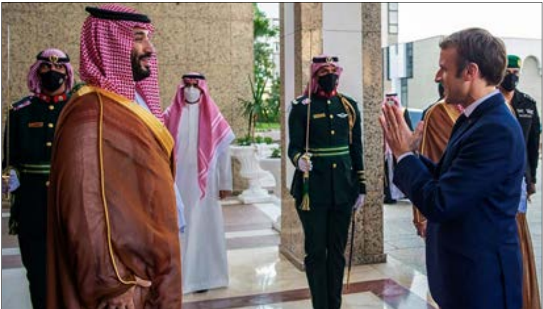
في حسان حزب الله ان البيان الفرنسي، السعودي اخبر باريس عن حياهما (ا ف ب)

البيان المشترك يتناول كل ما يشير الى مجمل أزمة النظام اللبناني وموقع الدولة وهزأ لها، وانهارها الوشيك. بذلك يسانّ البيان، والمقصود منه تطبيع العلاقات اللبنانية - السعودية بوساطة فرنسية، انه يرسم سقفاً لكل ما تعدّه المملكة شرطاً لعودتها الى لبنان، ووجّه من دون ان يسمّي اصابع الاتهام الى حزب الله.