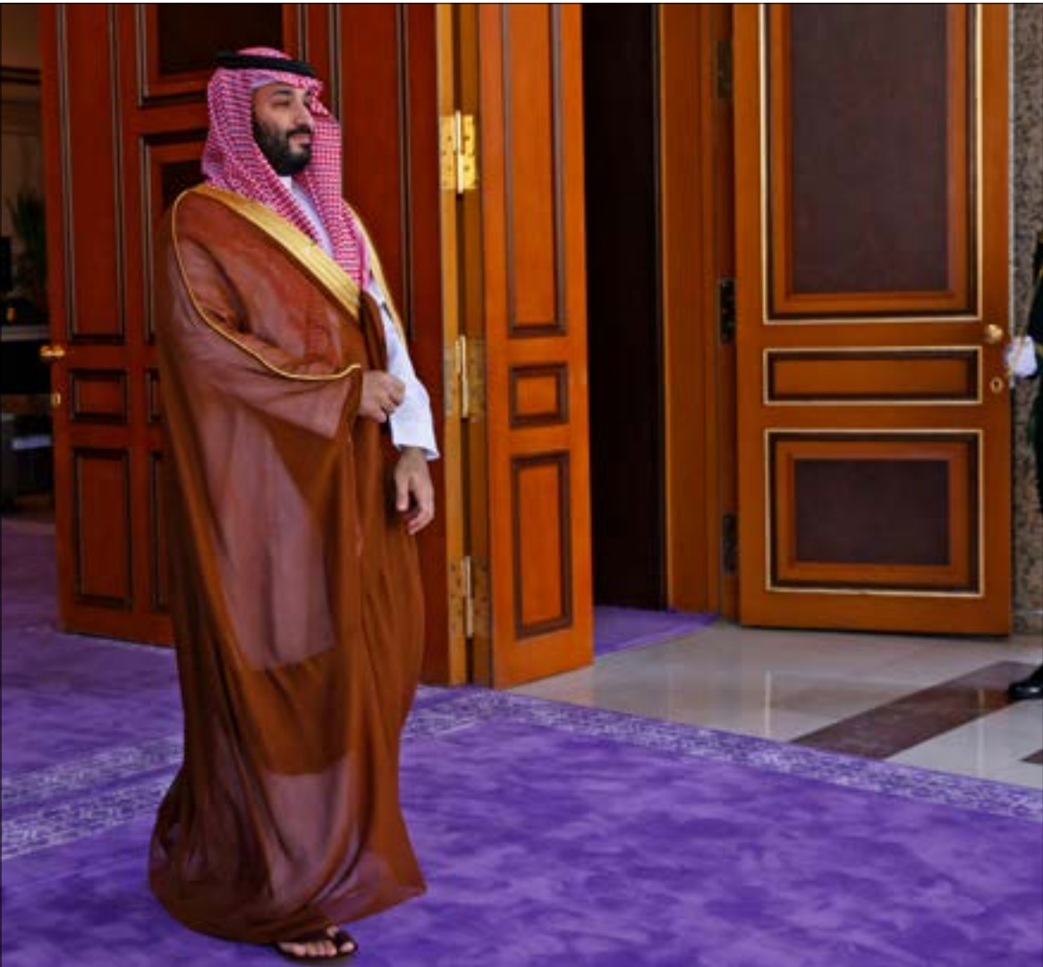
نقم المؤسسات تحت سلطة صاحب القرار سواء محمد بن سلمان نفسه، أو أحد القلّة من أعضاء دائرته المقرّبة (ف ب)

أقطاب العائلة الحاكمة انعكاسات على طبيعة انقسام التيارات الشعبية وتفاعلها مع المؤسسة/ العائلة، وسقف الحريات، والية اتخاذ القرار في الديوان الملكي نفسه. بيد أن عملية تصفية مراكز القوى، التي قام بها ابن سلمان، وضعت حدّاً لكل ما صعود ولي العهد الحالي محمد بن سلمان، وفق ما ظهر بشكله الأكثر فجاجة عقب مقتل الصحافي جمال خاشقجي. كذلك، تعكس الوثيقة التخطيط الداخلي في مؤسسات الحُكم الصورية المتمثلة في الديوان الملكي؛ إذ يجمع المركز، الذي يتبع تنظيمياً للديوان، بين نقّضين: الأول، محاولة إصلاح مؤسسات الدولة وتحديثها، وماسسة البيات اتخاذ القرار بحيث تصبح أكثر عقلانية؛ والثاني، على النقيض من هذه الماسسة، التداخل بين صاحب القرار والمؤسسات نفسها، بحيث تقع الأخيرة مباشرة، لأسباب تتعلّق بضمان الولاء، تحت سلطة الأول، سواء كان محمد بن سلمان نفسه أو أحد القلّة من أعضاء دائرته المقرّبة. والجدير ذكره، هنا، أن رئيس مجلس إدارة «مركز دعم اتخاذ القرار»، هو ياسر الرميان، الذي يشغل في الآن نفسه مناصب رئيسة عديدة أخرى في الدولة، تتحدّد من رئاسة صندوق الاستثمارات العامة ومجلس إدارة شركة «رامكو»، وصولاً إلى «الاتحاد السعودي لرياضة الغولف». هذا التناقض، وإن لم يكن جديداً على الية عمل مؤسسات الدولة السعودية، إلاّ أنه تكاد يمثل السمة الأبرز للعهد «السلامي». تاريخياً، كانت لتوزيع مؤسسات الحُكم بين