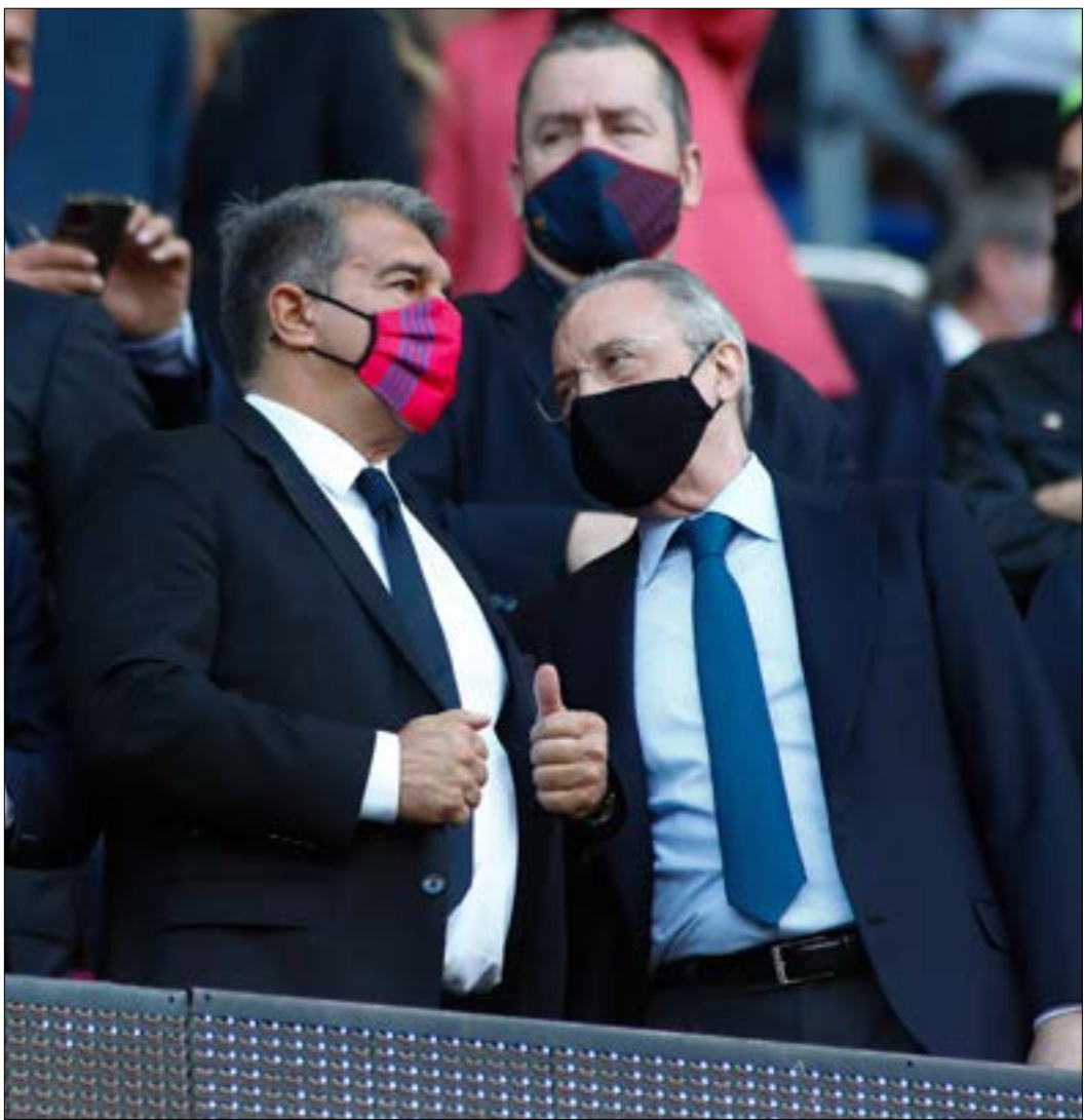
يعتبر ريباك محوريه ان التناقص مع CVC يشكك، اخلاصا، لاصول تحض النادي (ف ب)

يواصل كة من ريباك محوريه وبارسلونه «حريهما» على رابطة الدوري الاسباني لكرة القدم، فبعد تشبتهما باطلاق مشروع «سوبرليغ»، اقترح الناديان، بالإضافة إلى اتليتك بلباو، خطة استثمارية بديلة لصفحة الدوري المرتقبة مع «سي سي كاييتاك بارتنرز»، والتي ستخسر الاندية فيها سببا كبيرة من حقوق البث التلفزيوني. الحريه سيحال بين الطرفين والمفاوضات لا تزال مستمرة