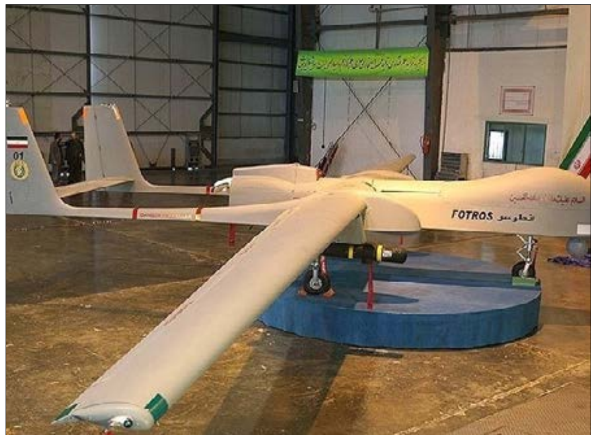
المسكرونة الصهاينة مقلّنتون بأنّ التهديد الجدي هو ذلك المتأثّي عن التطوّر الهائل في منظومات الأسلحة الذكية (مت الويب)

الإرادة السياسية والمعارف العلمية والهدرات التقنيّة والكلفة المادية المحدودة نسبياً لهذه الصناعة. ما الذي تستطيع إسرائيل في مقابل ذلك العاطف؛ يراهن ناجل، في مقالة المشار إليه سابقاً، على موازنة التصعيد في عمليات ما دون الحرب مع ضغوط روسيا، وأخرى خليجية مفترضة، على الدولة في سوريا لحملها على الطلب من إيران و«حزب الله» إخراج قدراتها الصاروخية من أراضيها، لا يتضمّن هذا الكلام أي جديد مقارنة بما دعا إليه مسؤولون إسرائيليون وأميركيون، منذ أكثر من أربع سنوات، من دون أن يجد أيّ ترجمة على أرض الواقع، إسرائيل، أمام مازق إستراتيجي، فعلي، أي أنّ تجد نفسها في مقابل عشرات الآف الصواريخ الدقيقة والمسيرّات المتطورة والمتنوّعة في طول الإقليم وعرضه، هو مازق لن تخرجها منه عودة الولايات المتحدة وإيران للعمل بموجبات الاتفاق النووي في صيغته الأصلية، والتي لا مجال لتعديلها لتشمل، لصالحاً أخرى، كالبرنامج الصاروخي لطهران ودورها الإقليمي، في ظلّ المعطيات الدولية والأقليمية الراهنة، من ناقل القول إنّ قادة الكيان العسكريين، الحاليين والسابقين، لا ينامون نوماً هانئاً.