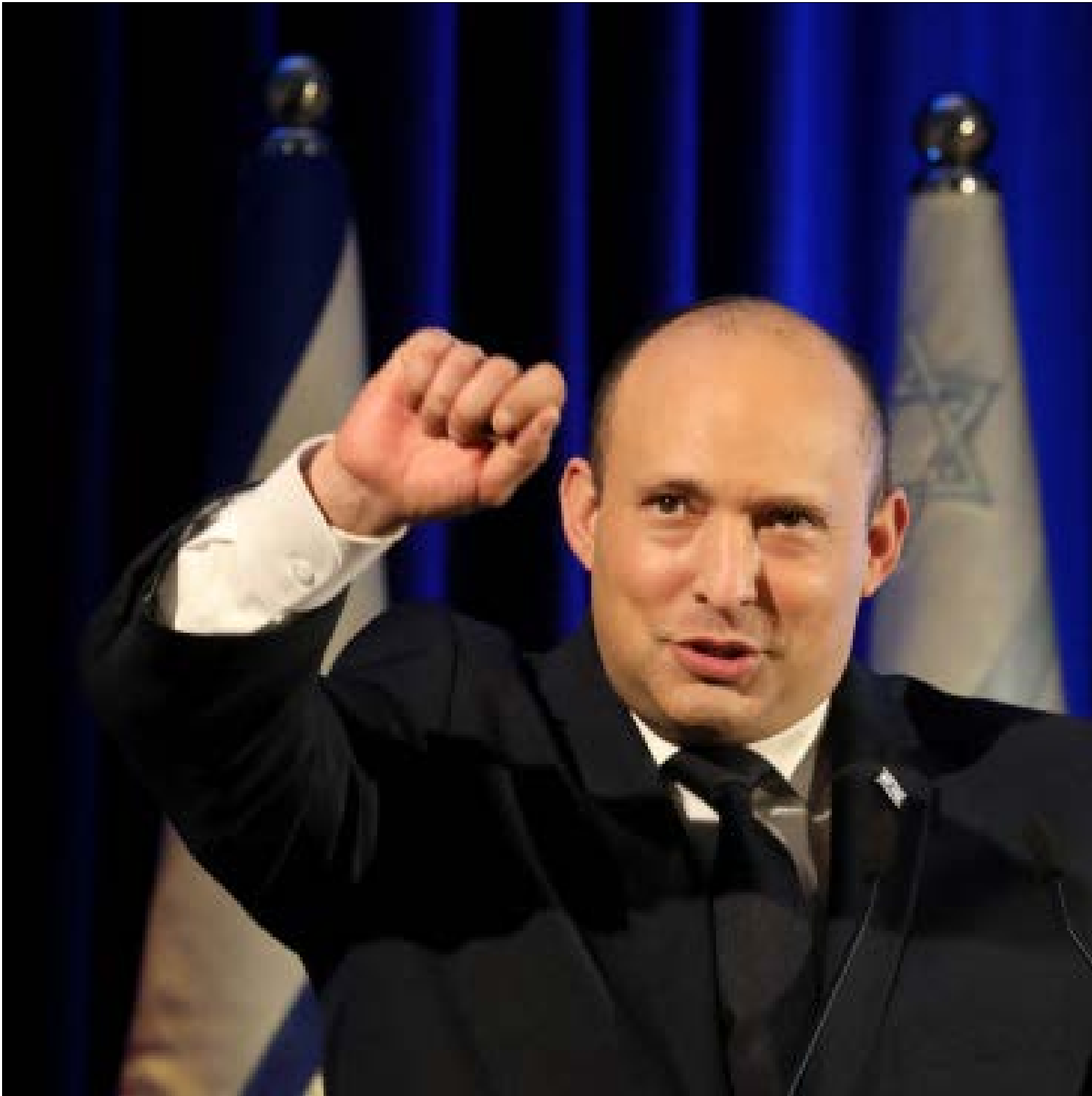
شدّد بينت على انه لا بدّ من تكبيد إيران لعنت انتهاكاتهما، للاتفاق النووي

إثّة خيارات أخرى متوافرة»، وما نتج من ذلك بنظره هو «فشل ذريع»، العسكريون الصهاينة، وقسم وازن من أنصار إسرائيل في الغرب والولايات المتحدة، كتوماس فريدمان مثلاً، مقتنعون بأن التهديد الجدي والواقعي، هو ذلك المتأثّي عن التطوّر الهائل والمتسارع في منظومات الأسلحة الذكية. مراجعة لوقائع ومجريات الحروب المستعرة في العالم، في العقد الماضي، تُظهر استخداماً مكثّفاً لهذه المنظومات من قِبَل لاعبين دولتيين وغير دولتيين، وهو ما يضاعف خوف إسرائيل من تراجع قدرتها على تغيير مسارات بعض الحروب المذكورة، الجنرال جاكوب ناجل، وهو مستشار أمن قومي إسرائيلي سابق، أفصح عن تلك الواجهة، في مقال في «جيووراليم بوست» بعنوان «التخاتر الموجهة الدقيقة: تهديد إيران الأكبر لإسرائيل بعد البرنامج النووي»، عندما توقع استعماراً له «عمليات ما دون الحرب» الإسرائيلية ضدّ ترسانة الأسلحة الذكية لدى إيران وحلفائها، لأنّ أيّ اتفاق في المستقبل، لن يتطرق إلى الأسلحة المُشار إليها ويسمى بدميرها، أو بوقف تطوّرهما على الأقل. إدراك العسكريين الإسرائيليين لمخاعيل الأسلحة الذكية على