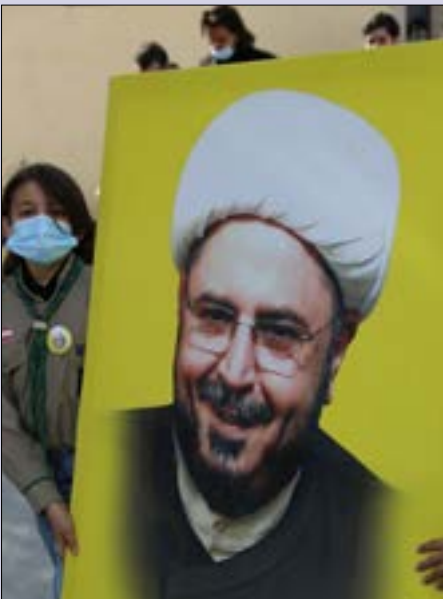
من الشّيع (مهاشم حطيط)

«بَدَى شوفك ضروري قبل العملية، شو عندك بكرة؟». وفي اليوم التالي، كنت في حضرة الشيخ في منزله في النبطية، مستغلاً خروجه المؤقت من المستشفى، ولكن العمليّة الجراحية المتقرّرة الذي تفشى سريعاً في جسده فمُنح إجراؤها. أمّا زيارتنا له في المستشفى لاحقاً، فلن تتكلّل بتحدّث الشيخ في اللقاء الأخير عن موته وحياته بنبرة هادئة محايدة كما لو كانا بخصّان أحداً غيره، أو كما لو كانا احتمالين لقضاء، يوم عطلة أو لإحياء نشاط ثقافي. كان مصداقاً لفكرة لم أستطع استيعابها قبله بمثل هذا الوضوح: أنّ يستطيع المرء الاستعداد في اللحظة ذاتها للموت غداً وللعيش أبداً!