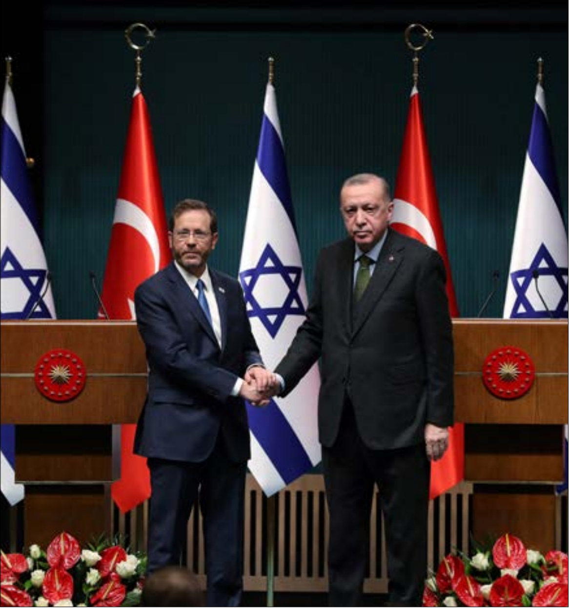
اعرب هرتزوغ عن سعادته البالغة، وهو زوجته، لزيارتها لتركيا

القصر الرئاسي ومزارته. الزيارة التي جاءت بعد 14 عاماً على آخر زيارة لرئيس إسرائيلي لتركيا، انتهت امس، بعدما استغرقت