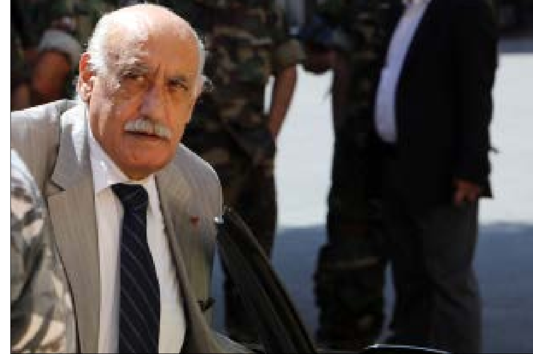
(رشيف - مروان طحطد)

علي، «بما لا يخدم الحزب»، واتهمه بـ«تجهيز قيادة للحزب ستكون مرتهلة له» (للسفير). كذلك قاطع أعضاء من القيادة القطرية المؤتمر