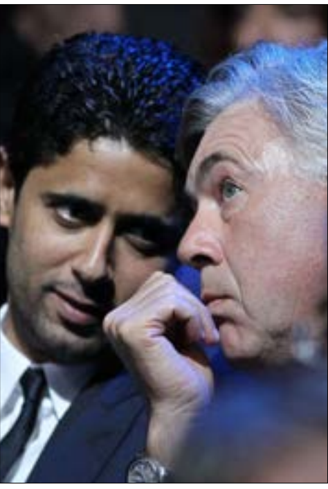
لم تهاجم الإدارة القطرية على خطط أنشيلوتي (فريد)

تولّى المدرب الإيطالي كارلو أنشيلوتي رئاسة المعارضة الفنية في باريس سان جيرمان منذ عام 2011 إلى عام 2013، وخلال هذه الفترة حقق الدوري الفرنسي مرة واحدة (2012 . 2013) بعد 14 سنة عجاف للباريسيين، ووصل مع الفريق إلى ربع نهائي دوري أبطال أوروبا، ولكن النادي الملوك قطرياً منذ عام 2011 لم يقدم المطلوب لأنشيلوتي، بل إنه لم يتقبل فلسفة المدرب في ذلك الوقت وصلت الإدارة القطرية وعلى رأسها ناصر الخليفي إلى باريس وهي تُمنّي النفس بالفوز بدوري أبطال أوروبا، إلا أن أنشيلوتي ويحسب العديد من التقارير الصحافية، طلب الترتيب وعدم رفع السقف باكراً، معتبراً أنه من الأفضل وضع مشروع للفريق لعدة سنوات، يتم خلالها استقدام أسماء مميزة ترفع المستوى وتزيد خبرة صغار السن، وتؤسس مرحلة حصد الألقاب المحلية والأوروبية.