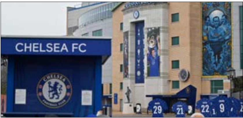
تم تجديد الحصون التي يمتلكها أبراموفيتش (1 صفا)

بدأ من لقاء نادي ليل الفرنسي يوم الأربعاء المقبل. وأعلنت وزيرة الخارجية البريطانية ليز تروس فرض تجريد كامل لأصول 6 رجال أعمال روس آخرين وحظر سفرهم من أجل «تشديد الضغط» على موسكو. وذكر بيان للخارجية البريطانية أن رجال الأعمال السبعة ترتبط أعمالهم وثرواتهم ارتباطاً وثيقاً بالكرملين، ومن بينهم المبادير الروسي رومان أبراموفيتش مالك نادي تشيلسي الإنكليزي لكرة القدم ورجل الصناعة أوليغ ديريباسكا.