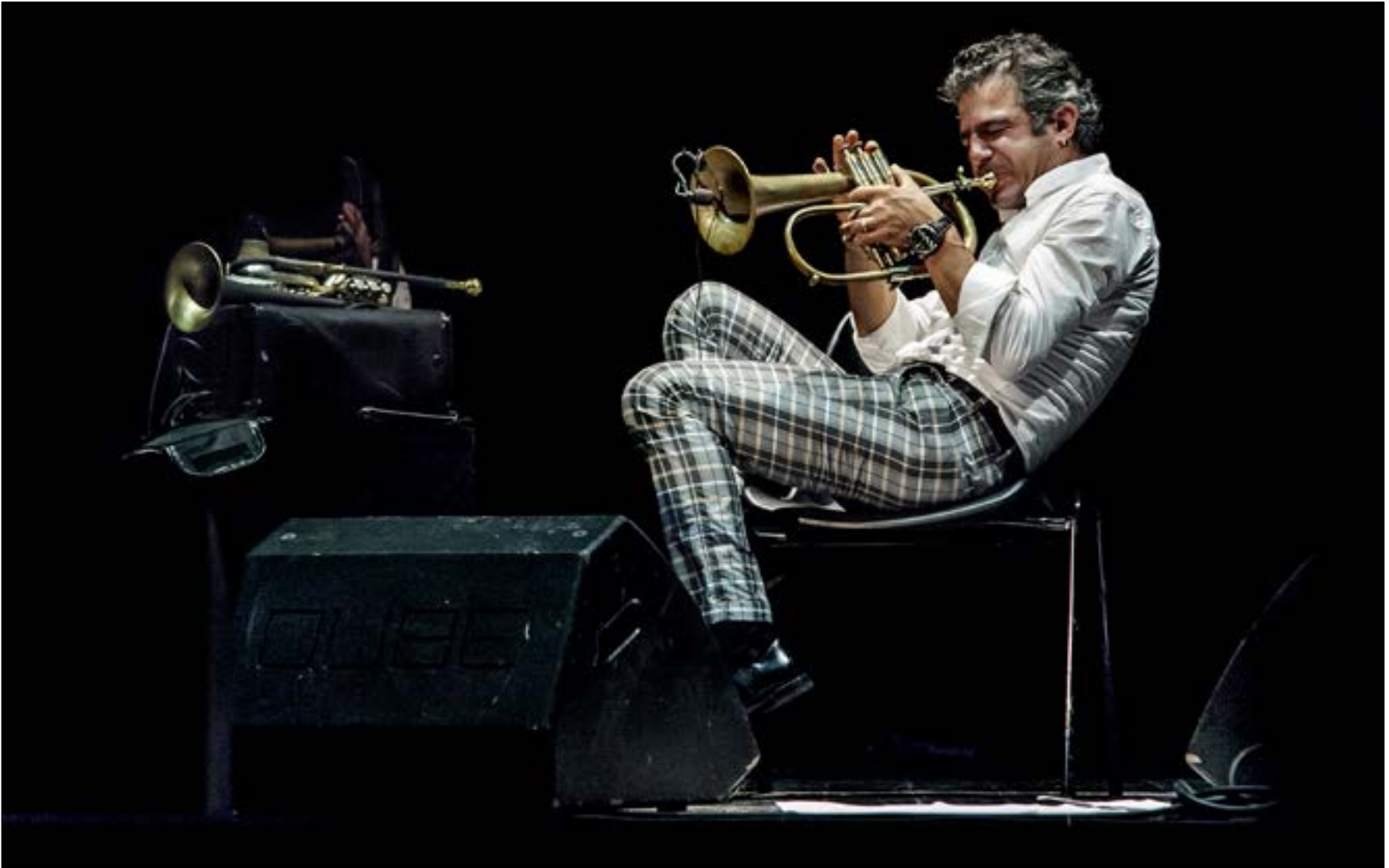
يقدم باولو فريزو عددا من القطوعات التي تشكّل تحية تكبار الجاز والحنا معروضه جدا (الديارورثيلج)

سماع الموسيقى النوعية، وبالتالي هو جمهور غير واسع، أن يعود في ظلّ الأزمة الكارثية التي تعيشتها البلاد؟ بعد المغادرة، توقف غطاس لمدة عام عن إقامة الحفلات وكان متاثراً جداً لدى تنظيمه الحفلة الأولى في «سبيتسيس»، فكانت مخبرنا: «شعرت أنني وعائلتي في خطر. كان الخوف والرعب كبيرين وشعرت أنّ الوقت حان كي نغادر. عشنا في اليونان لمدة سنتين. وأنسنا هناك مهرجان «زينيت» الذي نظّمنا دورته الأولى من أثنين هذا الصيف. هو مهرجان موسيقى متوسطة ندعو إليه فنانيين بانوا اصدقاءنا واصدقاء «لييان جاز». ومن هنا أتت فكرة حفلة باولو فريزو في لبنان مساء غد السبت. فهو كان أول ضيف للمهرجان «زينيت» في اليونان، وتكلّمنا خلاله عن الوضع في لبنان. واخبرني بأنه سيقوم بجولة في عدد من مدن الشرق الأوسط، ولم يكن يعلم إن كان ممكناً أن يحضر إلى بيروت، فطلب مني المساعدة لأنه يحبّ المحيء إلى لبنان واتفقنا على أن ننظّم الحفلة أنا».