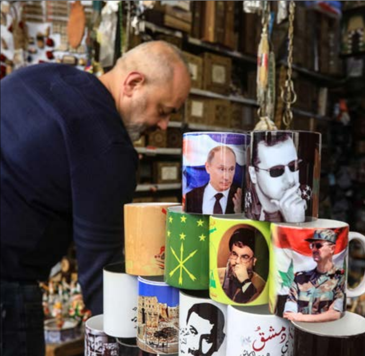
توضّف واشنطن أنّ يشهد الاجتماع المقبل لـ«اللجنة الدستورية» تقدّماً، وإنّ كان طفيفاً

على رغم أنّ أحداً لا يقيم رابطاً بين العملية السياسية العراقية التي تراجعت وتيرتها أخيراً وبين حرب أوكرانيا، إلّا أنّ العراق، بوصفه دولة مفتوحة على التبدلات الخارجية، سيبتأثر حتماً بما يجري هناك، لا كتأثير الدول الأخرى فقط، سواء من حيث ارتفاع أسعار النفط الذي يربح البلد مالياً، أو نقص بعض المواد الغذائية وارتفاع أسعارها، بل أيضاً في الأسابيع المقبلة أكثر لأنّ الحرب