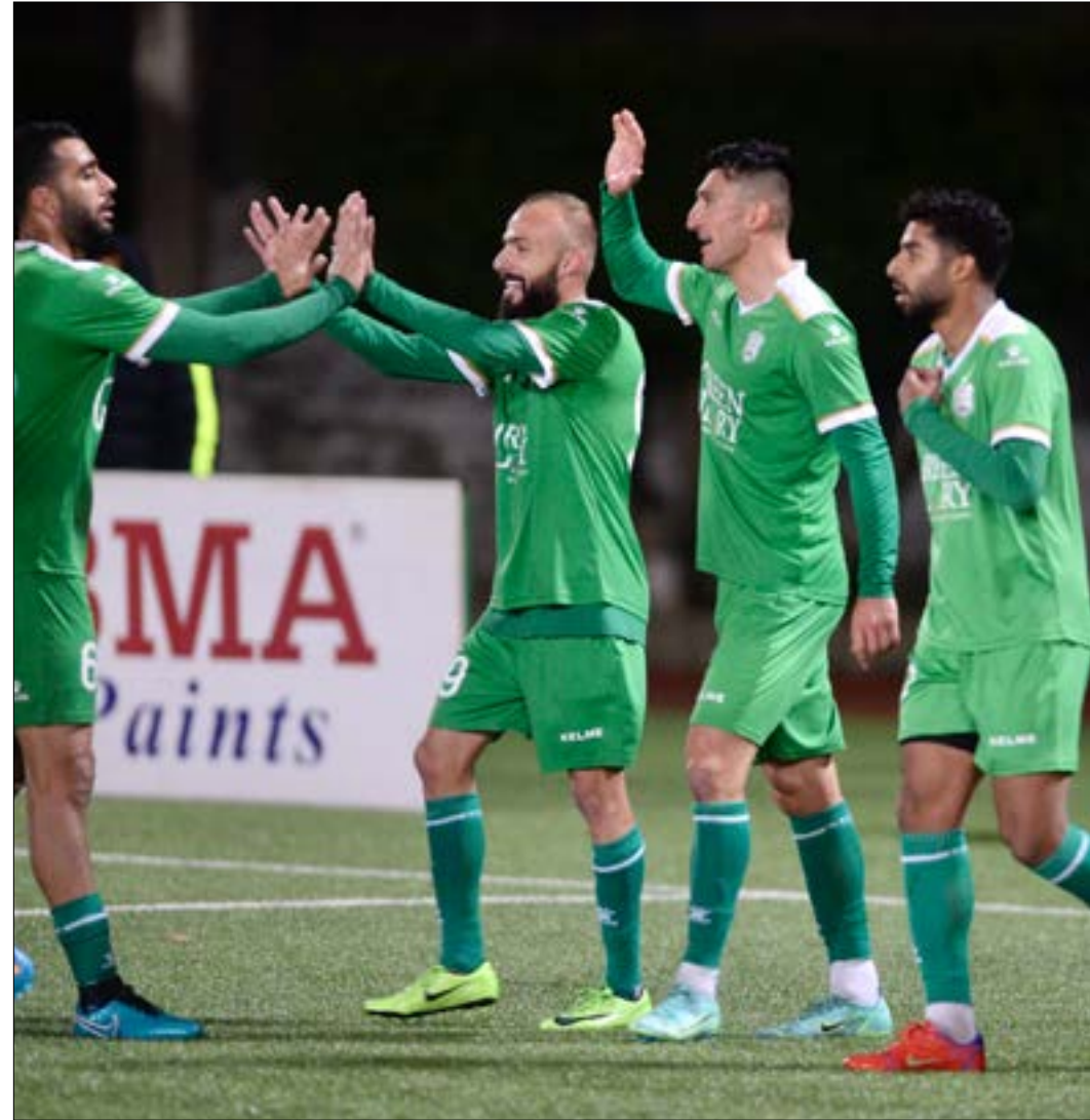
تغني الأنصار جوهوماً وأصبح فعلاً أكثر (طلح سلمان)

انطلقت سداسية هدائية الاوائل بطريقة مثالية بالنسبة إلى الأنصار الفائز على شباب الساحل بسداسية نظيفة في جونية، حيث ستجده الأنصار اليوم (الساعة 14:15 بتوقيت بيروت) إلى لقاء النجمة واللقاء الاهلي عاليه الذي كان الكل ينتظر صورة مختلفة له بعدما لعب الفريقان دوراً رئيساً في المنافسة على لقب الموسم الماضي، لكنهما يخوضان الآن سداسية الاواخر