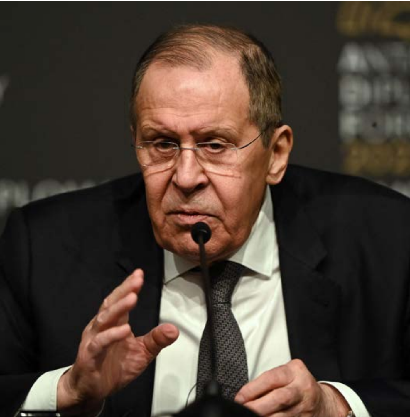
أشار لافروف إلى انه المحادثات ركزت على المسائل الإنسانية

في المقابل، اعتبر وزير الخارجية الأوكراني، دميتري كوليبا، كلام لافروف دليلاً على أن «روسيا ستستمر في عدوانها حتى تلتي أوكرانيا مطالبها»، مؤكداً أن أوكرانيا «لن تستسلم». وقال كوليبا إن كيبف «مستعدة لمواصلة الانخراط في بحث وقف الحرب»، مضيفاً: «نحن مفتتحون على الحلول الدبلوماسية، لكنّ بوتين يريدنا أن نخضع لمطالبه».