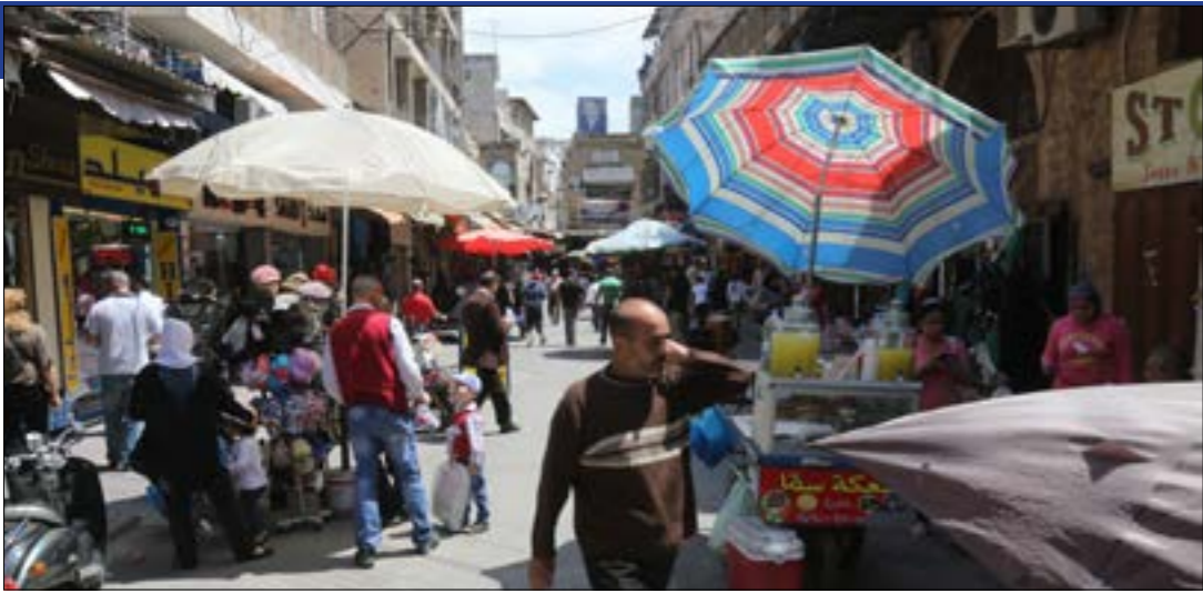
كثيرون بدأوا يختارون وجباتهم الغذائية بوجبة واحدة

طرابلس تنزّح ولا تقف مكانا بل في تراج مستمّر إلى الوراء، شبابها المتعلم بين مهاجر وطامح للهجرة تتعلم عنهم الشردية اللبنانية