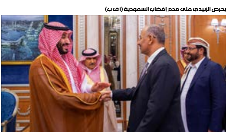
يحضر الزیدیدی على عدم أعضاء السعودية

والجنوب في «اتفاق الرياض» (2021)، ليس سوى عضو واحد من أصل ثمانية هم مجموع أعضاء المجلس يجمعلون صفة بؤاب الرئيس، وليس المناكب الوحيد له. وفيما حاول الإعلام السعودي والإماراتي التعويض على رئيس إنتاج نفسه، بإبراز دوره وتغطية لقاءاته السياسية، إلا أن عمليات التجميل هذه، سغقت عند أول رحلة لطائرات المدينة السعودية