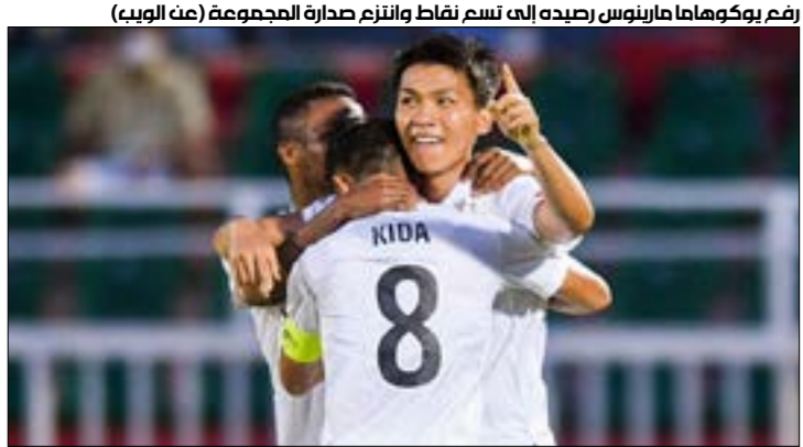
رعب بوكوهاما مارينوس رصيده إلى تسع نقاط وانترم صدارة المجموعة (صع الوبد)

انسحاب شنغهاي بورت الصيني. وكان فيسل كوبي قد سحق تشيانغراي يونبايتد بنصف درزينة تظفينة من بوريرام. وعزّز فيسل كوبي موقعه في الصدارة برصيد سبع نقاط بفارق أربع الماضي. وتقام الجولة الخامسة الخميس، حيث يلتقي تشيانغراي يونبايتد مع كيتشي. (أ ف ب)