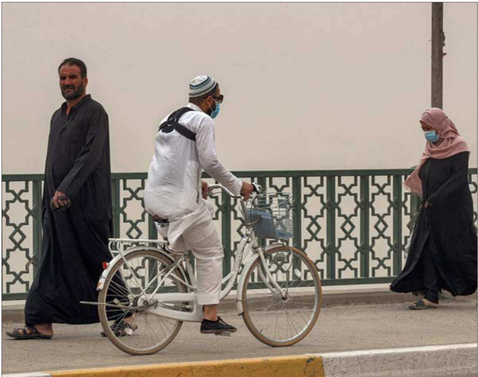
تموّك هوام على أن تنعكس حالة الهدوء الإقليمي على الداخل

فشلا في تشكيل الحكومة المهلهلة المخدّرة، فتمّ تكليف الكاظمي نتيجة تسوية، على رغم أن بعض أطراف «تحالف البناء» في تلك الفترة، و«الإطار التنسيقي» حالياً، لم تكن موافقة عليه. وعلى رغم هذا «الفيثو» في حينه، ربما يكون الرجل، موزة جديدة، بدلاً ومرشّح تسوية، لأن عكس ذلك يعني استمرار حالة الانسداد والفوضى والمجهول. ويعتقد مراقبون أن عدداً كبيراً من القوى السياسية يعول على أن تنعكس حالة الهدوء الإقليمي في الملفّات الأخرى على الداخل العراقي، وأن تترك أجواء الهدوء بين إيران والولايات المتحدة، آثارها على العراق، بالنظر إلى الدور الكبير ل طهران وواشنطن في هذا البلد. ويتزامن ما تقدّم مع إعلان كلا البلدين عن تعيين سفيزين جديدين لهما، في ما اعتبر مؤشراً إلى مرحلة جديدة في السياسة الإيرانية والأميركية في العراق. ويتخظر إلى تعيين حسين ال صادق سفيرا جديداً لإيران لدى العراق، خلفاً لإبرج مسجدي الذي انتهت مهامه، على أنه فاتحة سياسية أكثر ماسسة للعلاقة بين البلدين، على رغم أن الإطار العام للسياسة الإيرانية لم يتغيّر، بحث تعتبر طهران أنها هي المستهدفة من