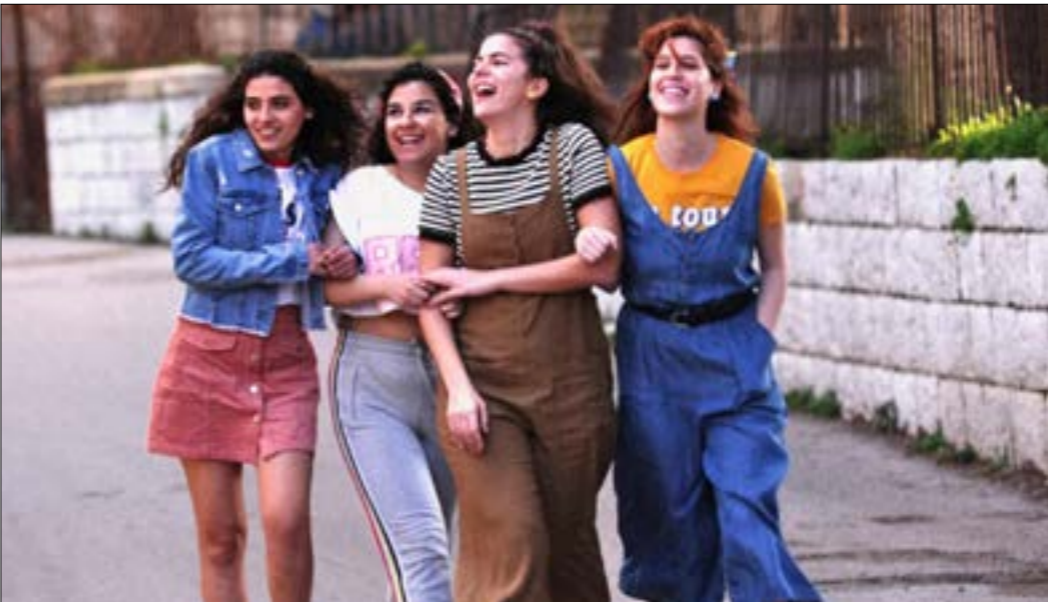
اقتحم «حفّار مايا، للثنائ جولا حاجي، نوما وخليك جريج، «بقعة ضوء»

المهرجان، قدّمت حلقات نقاش، تحدّث فيها المخرجون والمخرّجات وممثلو جمعيتي «بيروت دي سي» و«سينماتك بيروت» عن الأدوار المتنوعة لتلاشيف وتحرير الروايات المضادة وكيفية صناعة الأفلام في زمن الأزمات، بالإضافة إلى أسئلة حول الذاكرة السينمائية ودور السينما في المشاركة السياسية. تحدّثت إلينا عن دور «المهرجان الذي تأسس عام 2009 على يد عصام حداد، بسبب ندرة الأفلام العربية في ألمانيا في ذلك الوقت. لم يكن لدى الجمهور الألماني فكرة عن السينما في العالم العربي، أيضاً. أراد الفريق المؤسّس تقديم نظرة مختلفة عن الرائج في الصحافة الألمانية (حروب، إسلاميين، إرهاب...) حول العالم العربي، كما تقديم صورة عن