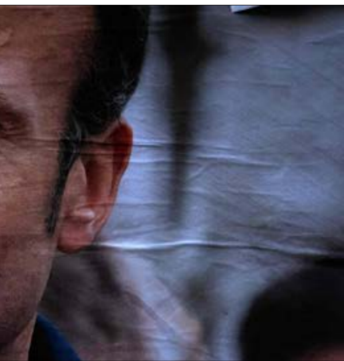
هزم ماكرون لوبيان بهامش املی مقلّمًا متصورًا حتى في الاستطلاعات الأخيرة

عن الديمقراطية، ومكافحة تغيّر وكان كثيرون قد توقّعو التجديد لماكرون، وهو الذي هزم لوبيان بهامش أعلى ممّا كان متصوراً حتى في الاستطلاعات الأخيرة قبل فتح الصناديق، لكنّه أيضاً حصل على مجموع أقل من الذي كان حصل عليه في مواجهة لوبيان خلال رئاسيات 2017، حينما حاز ثقة 66% من الناخبين الذين أنصوا بأصواتهم ويرى خبراء أكاديميون أن الصراع الانتخابي لم يُحسم كليّة بعد، إذ يحتاج الرئيس، الآن، إلى ضمان عرض من حزبه على الغالبية في الانتخابات التشريعية المقبلة، حتى يتيسّر له