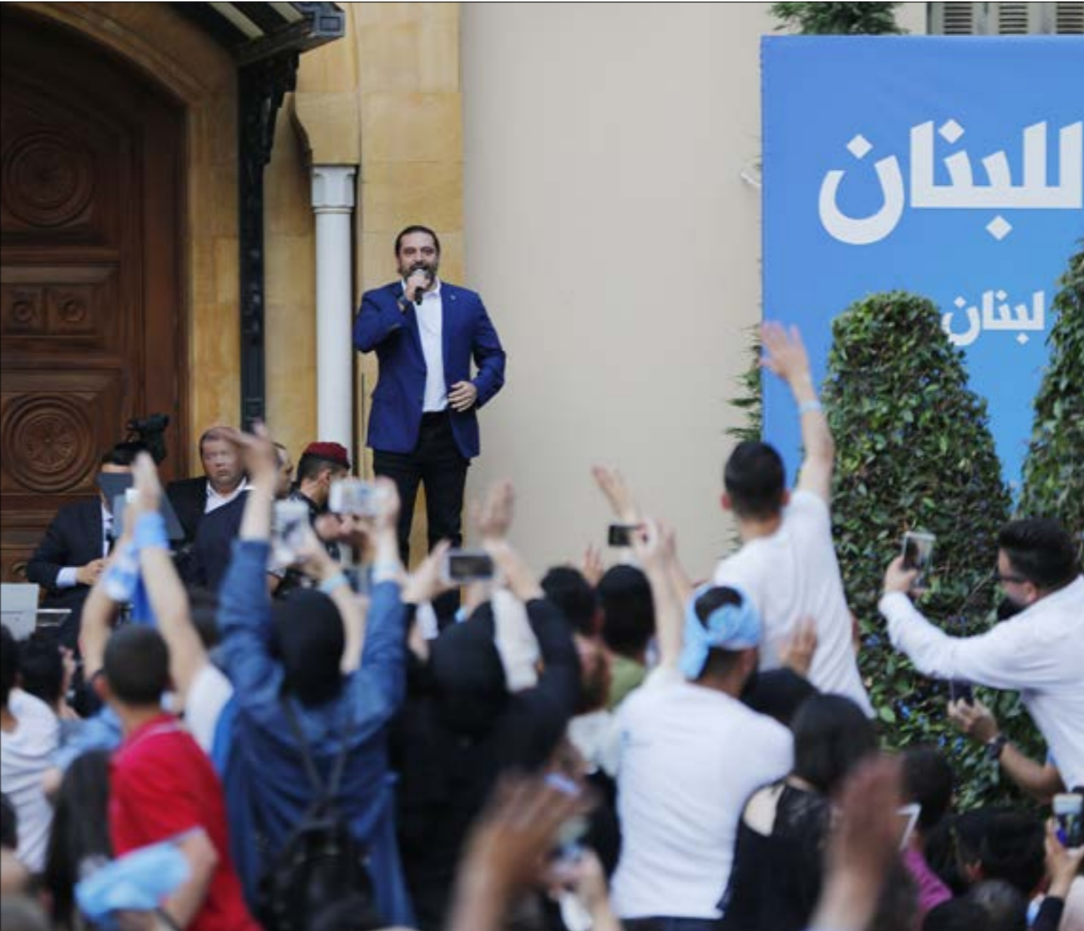
مغزبه الدور السعودي: إخراج الحريري من المعادلة يقضي أن لا يُخزج طائفته (مروان بو حيدر)

عديمة الوجود. أكثر من أي وقت مضى، بات الكلام المعتم أن الانتخابات واقعة حتماً. قلّت ذرائع التأجيل وتكاد تختفي، الأهم في ذلك أن أحداً لم يعد يرسم علامات استفهام على مناقبة إجرائها، مقدار ما بات يعتبر سلفاً عن تخوفه من الواقع المقبل للمناقبة