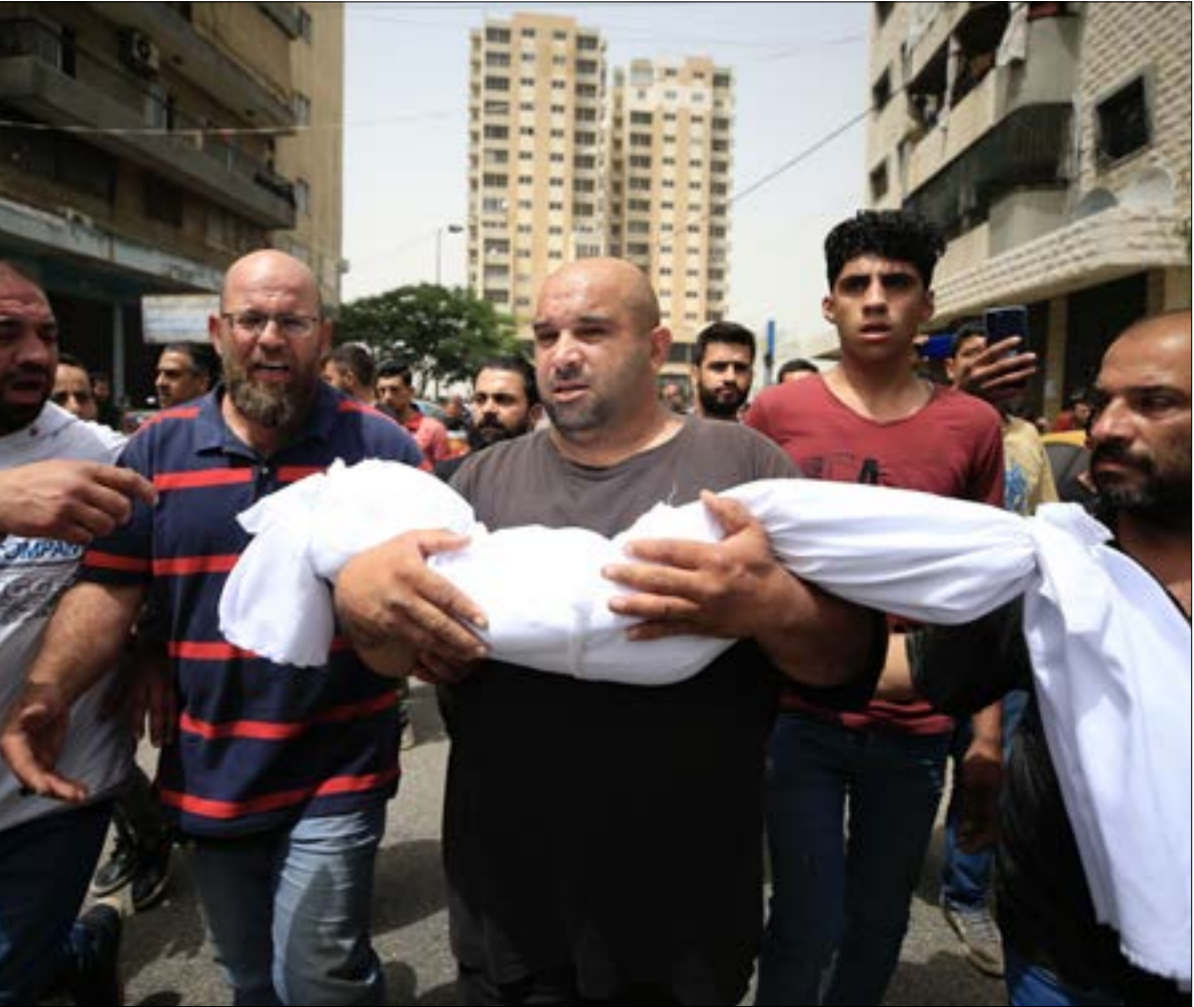
عائلة الجمل يامت منازلت وكل مقتلياتها في سبيل الهجرة

المدينة في ظل كمية من الروايات المتناقضة او الناقصة حول حادثة الغرق، حتى الآن لا ارقام دقيقة لعدد ركاب القارب، ولا لعدد المفقودين الذين تشير التقديرات إلى انه قد يتجاوز الثلاثين، كما يمكن ان يكون عدد