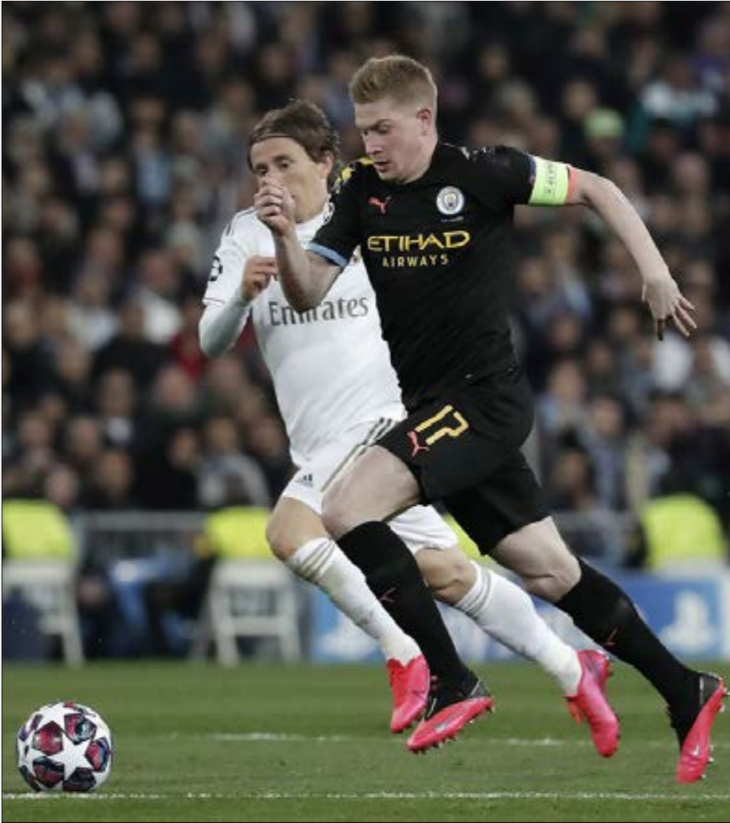
باث هواجهة السيتي والريال من كلاسيكات الكرة الأوروبية

في المناسبات الكبيرة من البطولة القارية منذ تركه لفريقة الأوبرشلونة، فكانت آخر التكتسات في نهائي العام الماضي أمام تشلسي. إذاً، أنشيلوتي هو ملهم كبير في هذه الموقعة، لكن هناك من هو أكثر تأثيراً المرعب يسير بثبات نحو حسم لقب أفضل لاعب في العالم قبل انحصاف السنة، وهو بإمكانه إنهاء الأمر في حال إحصائه مانشستر سيتي بعدما انفجرت موهبته بشكل كبير في الدورين السابقين ليدخل تاريخ البطولة بتسجيله «هاتريك»، في مباراتين متتاليتين، وهي مسألة لم يفعلها سوى زميله السابق