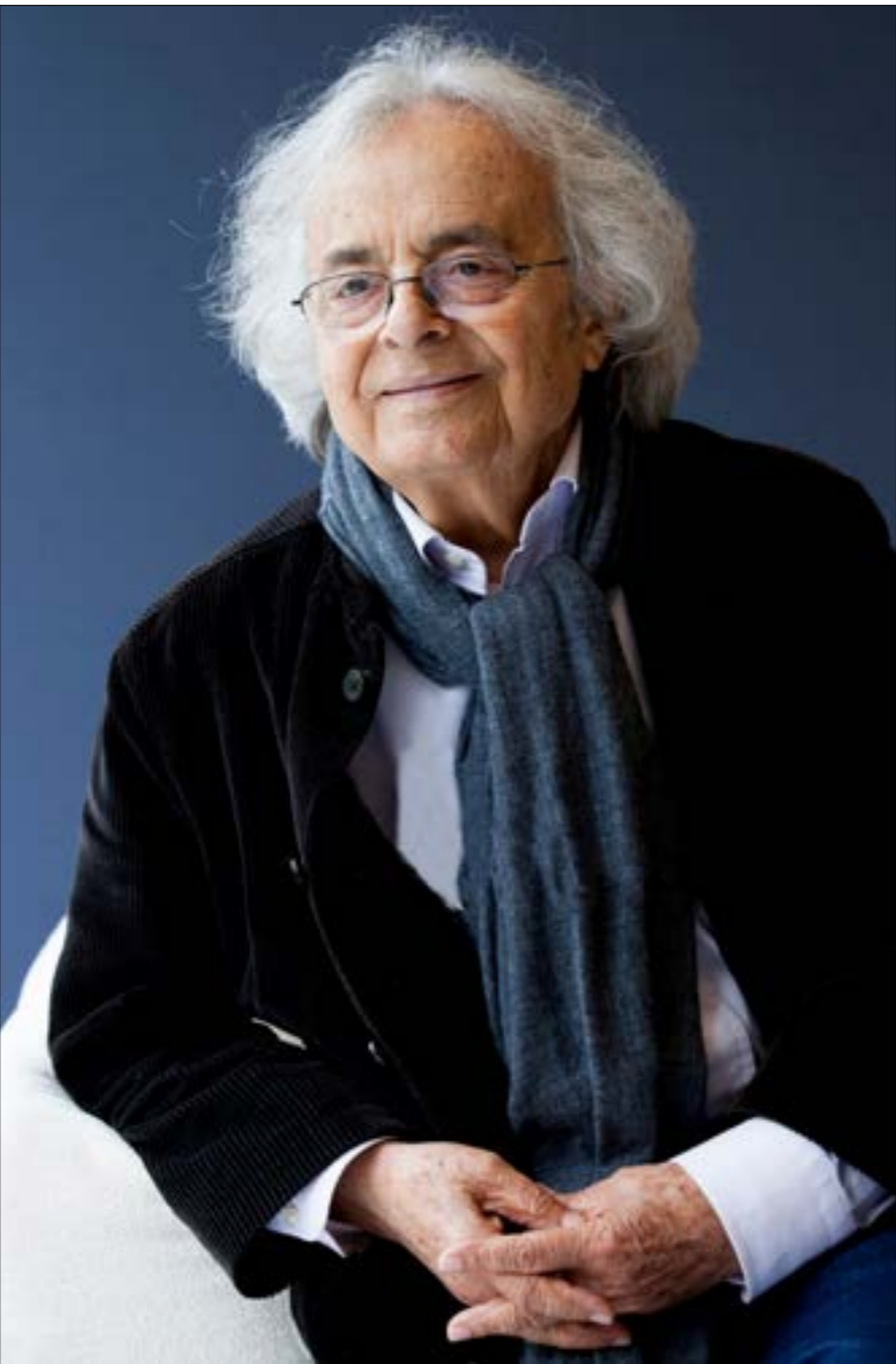
بحزم أدونيس بأنّ كينولته مرتبطة بذلك الإكسبر الذي اضفه عليه هيفك صفة الخلود. أبي الشعر

النفسى - الثقافي - الاجتماعي - الاقتصادي، أي بالعصف الوجودي الشامل. وقد غالى باحثون في ربط كل ما صدر عن أدونيس وشركائه في حركة الحداثة كيوستف الخال، ويدر شاكر السياب، وأنسي الحاج، وشوقي أبي شقرا، وفؤاد رفق، ونذير العظمة، وكمال خير بك، بالأسطورة الفلسفية والمُخال التاريخي والشعبي حتى طاب لبعضهم إطلاق مصطلح «الشعراء التمزّجين» على الذين وظّفوا الأسطورة الأدونيسية في محاكاة القيامة بوصفها حدثاً آتو من المخاض وأبقى من الزمان والمكان. وقد يكون ذلك عائداً إلى إرهاسات حدائية عند نفر من أولئك الحدثين الذين كانوا شباباً متأخّجين بفكرة الولادة الجديدة وحلم التخيير. يقول أدونيس، الذي أصدر يوماً مجلة «مواقف» «تموز الحبيّة إلى نفسه نموذجاً من صورهِ القرية - البعيدة وبين قنرات نداء على قصيدنا المعاصر: «أعيش مع الضوء عمري عبيدٍ يمزّ وتنايتي سنواتٍ وأعشق ترتيلة في بلادٍ تتألفها كالمصباح الرعاة» رموها على الشمس قطعةً فجر نَقَى وصلوا عليها وماتوا! إذا ضحك الموت في شفتيك بكك من حينٍ إليك الحياة». * استاذ جامعي في الفلسفة والأدب