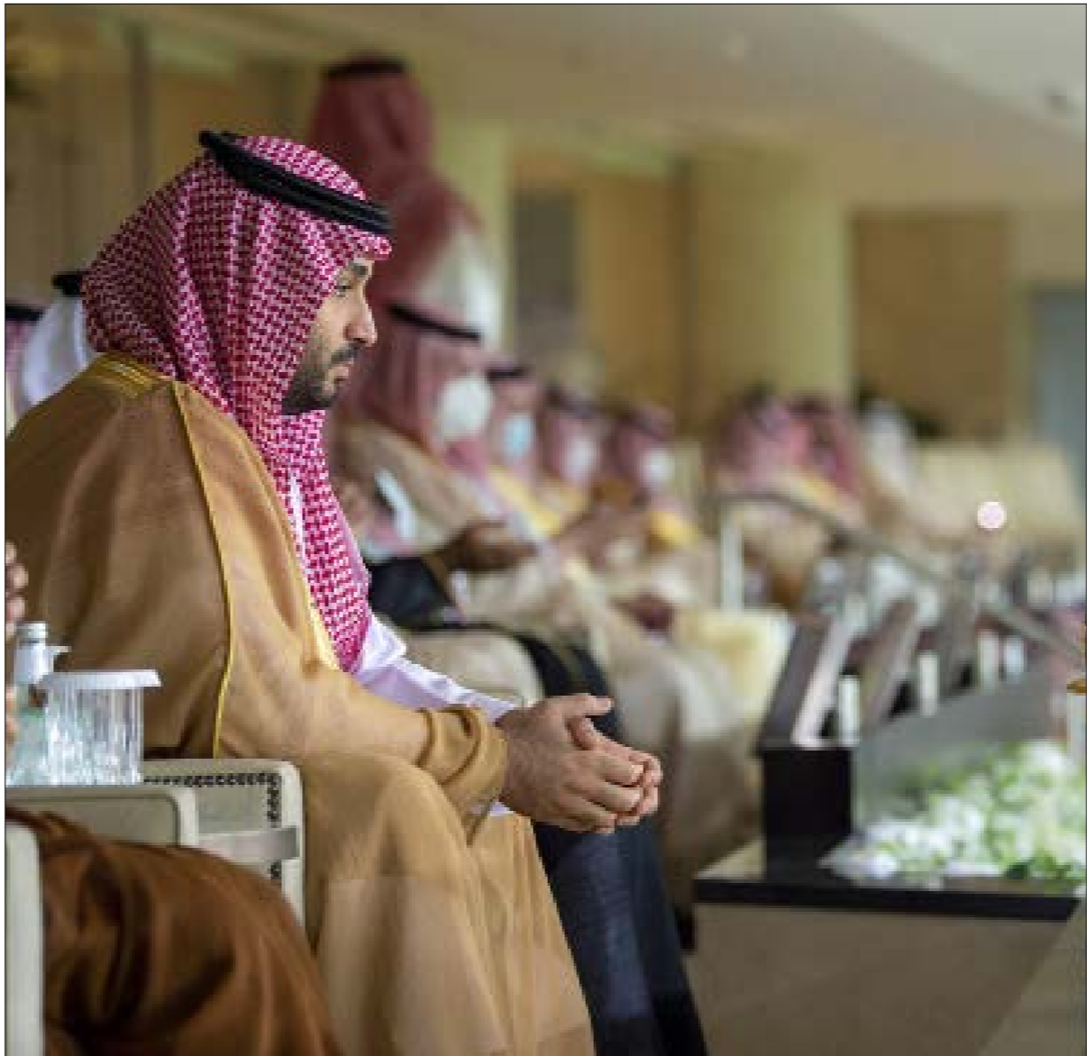
الهويريني نفسه عاد ووضه حفلة لقمم ابن سلمان، الذي عزله ووصفه قبيد الإقامة الجبرية منذ ستة أشهر

رجالا مخمورين ونساء بملابس فاخرة، تحت المراقبة، ومن ثم ذهب ابن نايف إلى الحفلة غير مدرك للخبّ الذي تُصب له، بسبب ثقته العالية كاميرات عدّة لضمان بقاء جميع الحضور في الحفلة التي ضُمّت