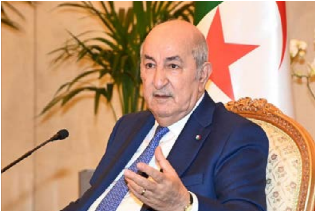
أكد تبون أن حماية القدرة الشرائية للجزائريين ستبقى من بين الأولويات (الناظر)

الجزائري، تدهورت بشكل ملموس خلال السنتين الماضيتين. ولولا ذلك، لما أعلن الرئيس، في حوار صحفي في 2 نيسان الماضي، عن إجراءات أخرى سيجري اتخاذها لتحسين تلك القدرة، بما يعني أن القرارات السابقة لم تكن كافية. وقال تبون في اللقاء: «نعمل قدر المستطاع، وبصفة تدريجية، من أجل رفع القدرة الشرائية للمواطن». وأضاف: «قبل نهاية السنة، ستكون هناك زيادة في الأجور وفي منحة البطالة، وسيشروع في تطبيقها مع بداية شهر يناير (كانون الثاني) 2023»، ذلك، أكد، في رسالة بمناسبة «يوم العمال العالمي» أن حماية القدرة الشرائية، والحفاظ على مناصب الشغل... ستبقى من أولوياتنا». وتابع أن السلطات تعمل على رصد ما أمكن من موارد مالية لها، ولا سيما لصالح الطبقة المتوسطة، ونوي الدخل المحدود، والفئات الهشة». من جهتها، تُنمّط النقابات العمالية من جهة، والبطقة السياسية وحتى منظمات حقوقية إلى خطورة وضع القدرة الشرائية للمواطن الجزائري، لكنها