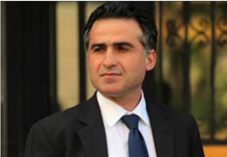
كان ينظر من حمية القطاع عن جامعتة الوزارية (هيلم الموسوي)