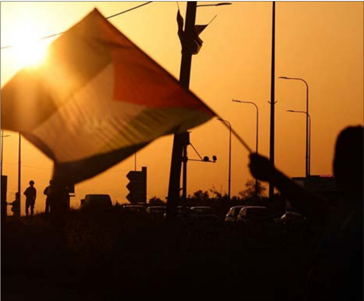
اطلق مقاومون النار على حاجزي حوارة وبيت فوريك قرب نابلس، فيما استهدفت البتات لجيش العدو خلال تنفيذها اعتقالات في مدينة نابلس (أ ف ب)

خلال الیومین الماضیین، وقع تطوّر دراماتيكي لم تفصح عنه إسرائيل أو جهاز أمنها العام «الشاباك»، ويتعلّق بمحاولة مقاومين تنفيذ عملية عبوة ناسفة قرب المركبة الفلسطينية وعلّمت «الأخبار» أن العدو اعتقل في هذه الحادثة شاتين ينتميان إلى حركة «الجهاد الإسلامي»، أحدهما من مخيم جنين والأخر من القرى المجاورة. وعلى الرغم من التحدّد الإسرائيلي حول الحادثة، وتعدّد التكهّنات بشأنها، إذ أنها تشكّل تطوّراً خطيراً يتمثّل في محاولة إدخال العيوبات النافسة إلى دائرة الاشتباك.