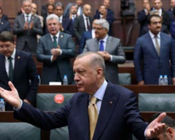
تحلّ تركيا، الولايات المتحدة مسؤوليّة معارضة العملية العسكرية المحتلة في شمال سوريا (أ ف ب)

تحدّث تركيا، الولايات المتحدة مسؤوليّة معارضة العملية العسكرية المحتلة في شمال سوريا (أ ف ب)