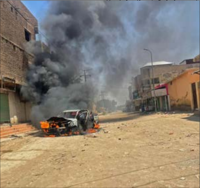
الثارت هذه الأحداث مخلّفة من امتدادها إلى أرجاء البلاد كافة، وصولاً ربما إلى حرب أهلية