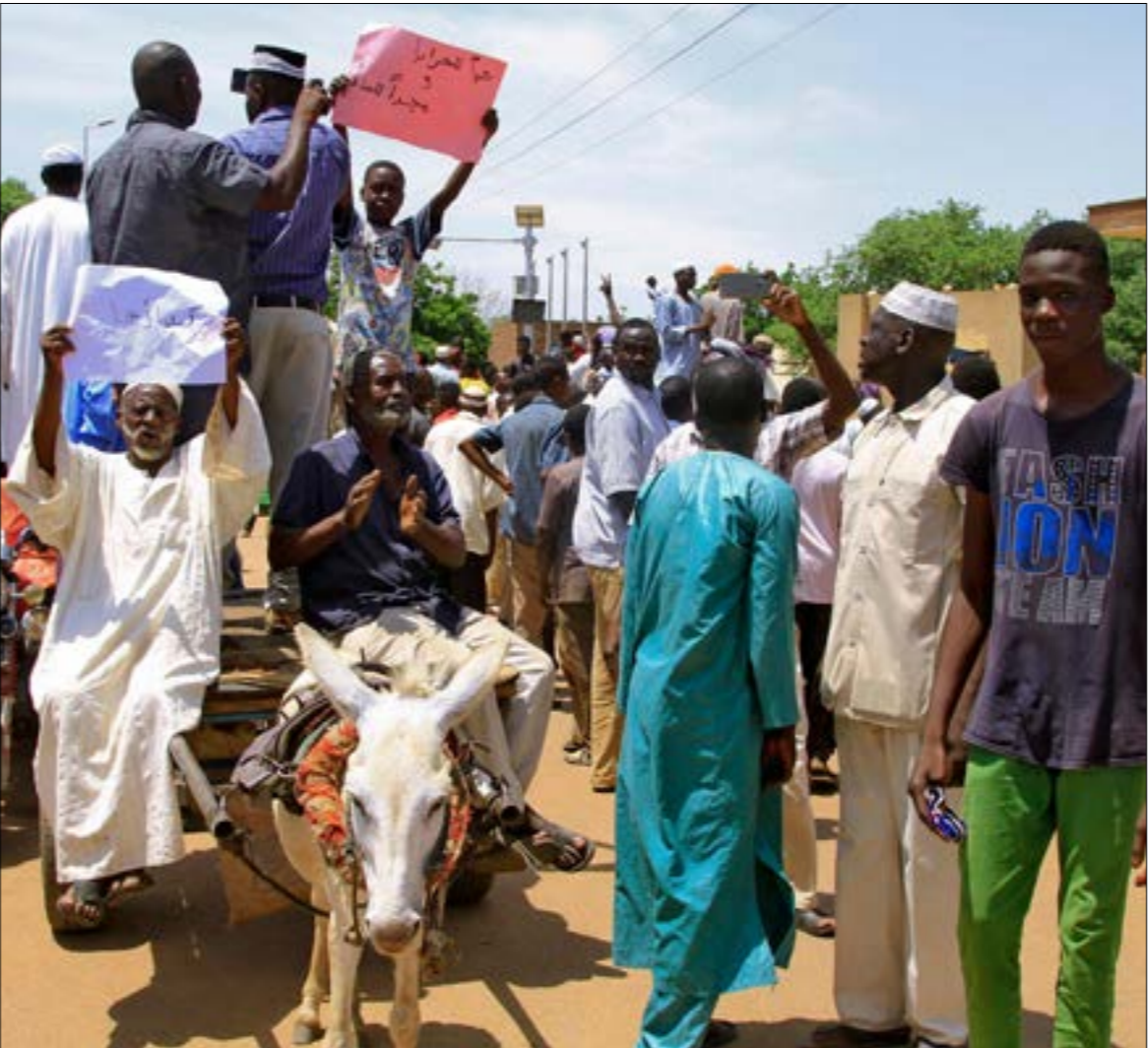
لا يستبعد مراقبون أن يقود استمرار التوتّرات القبليّة، إلى قبول بعض القوى السياسية بالنسوية خشية انهيار الدولة