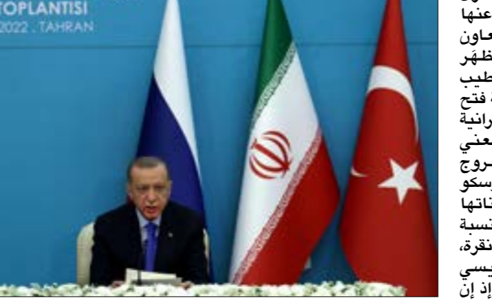
بعد إردوغان الحضور من روسيا وإيران، على طاقة باسار يريد لمواجهة الأزمة الاقتصادية الخانقة في بلاده

الحدث عن تعاون تجاري بالكاد تصل قيمته إلى سبعة مليارات دولار يشكّل علامة سلبية، في أواخر بلدين يفوق عدد سكان كل منهما ثمانين مليون نسمة. وتعتبر إيران من كبار موزدي الغاز الطبيعي والنظف تركيا النقطلة من إيران تراجع، بسبب بعض العقوبات الغربية، اسيا، في حين تُعدّ تركيا بؤاية الأولى على أوروبا، ولا يفقأ مسؤولو البلدين منذ سنوات يتحدثون عن تطلعهم إلى رفع حجم التجارة بينهما، من دون النجاح في ذلك، بل إن واردات بين الجانبين في السنوات العشر الأخيرة. ولعلّ الهمة الأساسي لإردوغان اليوم، هو الحصول من روسيا، كما إيران، على طاقة بأسعار أرخص لمواجهة الأزمة الاقتصادية الخانقة في بلاده، حيث بلغ تراجع سعر صرف الليرة أمام الدولار رقماً قياسياً أمس، بمقارنته الـ17,600 ليرة.