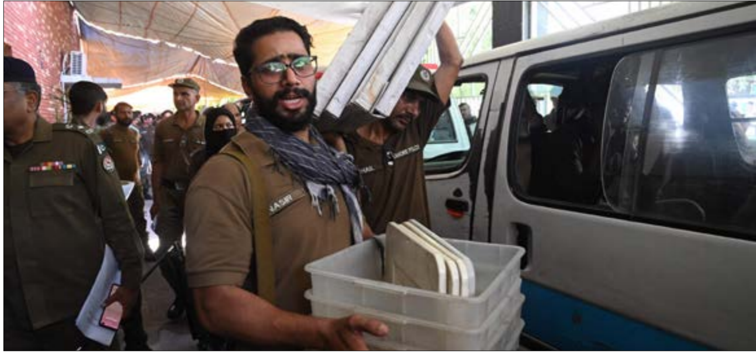
حشد «الإنصاف» على 15 مقعداً من مجموع 20 نائباً تم اختيارهم في هذه الانتخابات الفرعية

وحيد: التوجه إلى انتخابات مبكرة، ويحتمل أن تؤول هي الأخرى إلى حزب خان، ولا سيما أن الحكومة الحالية تواجه تحديات اقتصادية حادة، عززها قرارها رفع الدعم عن المحروقات، ما زاد الأسعار بنسبة 50% في أقل من شهرين. ويحفل خان الحكومة المحلية مسؤولة، على ارتفاع كبير في التضخم، على رغم أن غالبية المحللين يتفقون على أن شريف ورت الأزمات الاقتصادية في البلاد، والتي يرجح أن تتفاقم وتأتي مع توقيع اتفاق وشيك مع «صندوق النقد الدولي» لمعاودة تنفيذ خطة المساعدة المالية قيمتها 7.2 مليارات دولار. ويتوقع أن تتلقى باكستان أربعة مليارات دولار أخرى من دول صدقة لتجنب شبح العجز عن سداد التزامات مالية دولية. ورات الصحف الباكستانية أن نتائج الاقتراع في البنجاب أتت جراء الصعوبات الاقتصادية في البلاد التي تنفق حوالي نصف عائداتها على خدمة الدين الخارجي. (الأخبار)