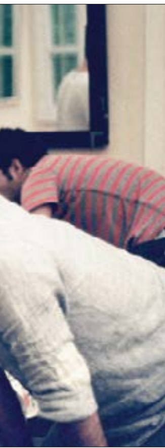
«بلات» «ريخ كاس العالم» «بلان» «سيرة» «مقاليت» «سافيت» «صه الحرب»

في 11 تموز (يوليو) 1982 يوم كان الطليان يحتفلون بأحد انتصاراتهم الأسطورية في تاريخ كأس العالم لكرة القدم، كان جميع سكان بيروت يواجهون أسوأ اغتصاب تعرّضت إليه عاصمتهم منذ سبع سنوات، أي منذ الحرب الأهلية أو بلا شك منذ تأسيسها. منذ عام 1938، لم تفز إيطاليا بكأس العالم، ومنذ عام 1967، بعد الاحتلال الصهيوني للقدس الشرقية، لم تعرّض أي عاصمة عربية لأحتياح مثل من قبل الجيش الإسرائيلي. لا بد من الإشارة إلى أنه في عام 1958، شهدت بيروت حرباً أهلية قصيرة، عبارة عن بروفة عامة للحرب الأهلية التي اندلعت بين عاني 1975 و 1990، لكن في تلك الحالة، استنجد الرئيس اللبناني آنذاك كميل شمعون بالبحرية الأميركية التي وصلت إلى شواطئ بيروت لكفاحة القوى الناصرية المتحالفة. في صيف 2006، فاز الأزوري بكأس العالم للمرة الرابعة، وفي الصيف نفسه، تعرّضت بيروت مرة أخرى للقصف من قبل القوات الجوية الإسرائيلية. أربعة وثلاثون يوماً من الهجوم والدمار الشامل، خصوصاً في الضواحي الجنوبية.