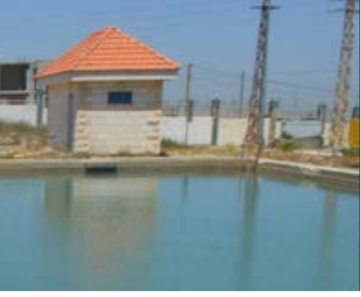
مضخات المياه في مشروع الطبقة صفية وتنصك بالسمار (الأخبار)

هي المرة الثالثة التي «يدش» فيها اقتراح قانون تجديد المادة 2 من قانون تنظيم الموازنة المدسية الرقم 515 /1996، أو ما يُعرف باقتراح تطبيق سقف الاقتساط في المدارس الخاصة، على جدول أعمال الهيئة العامة للمجلس النيابي. فقد طرح في المرة الأولى في كانون الأول 2021، لكنه أعيد إلى لجنة التربية النيابية بعد ضغوط مارسيتها لجان الأهل. وفي شباط الماضي، أعادت الرئيسة السابقة للجنة التربية النيابية، الشاذلية السايقة بهية الحريري، إدراجها في الجلسة التشريعية ثم عادت وسحبته بالتنسيق مع وزير التربية، عباس الحلبي. ووافق المجلس يومها على إعطاء مهلة أسبوعين لتقديم اقتراح قانون بديل يضع ضوابط للإنفاق، وسقوفاً للزيادة على الأقساط، ويشترط