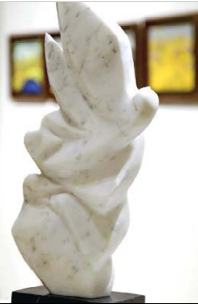
«قصيدة» (زخم) 25 × 48 × 10 سنتيمتر (2022)