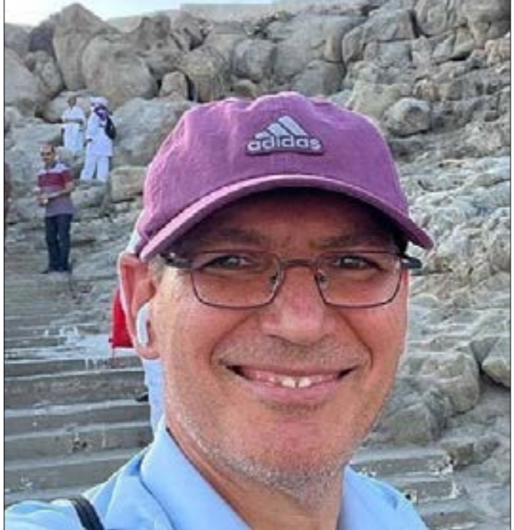
بثّ التقرير بدأ مقصوداً إسرائيلياً لتوريث ابن سلمان في تطبيع سريع مع الكيان (من الوبيد)

العالمية، بما يساهم أيضاً في تادية معارضة لإقامة علاقات دافئة معها. دفعاً للمعارضة السعودية، وجّهها مباشرة تتعلّق بالتطبيع مع الكيان، والذي كان يريده تدريجياً ومراعياً لوضع المملكة، لياتي سيل الغضب الذي عبر عنه السعوديون، بوصف ما حدث اعتداءً إسرائيلياً على مقدسات المسلمين، مشابهاً لاعتحامات التي يقوم بها المستوطنون الإسرائيليون للمسجد الأقصى في القدس، ليزيد موقفه تعقيداً، وعلى رغم أن السلطات السعودية التي بدت مآخوذة بـ«المفاجأة» الإسرائيلية، واجهت الأزمة