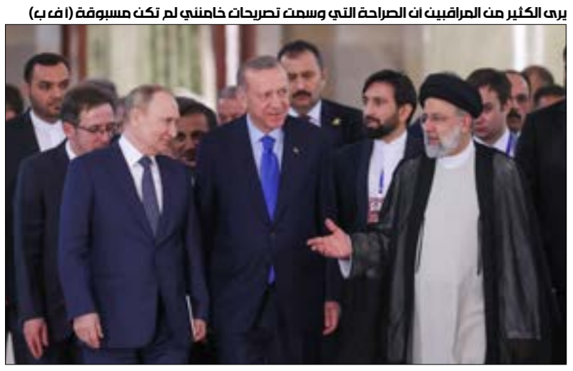
بره الكثير من المراقبين أن الصراحة التي وسمت تصريحات خامنئي لم تكن مسبوقة

والتحالف مع أميركا - لتصل إلى 30 مليار دولار سنوياً، كل ذلك بشكل جزأ فحسب من استعراض قوّة إيران، مع الحفاظ على مبادئها ولغتها الثورية في ظروف ركود الاتفاق النووي وتكتيف العقوبات والصعوبات الغربية». أما صحيفة «امروز»، فقد نشرت صورة المصافحة بين خامنئي وبوتين على صفحتها الرئيسية، وكتبت في عنوانها العريض: «المصافحة الاستراتيجية»، واعتبرت أن أهمّ العوامل التي تعطي زخماً للعلاقات الاستراتيجية بين الدولتين هي: «1- التوجّه المشترك تجاه النظام الدولي الجديد؛ 2- مواجهة السياسات العدائية لأميركا؛ 3- التعاون الاستراتيجي الإقليمي؛ 4- التعاون الاستراتيجي الثنائي؛ 5- تحييد العقوبات الغربية».