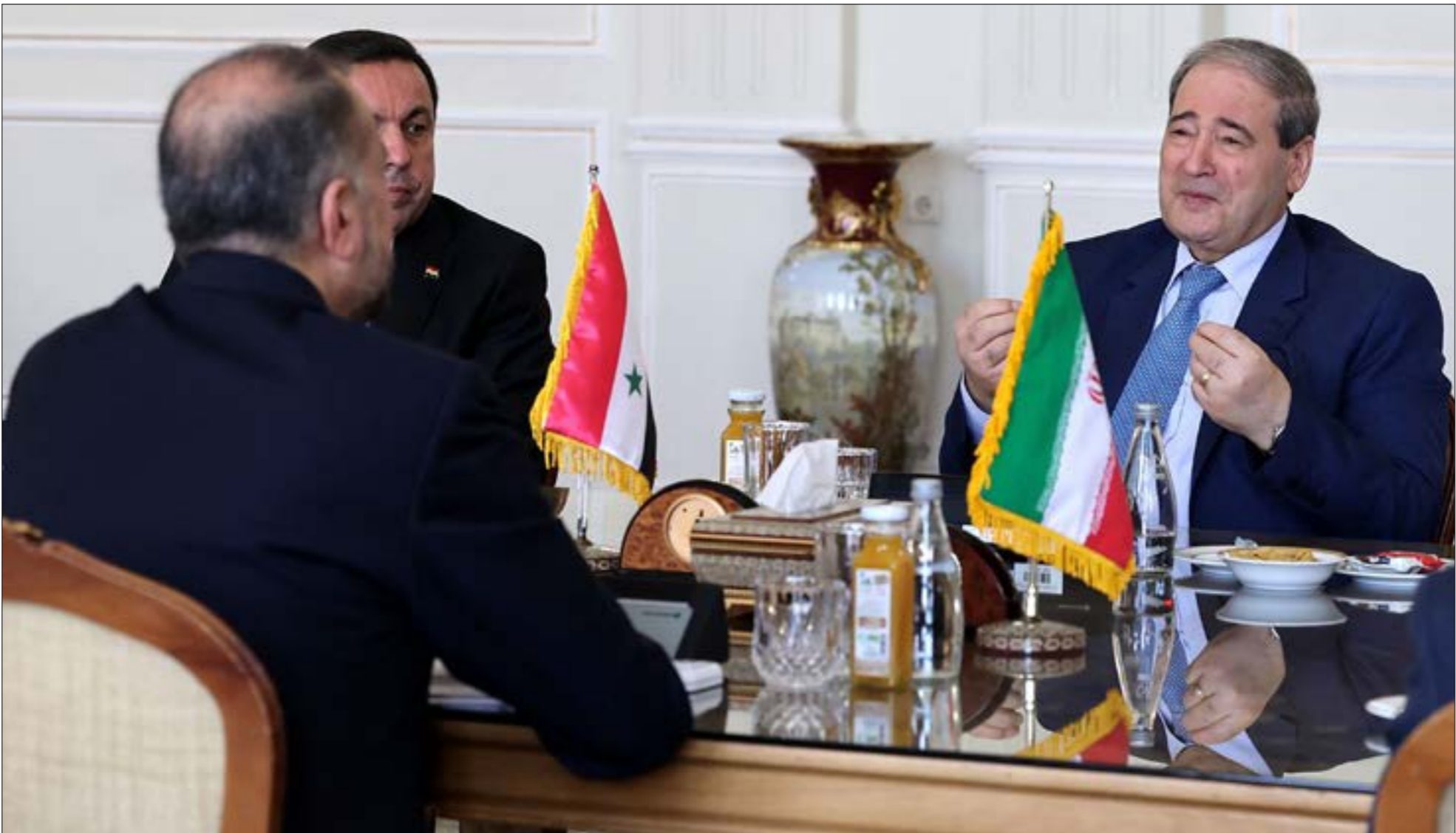
أثناء تصريحات المقداد، خلال زيارته أمس لإيران، بوجود ارتياح لدى دمشق إلى الجهود التي بذلتها موسكو وطهران