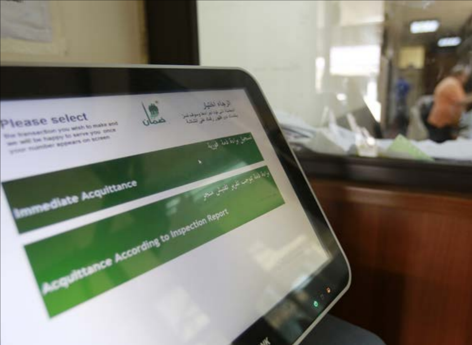
(موانع به حيدر)

قوى السلطة... كزت السجحة في كل الروابط حتى صارت كلّها «تحت السيطرة» ولا تختلف بكل المقاييس عن الاتحاد العمالي العام. كل المعارك التي خيضت سابقا تحت عناوين تشبّه «تصحيح الأجور حق»، أو