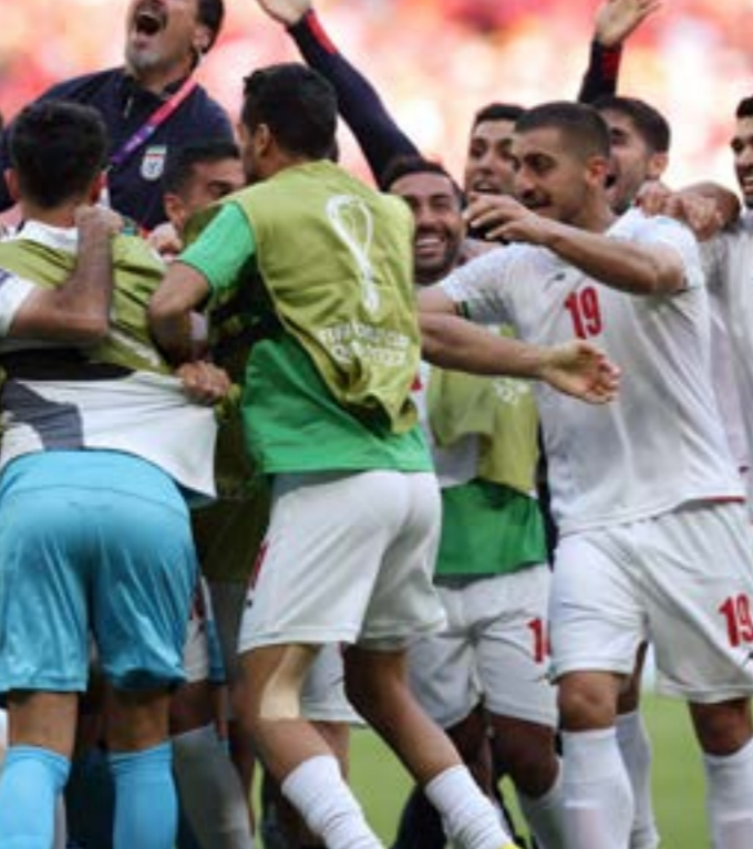
فخّم الإيرانيون مباراة كبيرة واستحقوا الفوز على ويلز (أ ف ب)

والجدريد ذكره أن تعاطف قوة المنتخب أميركا الجنوبية وخاصة البرازيل يترافق مع تراجع مستوى المنتخبات الأوروبية، التي يمر أغلبها بمرحلة إعادة الهيكلة. وسوسط ديناميكياً إضافة إلى هجوم مليء بالمواهب، يجعل رفاق نيمار وتياغو سيلفا المرشحين