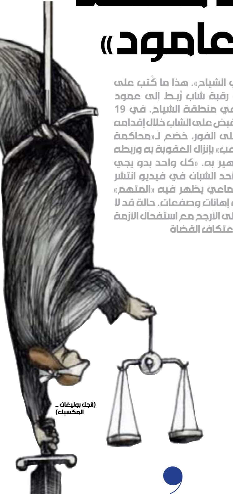
الجدك روليفات - المكسك

في ظل اعتكاف القضاة واحتفاظ السجون البعيدة كل البعد عن وظيفتها الأساسية بالإصلاح وإعادة التأهيل وحتى الردع، يُقدّم العديد من المواطنين على استيفاء الحق بذاتهم، ولا يقتصر الأمر على ذلك فقط، بل يتجاوزون استرجاع حقهم إلى التعدي على حقوق الغير، الاعتداء الجسدي والمعنوي، الإهانات العنصرية والطائفية، تعليق الآخرين على الأعمدة. شرعية الغياب تحمك لبنان. لكن هل هي فعلاً ما يريد المواطن؟ في شرعية الغياب الأقوى هو الذي يحكم، فماداً لو افترضنا أن قام أحد باستيفاء حقه من آخر بالاعتداء عليه وإذاله، لينتج بعد ذلك أن العددي عليه من عائلة أو عشيرة ذات نفوذ ردت على هذا الاعتداء بالقوة والسلاح، فهل تم بذلك إحقاق الحق والانتصاف؟ هل شرعية الغياب هي الحل؟ أم أنّها دائرة من العنف والقتل التي لا تنتهي؟ ليست الضابطة العدلية والسلطة القضائية المسؤولين الوحيدين عن حماية المجتمع، بل تقع هذه المسؤولية على المجتمع ذاته. فرغم الظروف المعيشية الصعبة والضيق الذي يترافق في صدور المواطنين، يبقى اللجوء إلى القضاء وقوى إنفاذ القانون لإحقاق الحق، السبيل الوحيد للوصول إلى العدل والانصاف.