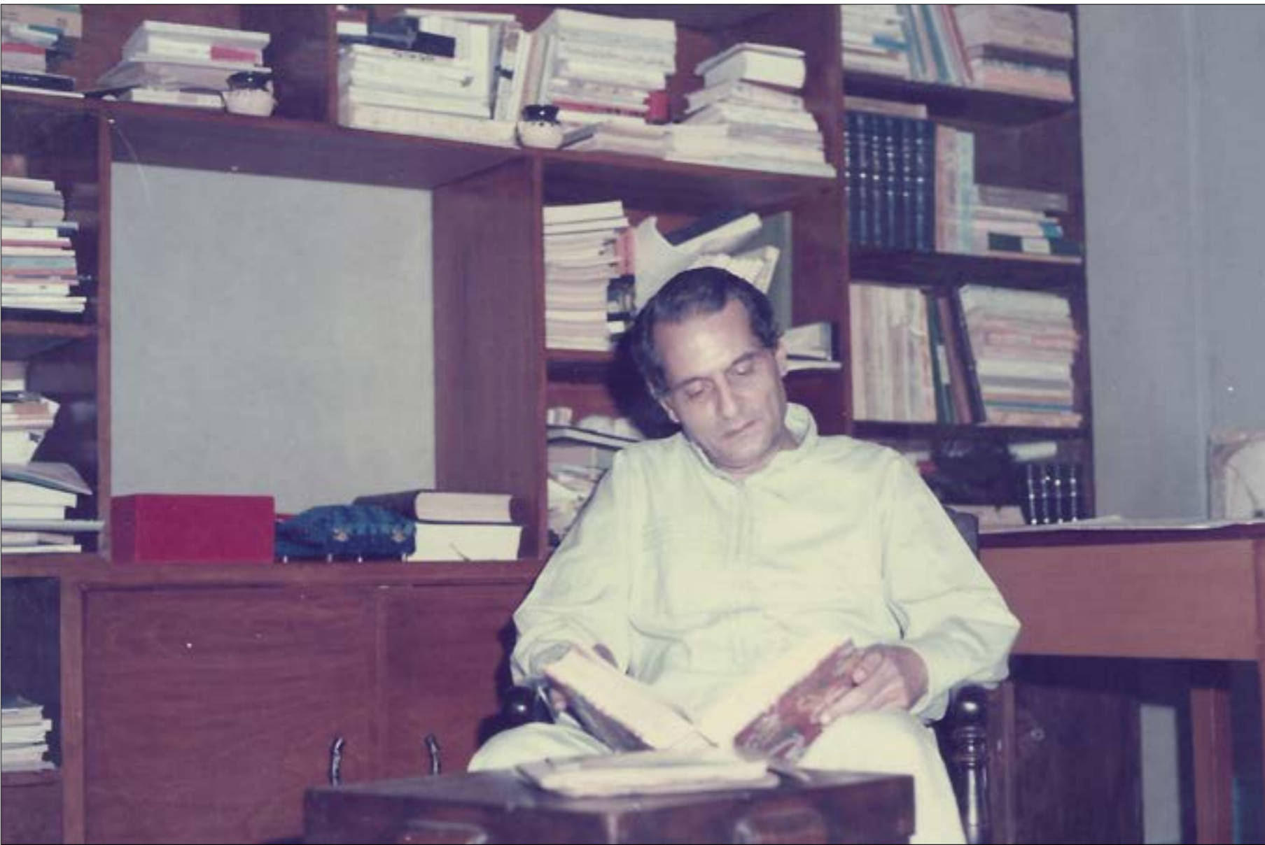
كتب الكثير من القصائد والدواوين عن فلسطين والمقاومة

كان لحداد تجربتان في المعتقل، الأولى عام 1953 وحتى 1956، واعتقل مرة ثانية عام 1959 وحتى 1964 أعضاها في «سجن الواحات». وسط ضجيج التعذيب والعمل في الزراعة في مرحلة السجن الثانية، ومن كل القرى والبلد والنجوع.