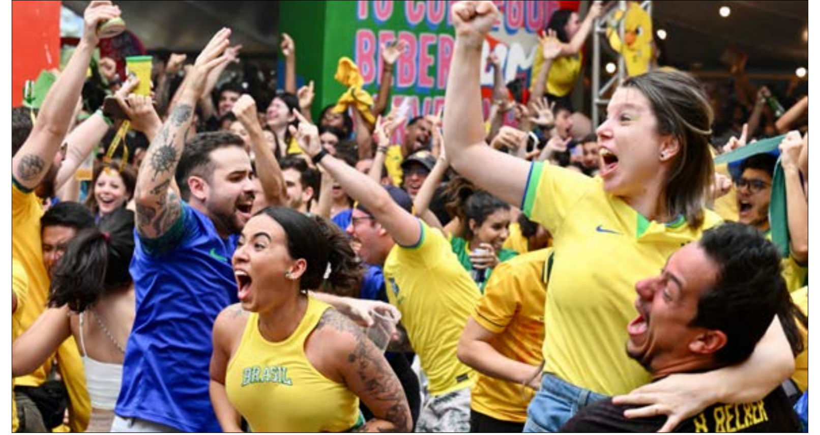
تمتلك البرازيل جميع المقومات الفوز باللقب

عزّز الأداء الكبير الذي قدمه المنتخب البرازيلي أمام صربيا يوم الخميس الفائت صموديات جماهير «السيليساو» وأميركا الجنوبية الطامحة لاستعادة اللقب اللافت منذ «القارة العجوز». فازت الدول الأوروبية ببطولة كأس العالم في نسخها الأربع الأخيرة. ولكن يبدو أنّ الوقت حان لكي تعود الأفراح إلى «أرض السحرة» في عالم كرة القدم