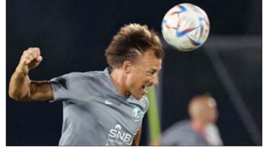
عمك رونارد يجمع القمامة بداية حياته

يغامر ويلعب بطريقة خط واحد (خطة التسلل). لم تر مثل هذه الخطة منذ الثمانينيات». تفوّق تكتيكي سجله الفرنسي على رونارد، الذي قاد «الصقور» إلى فوز هو الأول لمنتخب عربي على الأرجنتين في تاريخ المونديال، وثاني فوز عربي على منتخب من أميركا الجنوبية في كأس العالم منذ فوز الجزائر على تشيلي في نسخة عام 1982. واعتبر التمراني أن «عبقريّة» المدرب الفرنسي تجلّت عندما نجح بإدارة اللاعبين خلال مباراة الأرجنتين، عقب خروج قائد المنتخب سلمان الفاضل مصاباً في نهاية الشوط الأول، وأضاف: «لم نر أن الفريق تآزر، بل على العكس، كان لتعليمات رونار مفعول السحر على اللاعبين». وتابع: «رونار فاجأنا وفاجأ الجميع على مستوى العالم في خطة اللعب. لا يوجد مدرب