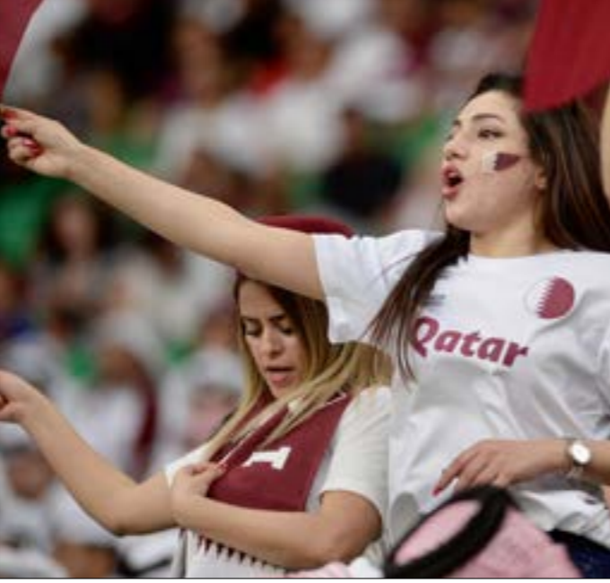
خبر الجمهور القطري والصربي خابيا بعد إقصاء قطر من المونديال (الدوحة-طلالك سلمان)