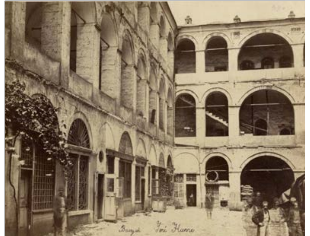
باحة «خان بيروت»، (مصور مجهول، حوالي عام 1891)

تأديت كنما قبل نحو ثماني سنوات، أفرج الكاتب والباحث اللبناني بدر الحاج عن كتاب «بيروت ضوء على ورق 1850، 1915» («دار كذب للنشر») الذي راودته فكرة إصداره بعدما راكم في مجموعته الخاصة صوراً غير معروفة سابقاً التقطت في بيروت منذ مطلع خمسينيات القرن التاسع عشر وحتى العقد الأول من القرن العشرين. خلال تلك المرحلة، حدثت تطوّرات جذرية في المدينة على الأصعدة كافة، واحتلّت «ست الدنيا» المركز الأول لإنتاج الصور الشمسية في المنطقة. إذ أقام فيها المصورون