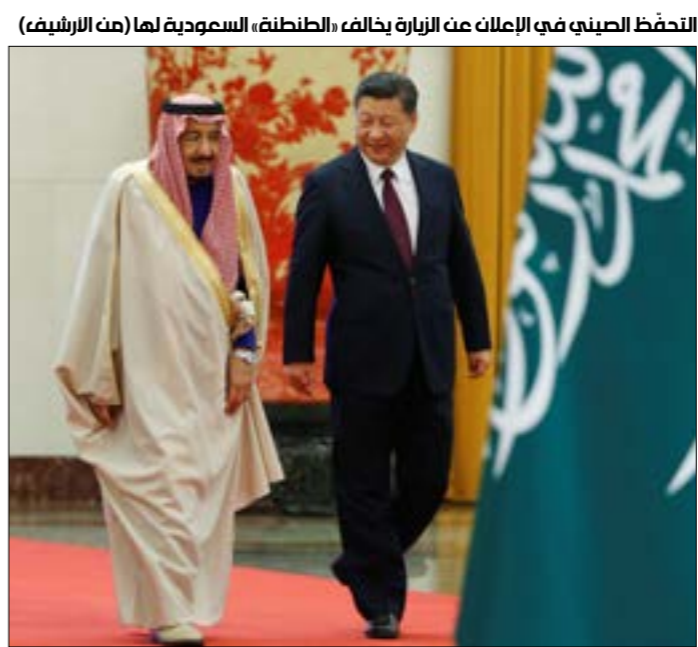
التخطّ الصيني في الإعلان عن الزيارة بخالف، «الطنطنة، السعودية لها

الأوسط، لتحويل مجهودها ضدّ بكين، إلى شرق آسيا، وفق السياسة التي رسمها الاستراتيجيون الأميركيون خلال رئاسة باراك أوباما، وهو ما اعتبره السعوديون تهديدا كبيرا لهم، خاصة وأنه تبعه السكوت عن وصول «الإخوان المسلمّين» إلى السلطة في