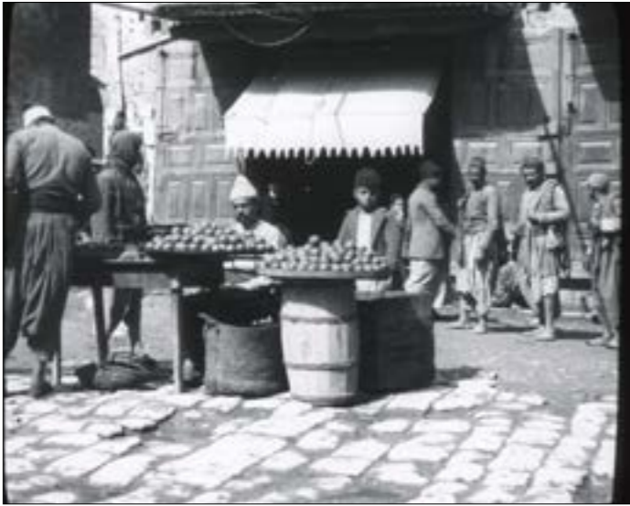
باحة اليرزقاع في المدينة القديمة (مصور مجهول، حوالي عام 1885)