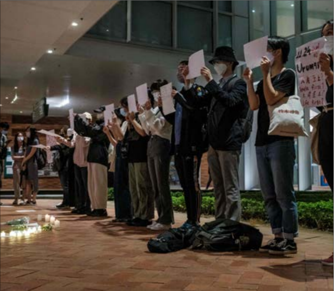
بدأت الاحتجاجات من شينجيانغ شمال غرب الصين، عندما لقي عشرة أشخاص حتفهم في حريق اندلع في

لكن الاحتجاجات التي بدأت على نطاق مدينة في مقاطعة صينية، سرعان ما توسّعت لتشمل كبرى المدن، وخصوصاً بكين وشنغهاي، وباتت تطالب إضافة إلى إنهاء «ذي دخل منخفض لتسريعات السياسية، وأحياناً باستقالة الرئيس شي جين بينغ، في مواجهة نقول وسائل الإعلام الغربية إن البلاد لم تشهد مثيلاً لها، لجهة