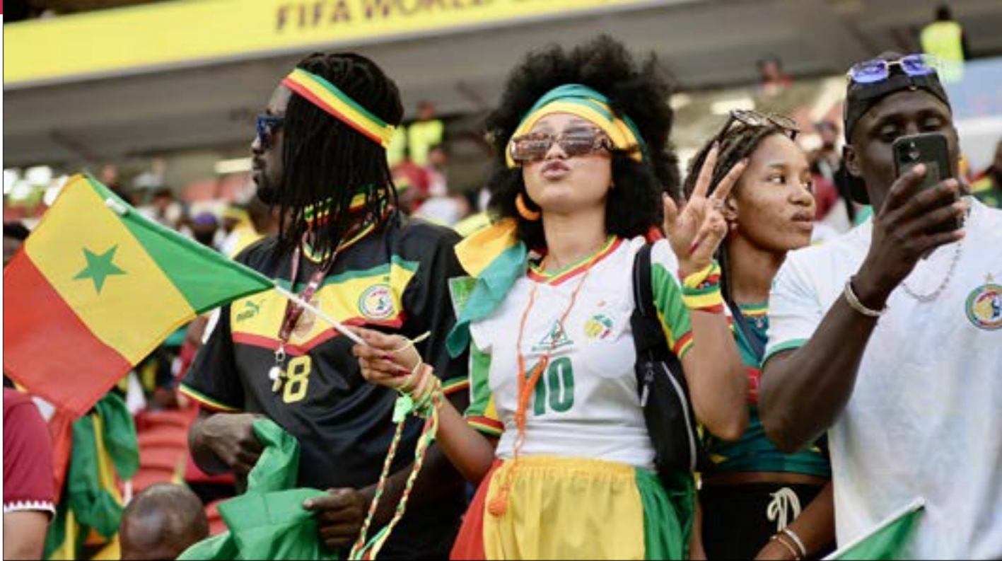
(الدوحة، طلاك سلمان)

انتهى مشوار المنتخب القطري في الموندبالي، ولكن يبدو أن الجماهير ستبقى حاضرة على مقاعد قطر للموندبالي، وكذلك الأمر بالنسبة لضيءاء القادمين من المغرب. يتحدثان عن أهمية إقامة مثل هذا الحدث في الدوحة. «أنا أعتقد أن العالم كله في دارك ليس بالأمر العادي، إنه شرف لهذا البلد ولشعبه من مواطنين ومقيمين». الحضور الجماهيري الداعم لقطر ينشد تواجداً سعودياً كبيراً أيضاً.