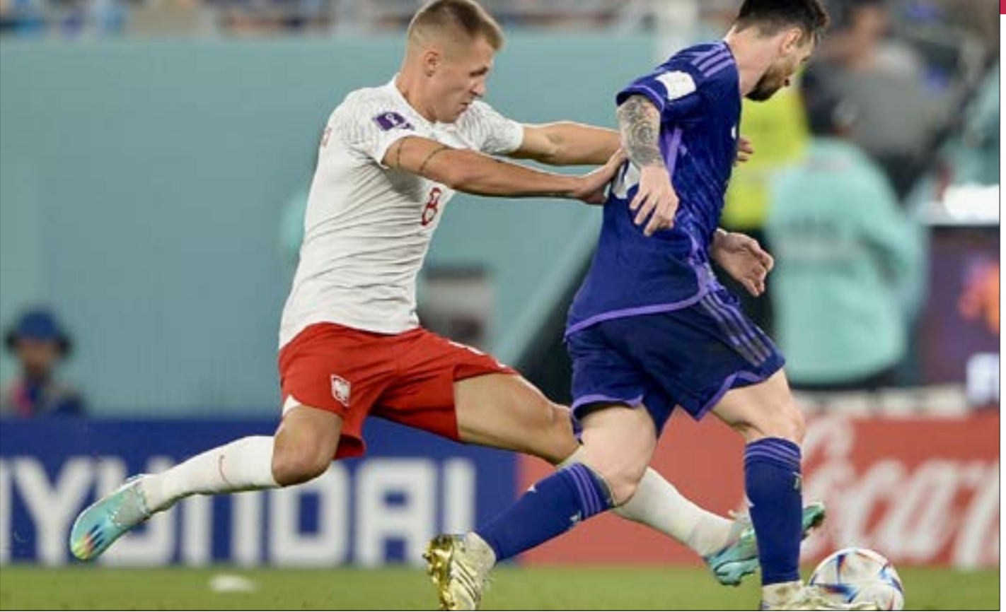
فدّم المنتخب الأرجنتيني، اداء هميرا امام بولندا (الدوحة - طلال سلمان)

الفرص على الشوط الأول توالى الفرص على مرمى الحارس تشيزني الذي وقف كالسد المنيع أمام لاعبي التانغو. تحرك دي ماريا بشكل فعال على عكس أول مباراتين، مقابل خطورة واضحة شكلها ليونيل ميسي والغارينز وماكستر. ليونيل تحصل على ركلة جزاء عند الدقيقة 39، إلا أنه أضاعها بعد تالف تشيزني، الذي صد ركلة الجزاء الثانية له، بعد كرة صال الدوسري في مباراة السعودية. في الشوط الثاني تغير كل شيء، دخل الأرجنتينيون بقوة وثقة، فسجلوا المجموعة الثالثة مع 6 نقاط، مقابل 4 لكل من بولندا والمكسيك، و3 للسعودية. وتاهلت بولندا رفقة الأرجنتين إلى الدور الثاني، على حساب المكسيك بسبب حصولها على عدد بطاقات أقل، بعد تعادلهم بالنقاط وبعدد الأهداف.