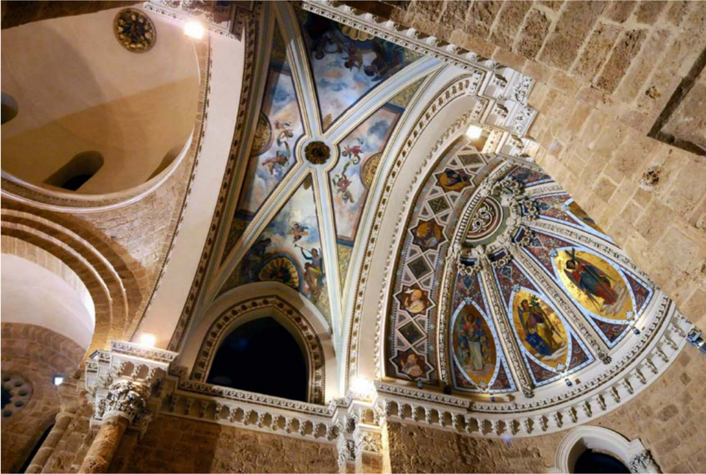
كاتدرائية مار لوبس للآباء الكويشيت في باب ادريس (بيروت)