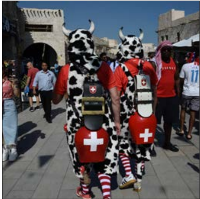
مشجعون سويسريون يرتدون ملابس احتفالية

يتنفسون كرة قدم. يتكلمون كرة قدم، ويعيشونها بكل تفاصيلها. حتى رغم تعب العمل المتواصل تراهم سعداء، فهم يعملون حجم الإمتياز الذي حصلوا عليه قبل 12 عاماً. حين نتحدث عن عيش كرة القدم، يكون الجانب الفني في آخر الاعتبارات. المونديال في الدوحة بحضور حوالي مليون ونصف مليون سائح ومشجع أبعد من فوز وخسارة وتحقيق نقاط.