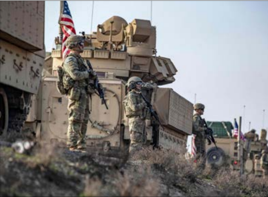
ترسم الأوضاع الحالية صورة شديدة التعقيد للمسارات السياسية والميدانية

الإرهاب». لكنّ مصادر كردية تؤكد، في حديث إلى «الأخبار»، أن هذه الخطّوط لم تجد نفعا حتى الآن، مشدّرة بمحاولات «قسد» ابتزاز الأميركي، تمثّل للقوى الكردية أحد تجسيد العمليات المشتركة مع «التحالف الدولي»، وهو ما باء بالفشل أيضاً بعد الإعلان عن عودة العمليات، وتشير المصادر إلى أنّ واشنطن جدّت محاولتها إجباة خطّتها لربط المناطق الخارجة عن سيطرة الحكومة «الإدارة الذاتية» في الشمال الشرقي ومناطق سيطرة الفصائل المدعومة تركيا في الشمال) من البوابة الاقتصادية، مع