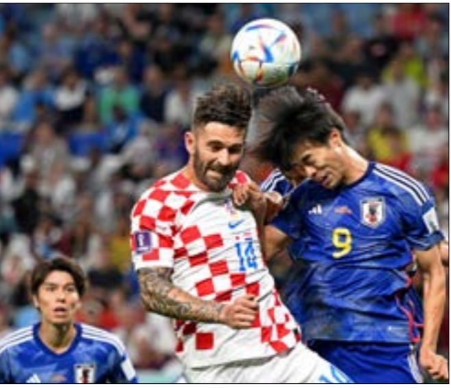
لعبت كرواتيا مع اليابان 120 دقيقة هم ركلات الترجيح قبل أن تاهك إلى ربع النهائي

جاء اليوم الثالث من الدور السادس عشر لبطولة كأس العالم لكرة القدم في قطر ممثلاً. نصفه الأول ماراثونياً مع فوز كرواتيا على اليابان بركلات الترجيح، ونصفه الثاني استمرارياً مع كرنفال أهداف برازيلية على حساب الشمشوم الكوريين