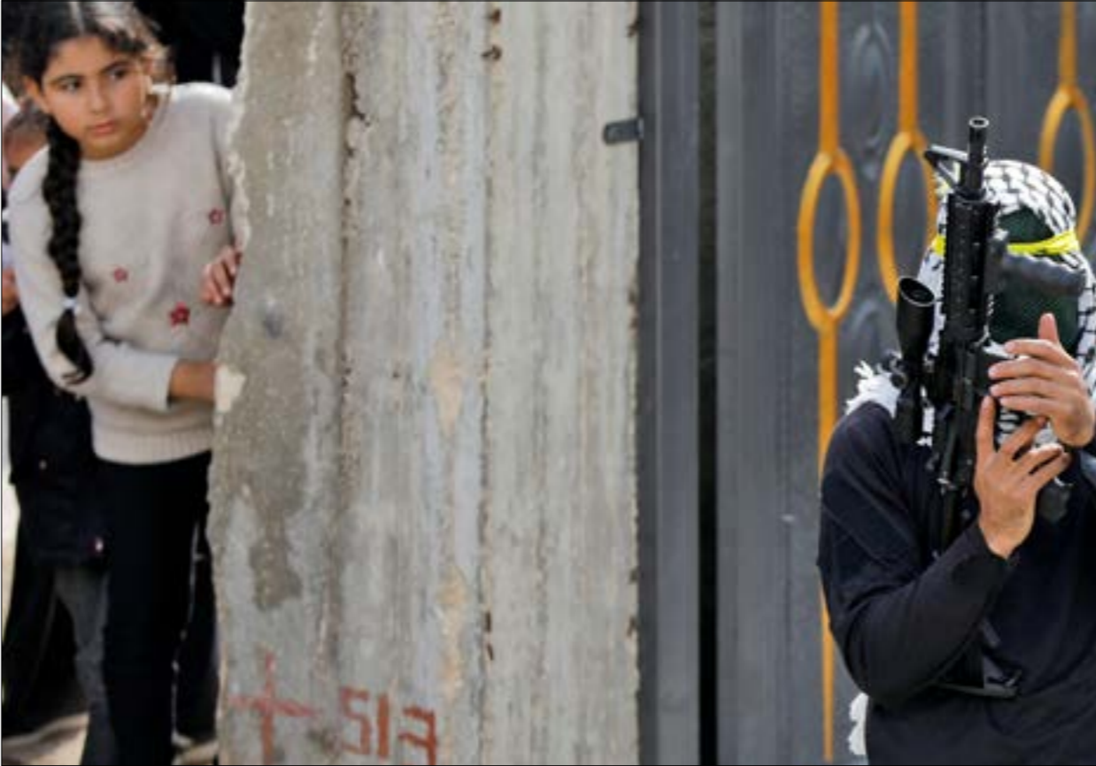
تمنّى رام الله نفسها بنجاح الإدارة الميريكية في كبح جماح الحكومة المقبلة

وعلى ضوء تلك التجربة، فإن السياسة الفلسطينية لن يطرا عليها أي تغيير، وهذا ما أضحّ في كلمة رئيس السلطة، محمود عباس، مساء الأحد، خلال افتتاح دورة «المجلس الثوري لحركة فتح»، حيث أعلن استمرار السلطة في «الانضمام إلى المنظمات الدولية، والتوجّه إلى الأمم المتحدة للحصول على العضوية الكاملة، ومطالبة الدول التي لم تعترف بفلسطين بالاعتراف بها، وحشد الدعم العربي والدولي للقضية الفلسطينية». ومواجهة التحديات الراهنة.»