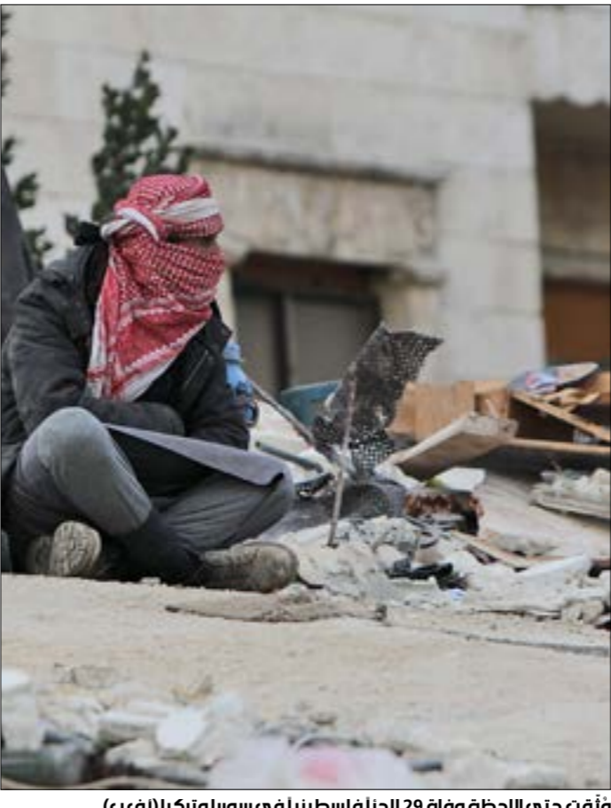
وقّعت حتى اللحظة وفاة 29 لاجئاً فلسطينياً في سوريا وتركيا

أضرار والمتضررين وتزويدهم بما يحتاجون، والأهم وجود عملية تنسيق أكبر وأشمل بين المبادرات بحيث تكون جميعها معتمدة على بيانات شكل صحيحة»، ويشذ الطبل