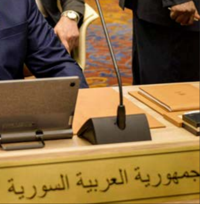
احرار الوفد السوري سلسلة لقاءات هم نظرائهم من مصر والامارات والجزائر والاردن والصومك وعمان والكويت وتونس وليبنان

للموصول إلى صيغة تفاهم «من شأنها توسيع قاعدة دعم مشروع القانون في الكونغرس، واستمرت حتى ساعات متأخرة من الليل خلال الأيام الأربعة الماضية. من دون توقف حتى في عطلة نهاية الأسبوع».