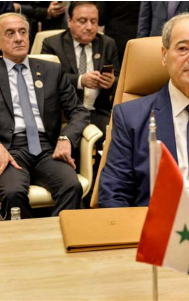
مندوبي الدول الداعمة لها في جنيف، تحت عنوان «المساءلة في سوريا»، يهدف إلى «توحيد الجهود لمواجهة موجة التطبيع مع دمشق».

وتشارك في اللقاء مندوبون من الاتحاد الأوروبي والمملكة المتحدة والولايات المتحدة وتركيا، أعداوا