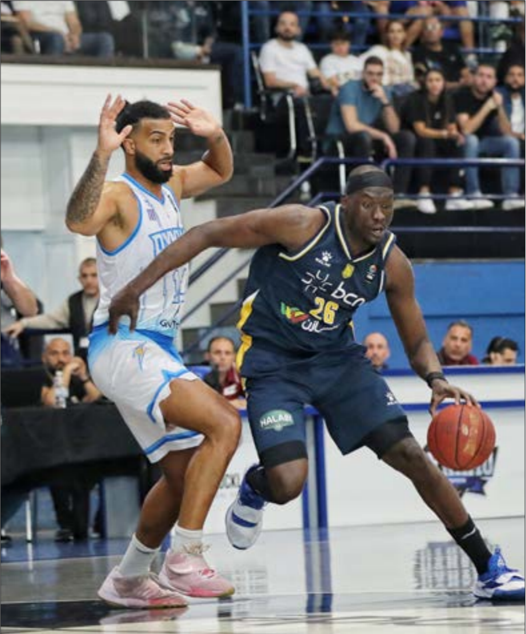
فاز الرياضي على ديناھو قبل مرحلة نصف النهائي (فادي مرف)

وبالحديث عن العنصر الحادي، تأكد أكثر بأن من يملك الميزانية الأقوى يمكنه الذهاب أبعد في مشوار البطولة، إذ لا مكان للمفاجآت هنا بل لمن يستطيع استقطاب أفضل. الواضح أن النادي الذي يحمل اسم العاصمة اللبنانية رفض الانجرار الى «إسازار» السوق غير الطبيعي، وهو أمر منطقي، وذلك بعكس بعض الأرقام التي يطلبها النجوم لتجديد عقودهم للموسم المقبل، أعاد الكلام في الكواليس عن عقود نوار عدة بفكرة العودة الى اعتماد الأول في تاريخه في الموسم الماضي، إذ عندما تخسر لاعبين من امثال عرجي، وهمايك، وسيرجيو درويش، لن تكون الأمور سهلة، علماً بأن