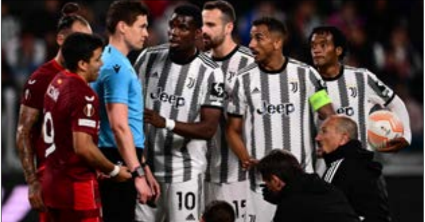
يخوض يوفنتوس المواجهة بعد ثلاثة انتصارات تواليها في الدوري المحلي (ف.ع.ب)