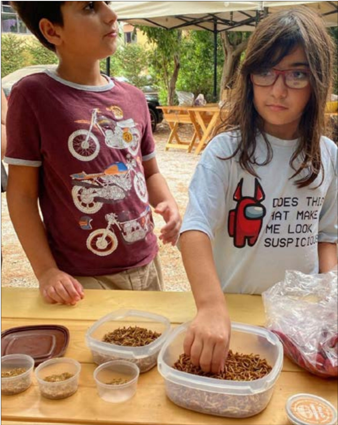
الحشرات موجودة أصلاً في نظامنا الغذائي لكننا لا ندرجها

وعن مدى تقبل الناس لهذه الفكرة يقول يمّين إن الأمر يختلف باختلاف الأجيال والمعتقدات، فالجيل الجديد يبدى استعداداً أكبر لتجربتها من الجيل الأكبر سناً، كما يرفضها البعض الآخر لاعتبارات دينية، وإذا