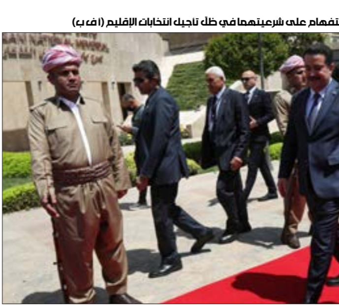
الحزبان الكرديان ارادا تجنب وجود علامات استفهام على شريعتهم في ظل نجاح الانتخابات الإقليم (ا ف ب)

في تصريح إلى «الأخبار»، إلى أن «بيننا تاريخاً مشتركاً ومصالحاً ويعتبر مشتركة منذ سنوات». ويعتبر أن «حلّ الخلافات داخل الإقليم سينعكس إيجاباً على استقرار الوضع الاجتماعي والسياسي»، معرباً عن تفاؤله بأن «تكون الخطوة القادمة هي التحضير لإجراء الانتخابات، ومناقشة المشاكل العالقة لخاصة توزيع الثروات النفطية بشكل عادل»، لافتاً إلى أن