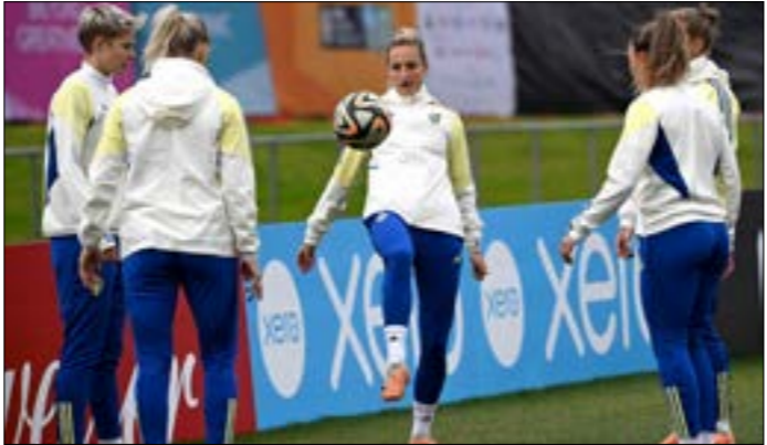
تلعب السويد مع إسبانيا اليوم في مباراة متقاربة

سيكون المنتخب الإنكليزي بطل أوروبا في مواجهة بلد بأكمله حين يلتقي غداً الأربعاء (الساعة 13:00 بتوقيت بيروت) في سيدني نظيره الأسترالي المضيف في نصف نهائي موندiale السيدات لكرة القدم، فيما يتحدّى المنتخب الإسباني خبرة نظيره السويدي حين يلتقيه اليوم الثلاثاء (الساعة 11:00) في أوكلاند. وحقق المنتخب الأسترالي إنجازه التاريخي بالتأهل إلى المربع الذهبي، بفوزه على نظيره الفرنسي بركلات الترجيح (6-7)، بعد تعادلهما في الوقتين الأصلي والإضافي من دون أهداف يوم السبت الفائت. أما المنتخب الإنكليزي فقد وصل إلى نصف النهائي بعد تجاوز كولومبيا القوية بنتيجة (1-2).