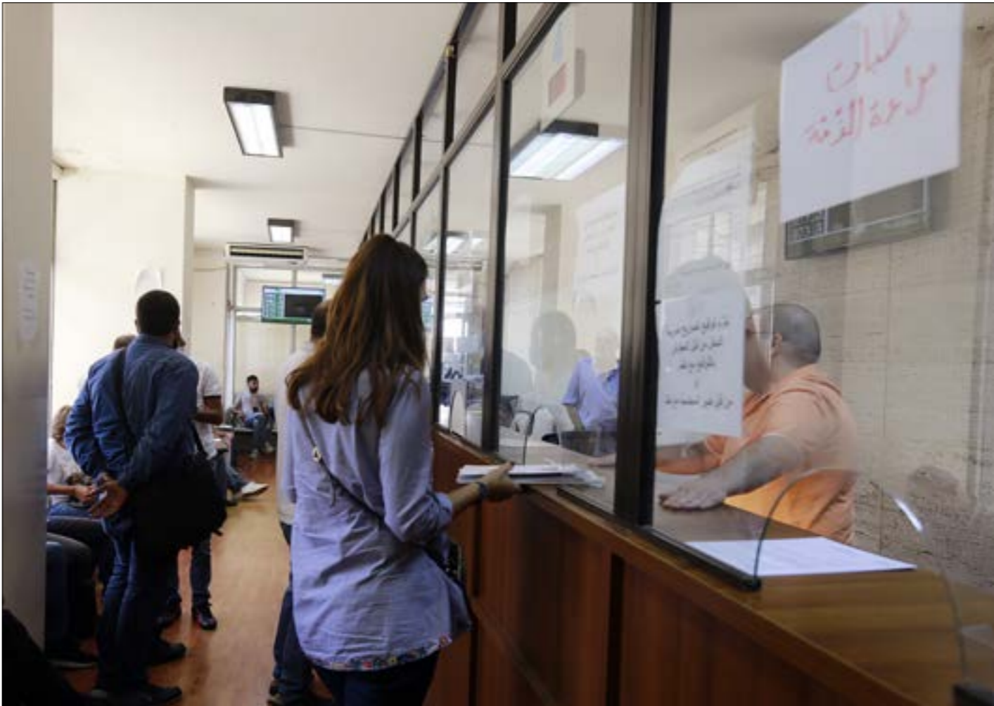
(مروان به حيدر)

مضاعفتها 3 مرّات بموجب موازنة عام 2022، ورفع الحدّ الأدنى للأجور في الضمان وفقاً للمرسوم 11226 الصادر في نيسان من العام الجاري، والذي أعطى «زيادة علاء معيشية للعامل الخاضعين لقانون العمل بقيمة أربعة ملايين ونصف المليون ليرة، وحدّ الحدّ الأدنى للأجر الشهري بسبعة ملايين ليرة». مؤسسة الضمان الاجتماعي شبه معطلة، وتعمل اليوم بسبب «موجب براءة الذمّة الذي يصدره الضمان للشركات فقط، ولولا وجوده لما دفع أحد اشتراكاً، ولانهارت المؤسسة تماماً»، حتى مستخدمو الضمان باتوا يلجؤون إلى شركات التامين للحصول على التخفية الصحية وفقاً لجوامي، الذي يشير إلى أنّ كلفة عملية جراحية أجرتها إحدى المستخدمة في الضمان بلغت 12 الف دولار بينما لم تتجاوز قيمة