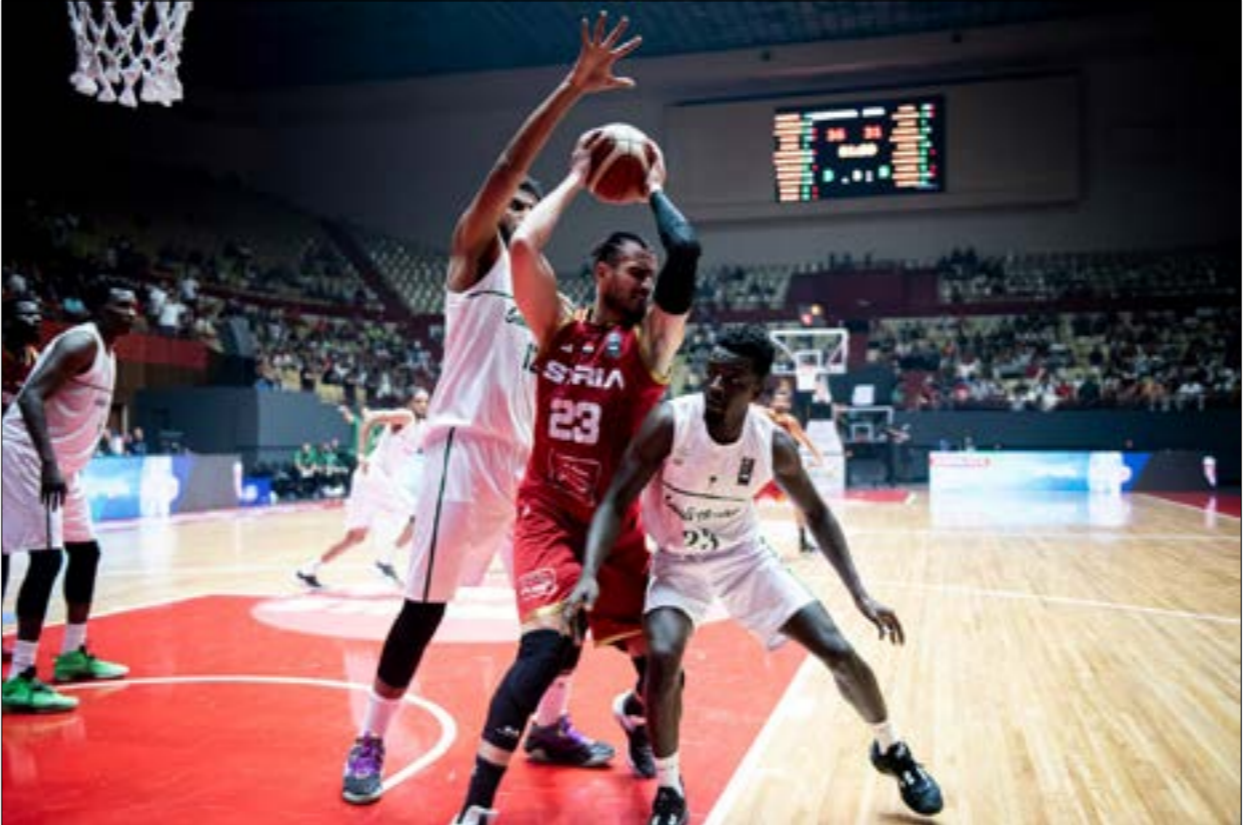
عادت الحياة إلى ملاعب كرة السلة السورية بقوة (محمد قزير)

الاقتصادية لأنها تعبّر عن الفرص ونبث الطاقة الإيجابية وتكرس المحبة، والأخلاق» ويضيف: «عندما يعمل أي شخص في القطاع الرياضي فإنه سيجالو بذل أفضل ما لديه، وهو مكان يحتاج إلى حلول مثله