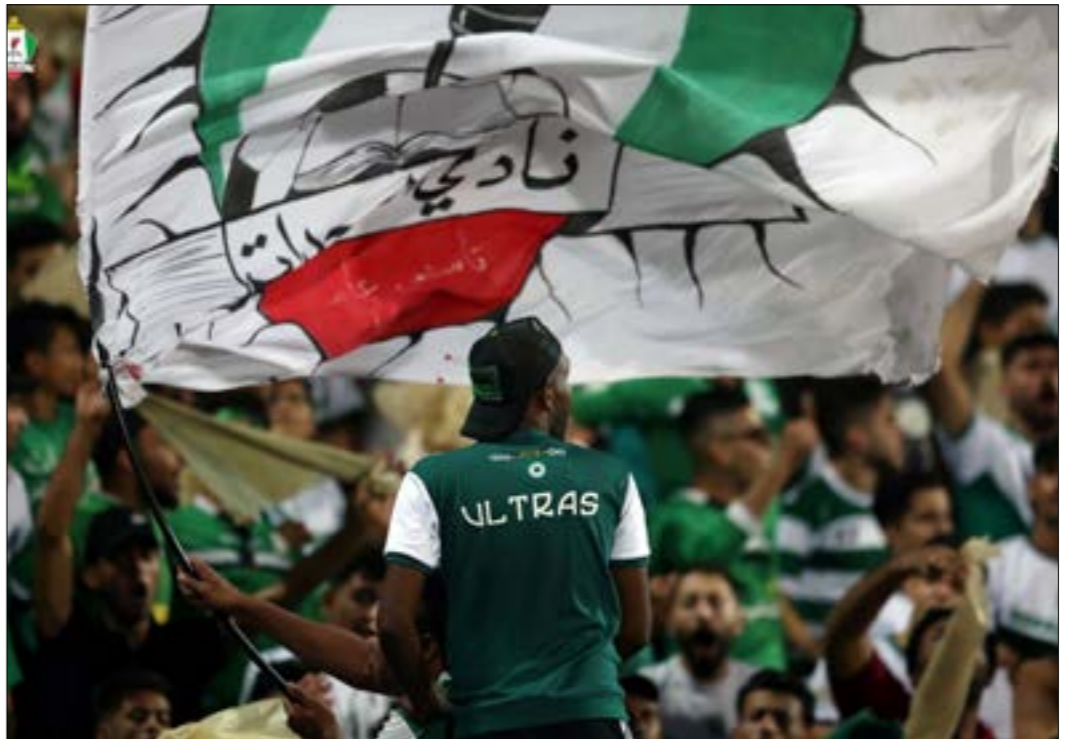
طالبات الجماهير ببدء خوض المباراة معتبرة أنها تطبيع مع الاحتلال (web)