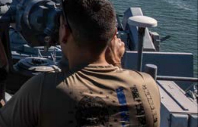
سرت، في الشهر الأخيرة، تكهّنات كبيرة حول وصول طهران وواشنطن إلى اتفاق مؤقت ومحدود، (أ ب ف)

تجدد الإشارة إلى أنه بعد الإعلان عن الصفقة المذكورة، ذكرت صحيفة «وول