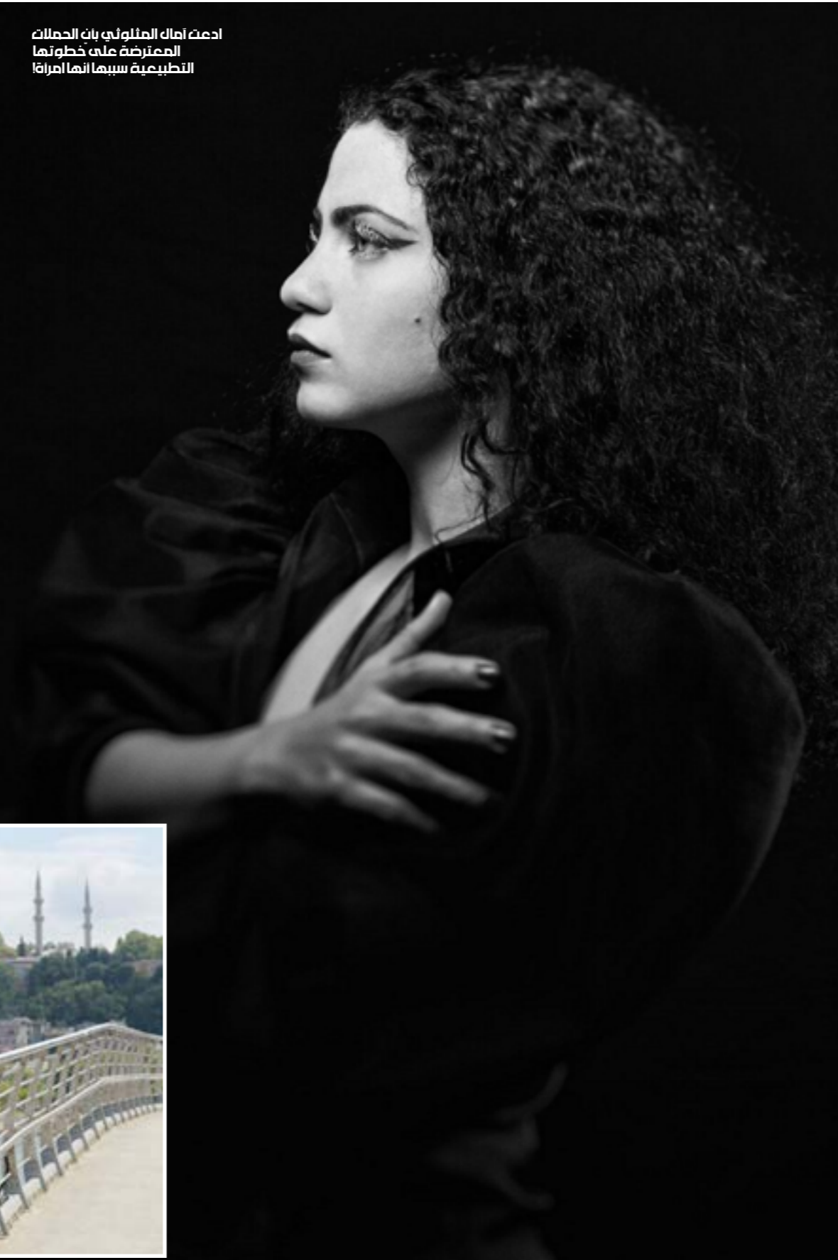
احدث أمال المثلوثي بان الحملات المضربرة على خطواتها التطبيعية سيما انما امرنا

يخولني محاسبة أي إنسان. لكني سأحاول هنا تنفيذ هذه المغالطات غير المبنية على حقائق. مغالطات يمكن وضعها في إطار الجهل أو في إطار محاولة تجهيل الرأي العام وتضليله. لن أناقش هنا رأبي في أدبيات حملات المقاطعة العربية، ولا الحدود الفاصلة بين الحق في ممارسة مقاطعة الظالم التي تهدف إلى نصرته المظلوم، وبين المشاركة في تطبيع شرعية الظلم في لاوعي الناس، فهذا الأمر يحتاج إلى طولات حوار بين المناضلين على أرض الواقع في الداخل الفلسطيني المحتل وفي المناطق التي تخضع لسلطة اوسلو وفي البلدان العربية المطبّعة وغير المطبّعة، إلى جانب عرض كلّ الهواجس والتحديات التي يواجهونها من خلال التماس المباشر