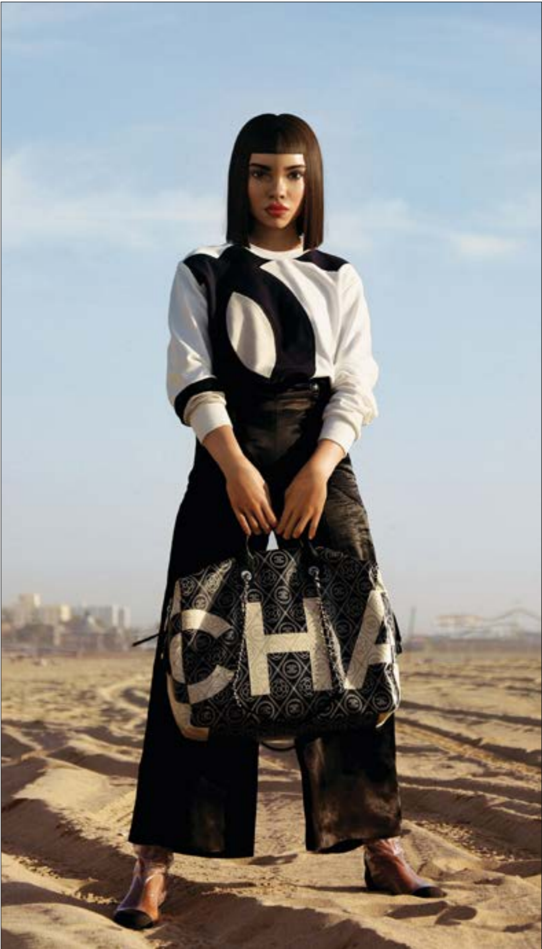
تتفاضل ليل ميكيلا، عارضة ألف دولار عنك بوكست

هذه الميزة لدى المؤثرين تجعل الشركات والعلامات التجارية في حاجة إليهم. وكنتنا في عصر الـديجيتال، فماداً لو كان هناك «مؤثر رقمي» مصنوع بواسطة الكمبيوتر يحاكي وظيفة المؤثرين البشر؟ هذا بدأ يحصل فعلاً. على سبيل المثال، هناك Shudu، أول عارضة أزياء رقمية في العالم. أما Miquela Li، فتؤثرة افتراضية، اكتسبت شعبية على منصات التواصل الاجتماعي مثل إنستغرام وتيك توك ويوتيوب. إنّها شخصية خيالية أنشأتها شركة ناشئة في لوس أنجلوس تدعى Brud عام 2016. ليل ميكيلا، واسمها الكامل ميكيلا سوزا، برازيلية - أميركية تبلغ 19 عاماً وتنتشر عن الموضة والموسيقى والغضايا الاجتماعية. تعاونت مع العديد من العلامات التجارية مثل «برادا» و«كالفن كلاين» و«سامسونغ»، وأصدرت أيضاً العديد من الأغاني. تملك أكثر من 2,8 مليون متابع على إنستغرام و3,5 ملايين متابع على تيك توك. ليل ميكيلا أكثر من مجرد شخصية افتراضية للتسويق، هي أيضاً لاد لسرد القصص. لديها قصة خيالية تتضمن شخصيات افتراضية أخرى، مثل «برودا»، مناصفتها التي تحولت إلى صداقة اخترقت حسابها في عام 2018. تتفاعل أيضاً مع مشاهير حقيقيين ومؤثرين، أمثال ديبولو وميلي بوبي