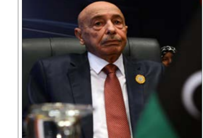
(أ ف ب)

عدّة عوامل جعلت من إبعاد صالح من المشهد فرصة لمزيد من التسييق والتفاهات الداخلية (أ ف ب)