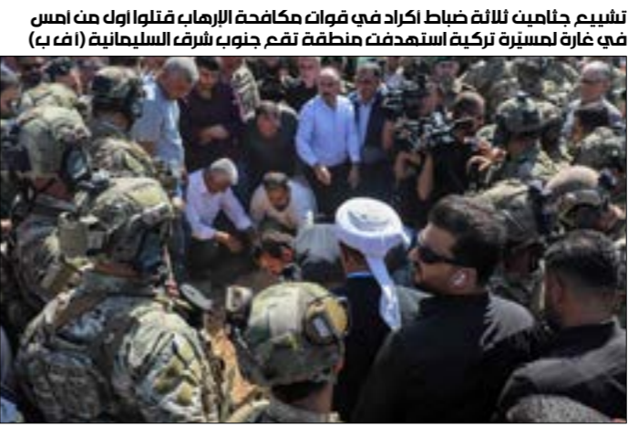
تشبيح جلايبي لثلاثة ضباط اكراد في قوات مكافحة الإرهاب قتلوا اولك ثم اسس في عارة لعسيرة تركية استهدفت منطقة تمق جنوب شرق السليمانية (أف ب)