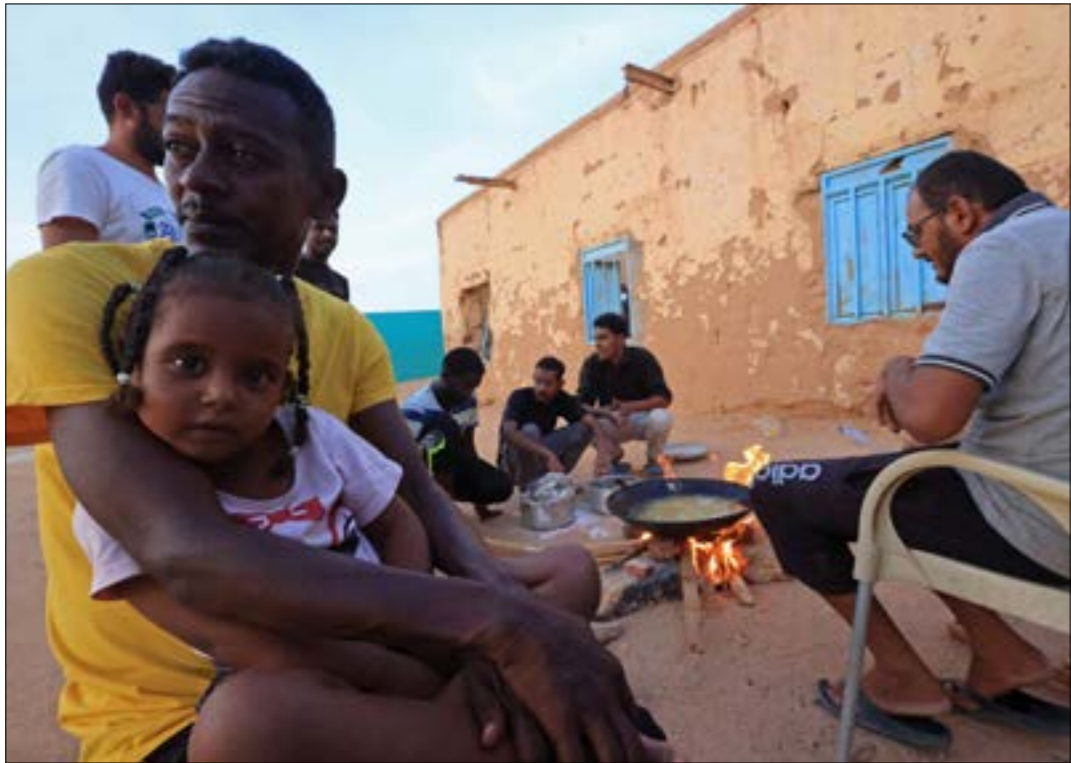
ضج حال تشكيل حميدتي حكومته، سيكون واقع السودان مهاللاً للمؤذجبت الليبي واليمني

في المقابل، يتوقّع السياسي العراقي المقيم في الولايات المتحدة، انتقاص قنن، أن «رسالة الكونغرس الأخيرة رئيساً ستدفع بايدين إلى الحديث عن الخلافات بين إقليم كردستان والمركز في بغداد، وعلى الجميع أن يتذكّر أن الكرذ هم حلفاء أكثر قرباً ووفاء للولايات المتحدة، فلذا، أزمة أربيل وبغداد ستطفي على الحوارات بين بايدين والسوداني»، ويعتقد، في تصريح إلى «الأخبار»، أن السوداني «ليس قادراً على إيقاف أحزاب في الإضرار من تلك التي جاءت به إلى السلطة والتي ترفض تقديم تنازلات لأربيل. فهذه مهمة صعبة جداً».