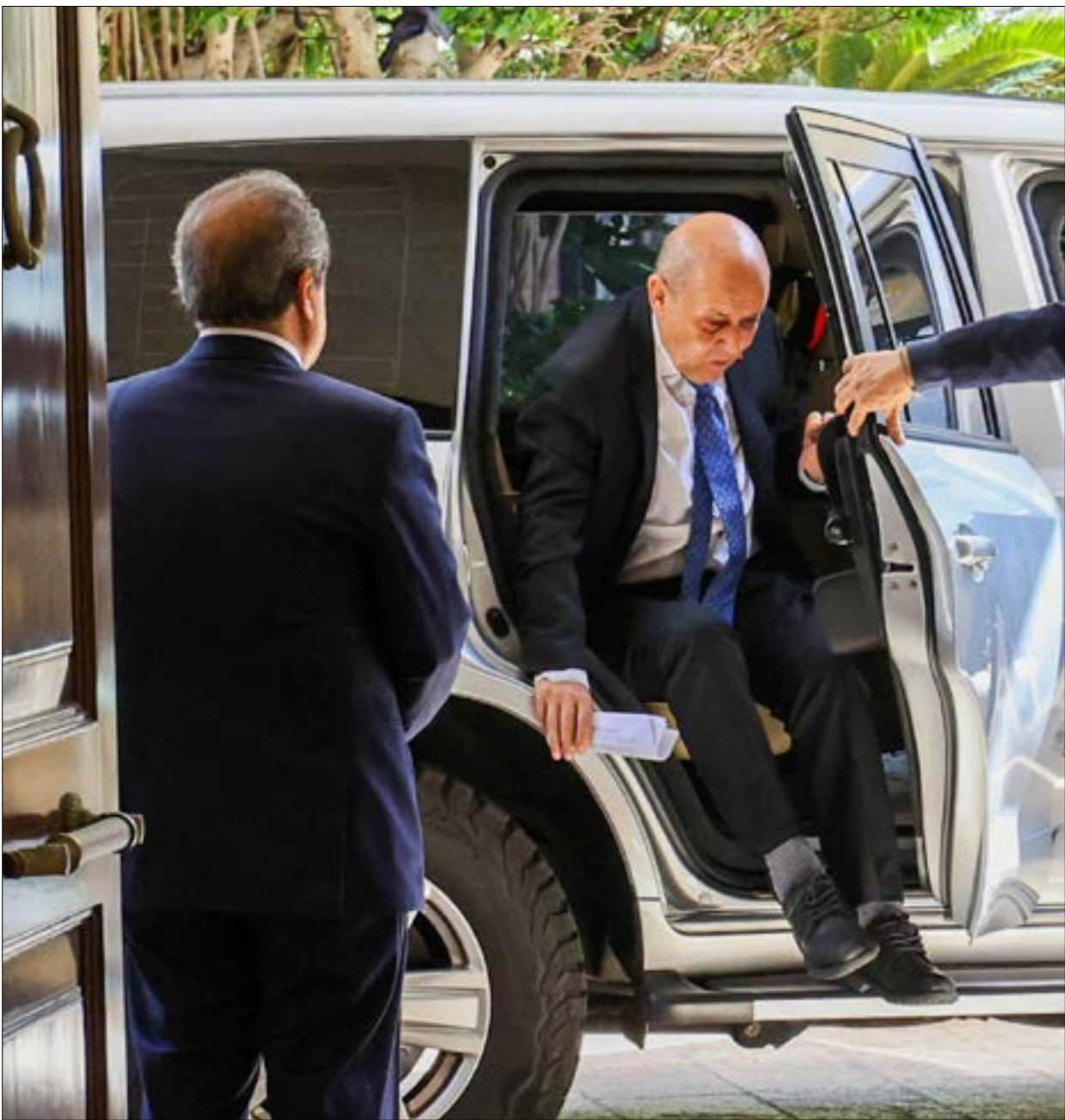
طلب الأميركيون وضع إطار زمني لمهمة لودريان وعدم ترك العهد مفتوحاً

وقد تمحورت الأخبار في اليومين الماضيين حول وصول وفد قطري إلى بيروت في محاولة جديدة لإنضاج تفاهم داخلي بموازنة من أعضاء «الخماسي»، مع تسريبات حول لائحة أسماء يحملها الوفد بتقدمها قائد الجيش العماد