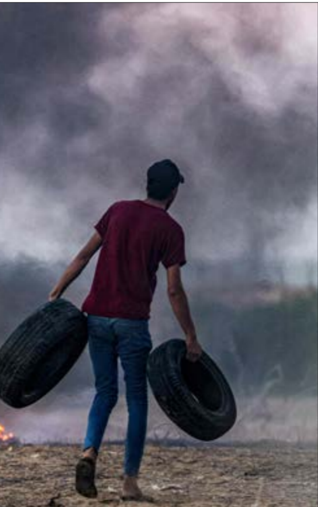
يسعى نتياهو إلى تجسيد الأصوات الخفية إلى عدم الاستجابة لمطالب الفصائل الفلسطينية في غزة

أما في الضفة الغربية، فلا يزال التهايب العسكري الإسرائيلي في أعلى مستوياته، مع استمرار ورود الإندارات من تنفيذ عمليات فدائية في الضفة والداخل المحتل، في وقت سجّلت فيه آخر هذه العمليات في مستوطنة «عسايل» جنوب مدينة الخليل المحتلة، ليل الأحد - الإثنين، حيث تسبّب إطلاق نار بأضرار في منازل المستوطنين، ليبلغ الاحتلال المؤدية إليها. كما سجّلت العشرات من عمليات رشق الحجارة والمويات الناسفة الملحمة الصنع، في مقابل تواصل هجمات المستوطنين واعتداءاتهم على القرى الفلسطينية. وفيما يواصل جيش العدو اقتحاماته