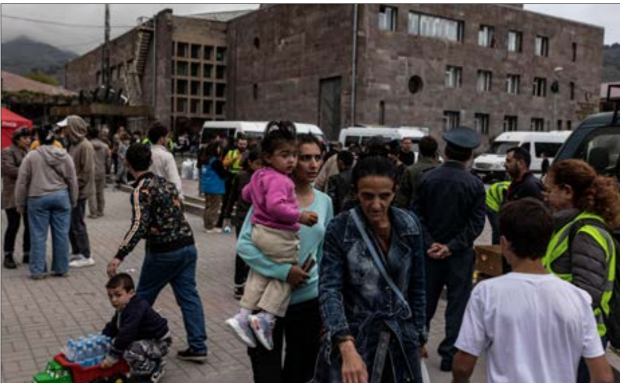
بانكروموا بعدأخر أن همز زنجيزور، والصراع عليه، سيكونوا وحدها من أبرز عناوين المرحلة المقبلة (ف ب)

وعن لقاء غرناطة أيضاً، يرى أوزاي شيندير، في «ميللييات»، أنّه «سيكون مهمّاً، ولكن كيف يمكن له أن يتعدّد برعاية رئيس فرنسا، والمستشار الألماني، ورئيس الاتحاد الأوروبي، في حين سينغدق البرلمان الأوروبي اليوم الثلاثاء ليبحث الوضع في قره باغ، ويوم الخميس لوحدة الوطنية، لكن ذلك لم يحصل، ومعتبر أن «هذه ليست سوى ديبلوماسيه حقهاء، ولا تحل أيّ مشكلة، أوروبا ليست في نيّتها حلّ ثنائيات على أنقرة، فإرمينيا في ذروة الهوس بالانضمام إلى حلف شمال الأطلسي، ولكن كيف يمكن تركيا أن توافق على انضمام بلد تعتبر أرمينيا الغربية (شرق