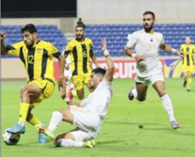
خسر النجمة امام الفئوة وفقد صدارة المجموعة الاولى (حسن نجسوت)