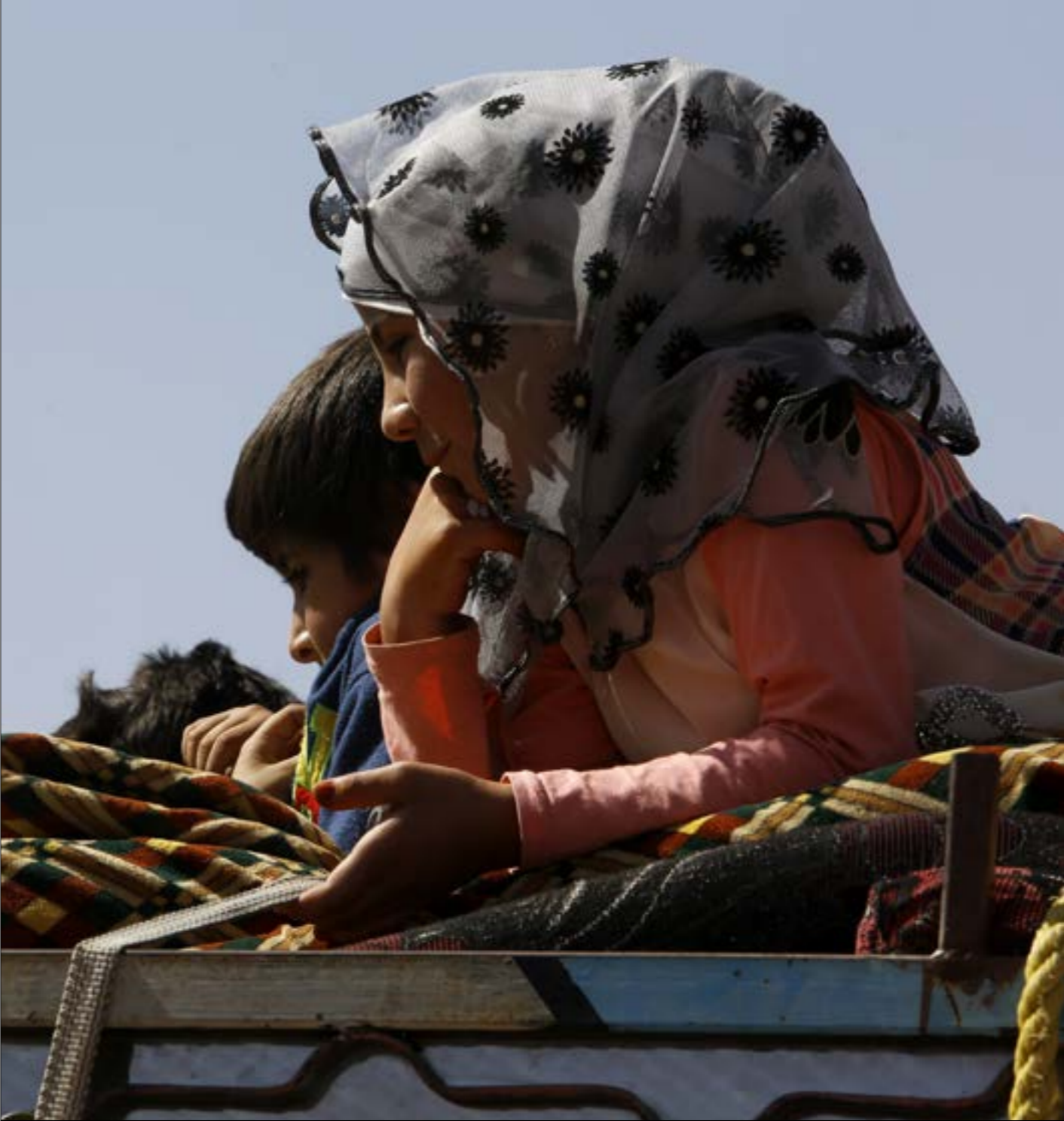
(أرشيف، موانع تحطّم)

وقال مرجع كبير معني بالملف له: «الأخبار» إن «الخطوات التي أنّخذت بعد اللقاء التشاوري ليست كافية». مشيراً إلى أنّ «لا أداة تنفيذية فعلياً للمقرّرات التي صدرت عن اللقاء. فلا المبادرات قادرة على القيام بما هو مطلوب منها كاملاً، ولا التنسيق بين الأجهزة الأمنية يجلب بالشكل المطلوب، فضلاً عن غياب القرار السياسي يفتح فتحة رسمية جديدة مع الدولة السورية، حيث يُقرض أنّ يبدأ الحل الجذّي». ولغت المرجع إلى أنه «في حال استمر الحصار الخارجي على سوريا، انهم لا يريدون الوقوف في وجه الخارج خوفاً على مصالحهم، ويعتبرون أنّ هذه الحكومة هي لتقطيع الوقت ليس إلا ولن يغامروا وغياب القرار السياسي». واعتبر