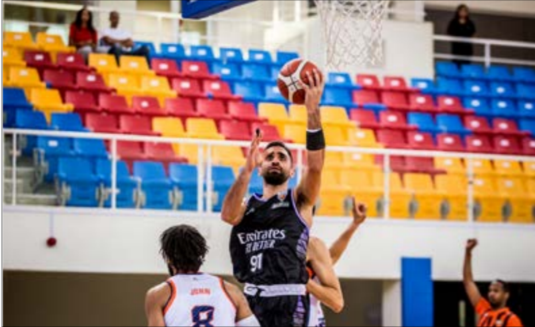
حقق بيروت لقب بطولة الودعة وعينه الثن على البطولة العربية

العربية وتلك التي تُقام على مستوى غرب آسيا والخليج. هذا التفوّق اللبناني يظهر اليوم بعد إحراز نادي بيروت فيرست كلوب لقب بطولة الودعة الدولية الودية قبل أيام، بعد تجاوزه مواطنه الحكمة في نهائيّ لبنانّي خالص. ومن الأمور اللافتة في هذه البطولة أن الحكمة وهو ليس في أفضل أحواله نتيجة المشكلات الإدارية التي يعيئنها بعد استقالة رئيس النادي، إضافة إلى نقص بعض المراكز، استطاع أن يتجاوز أندية قويّة كالزمالك المصري والفتح المغربي ودجلة العراق لاعيون شباب «مطمعين» ببعض لاعبي الخبرة قدموا صورة جيدة عن الحكمة وكرة السلة اللبناني رغم خسارة لقبهم الذي حققوه العام الماضي.