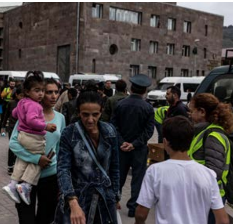
بانكروموا بعدأخر أن همز زنجيزور، والصراع عليه، سيكونوا وحدها من أبرز عناوين المرحلة المقبلة

إلى ذلك»، وتجاوز فيكو، في الأشهر القليلة الماضية، خلافات سابقة مع أوربان، حول التقييمات القومية المتباينة في شأن تاريخ سلوفاكيا، ضمن الامبراطورية الجرية، وموقع الأقلية الجرية الكبيرة في المجتمع لتشكيل ائتلاف مستقرّ، بق فورّه الحاسم في الانتخابات جرس الإنذار في واشنطن وبروكسل القلقتين من بروز صوت أرمنها للمنظام