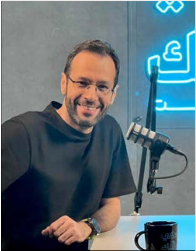
مالك مكتبي: اراهن على محتوى جديد ومهم