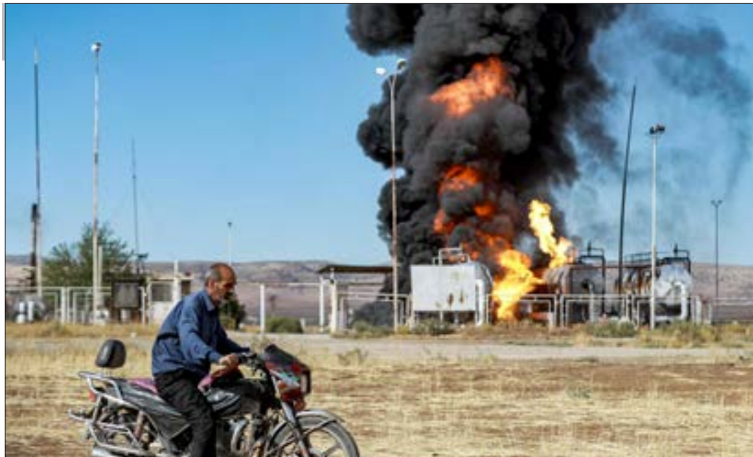
طاول القصف لثلاث محطات نفطية، هي السعيدة واله قوس والرزارية

في تغريدة عبر منصة «إكس» تركيا، بـ«البحث عن ذرائع لشرعة هجماتها المستمرة على مناطقنا وشنّ عدوان جديد، وهذا ما يثير قلقنا العميق». والواقع أنّ القصف التركي انتقل من شمال غرب الحسكة إلى مناطق شرقها، مشيرة إلى مقتل 6 من عناصرها و2 من المدنيين كحصيلة أولية للهجمات». كما أفادت وسائل إعلام كردية، ومعها «المرصاد» المصارف، بـ«إسقاط أميركيين طائفة مسيرة تركية من الضحايا». كذلك، أعلن «الاتحاد السوري لكرة القدم» تعليق كلّ نشاطاته الجوي إلى هجمات برية جديدة على مناطق سيطرة «قسد».