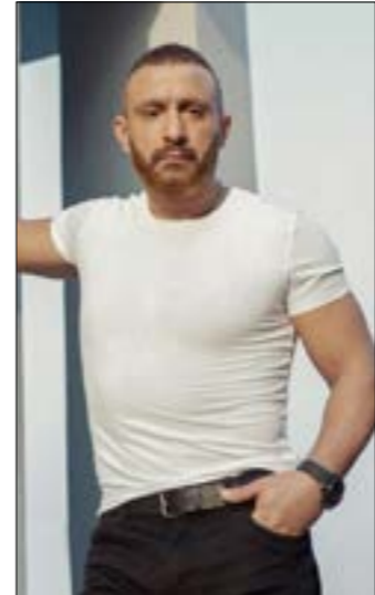
اكتشف أحمد السقا بتصريحات صحافية مؤيدة

على الضفة نفسها، يرفض مكتبي التطرّق إلى الموسم الجديد من «أحمر بالخط العريض»، معتبراً أنه يركّز حالياً على «احكي مالك» على أن يُبت العمل على «شاهد» مرتين في الشهر، وتوقف مدة كل حلقة بحسب الضيف والقصة التي يسردها.