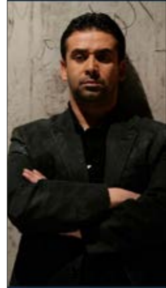
بدا كريم عبد العزيز كأنه ينطق بكلمات أملت عليه