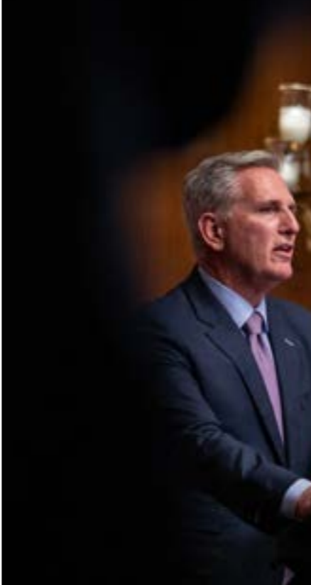
حنس عزل مكارثي على يد الحزب الديموقراط، الذي صوّت جميع نوابه لمصلحة اطاحته

التي جرت تحت قبة الكونغرس، من شأنها أن تضخّ الحزب الجمهوري، ولا سيما جناحه المتكاتف،