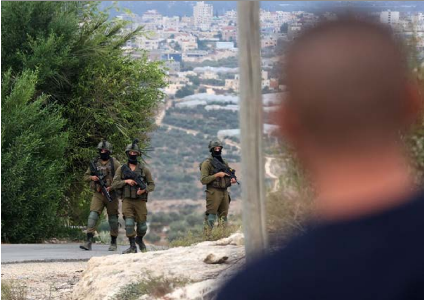
التصديد يبدو نتيجة طبيعية لتعاقد المعتدء، إذ على المسجد الأقصى

بالقول: «اقتحامي للأقصى أمر مقدّس لكن التوقيت ليس كذلك»، ووفقاً للقنّاعة، فإن طلب رئيس «الشاباك» جاء على خلفية الوضع