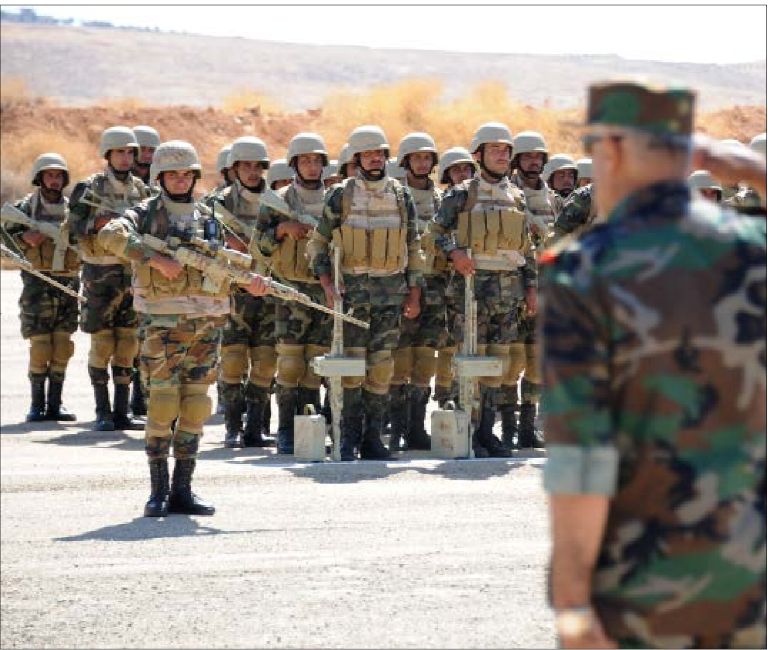
سُنّت طائرات مسيرة هجوما على حفل تخريج دفعة من الضباط في الكلية الحربية في منطقة المور في مدينة حمص

العامّة» في بيان وزارة الدفاع السورية إلى «المجموعات الإرهابية المدعومة من قوى دولية معروفة»، وحملة القصف غير المسبوق منذ سنوات على مواقع الجماعات المسلحة في إدلب ومحيطها. لكن ما ظهر يكفي للسؤال عمّن يمتلك هذه المقدرات التقنيّة والاستخباراتية، لتنفيذ اعتداء خطير من هذا النوع، بتخطيط شديد الدقّة، ويتجنّب الإعلان عنها؟